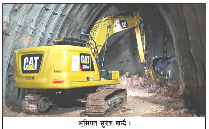
भूमिगत सुरङ खन्दै।