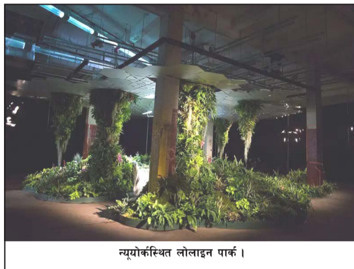
न्यूयोर्कस्थित लोलाइन पार्क।