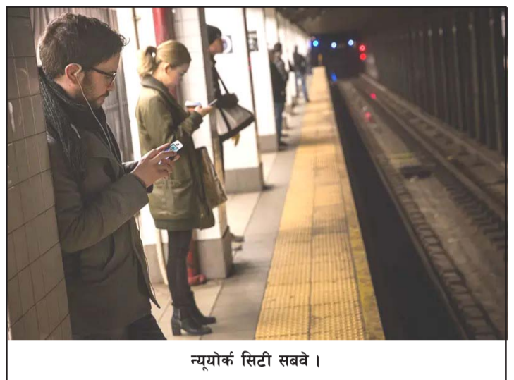
न्यूयोर्क सिटी सबवे।

सक, जहाँ मानिसहरू वर्षको कुनै पनि समयमा दिन वा रात भ्रमण गर्न सक्षम हुनेछन्। त्यहाँ फाइबर अप्टिक केबलमार्फत सूर्यको किरण पुऱ्याउने गरी