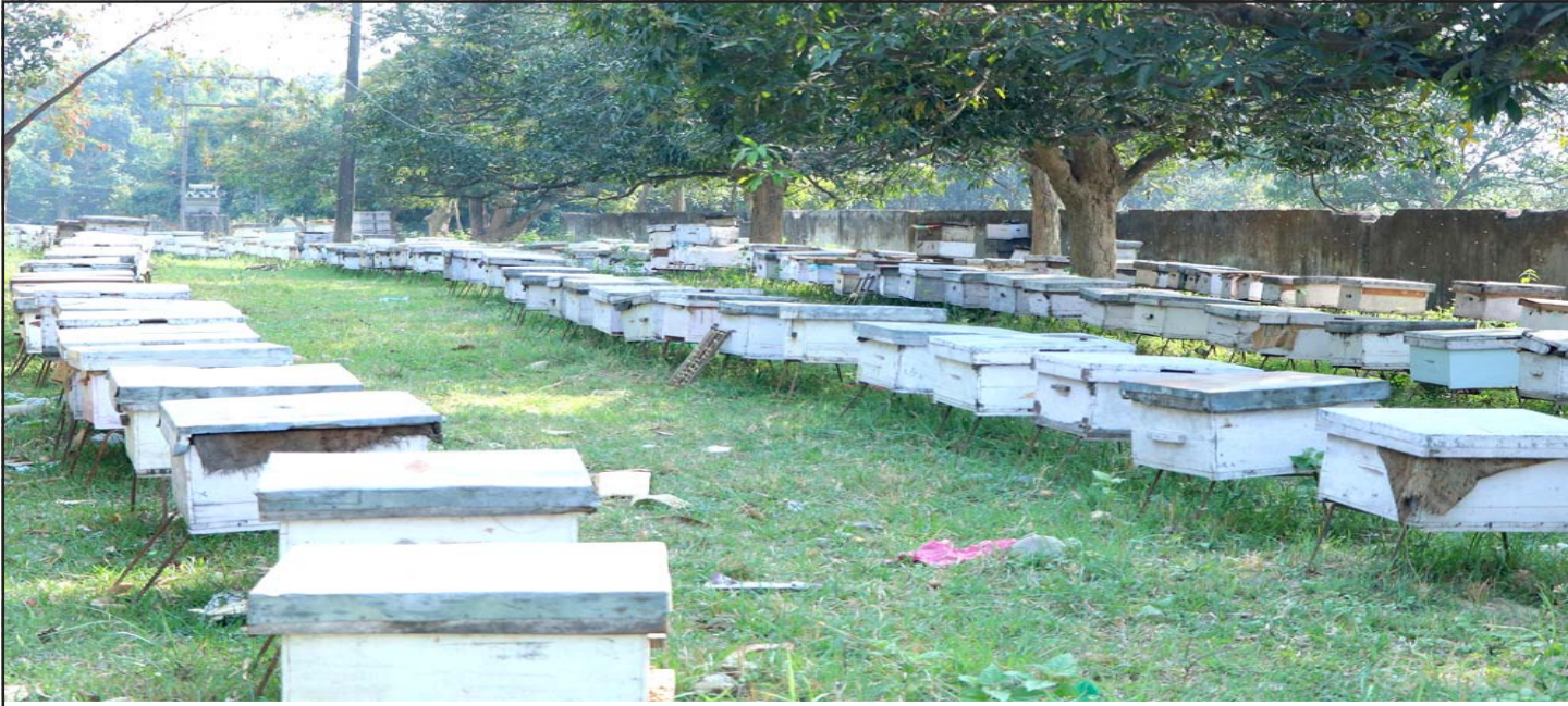
सर्लाहीको लालबन्दी नगरपालिका-५ स्थित दुग्ध विकास संस्थानको शाखा कार्यालय हाताभित्र स्थानीय किसानले चरनको लागि राखेको मौरीका धारहरू।