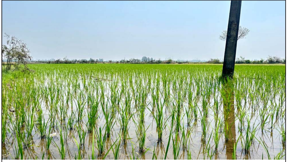
सर्लाहीको हरिपुर नगरपालिकाको जगतपुरस्थित स्थानीय किसानले गरेको चैते धानखेती। पर्याप्त सिंचाइ सुविधाको अभावमा जिल्लामा चैते धानखेती गर्ने किसानको सङ्ख्या न्यून रहेको छ।

यसैबीच, इजरायलले गाजामा जारी राखेको सैनिक कारबाहीका क्रममा मङ्गलबार राति कम्तीमा ६० जना प्यालेस्टिनीको मृत्यु भएको गाजास्थित स्वास्थ्य मन्त्रालयले जनाएको छ। रासस