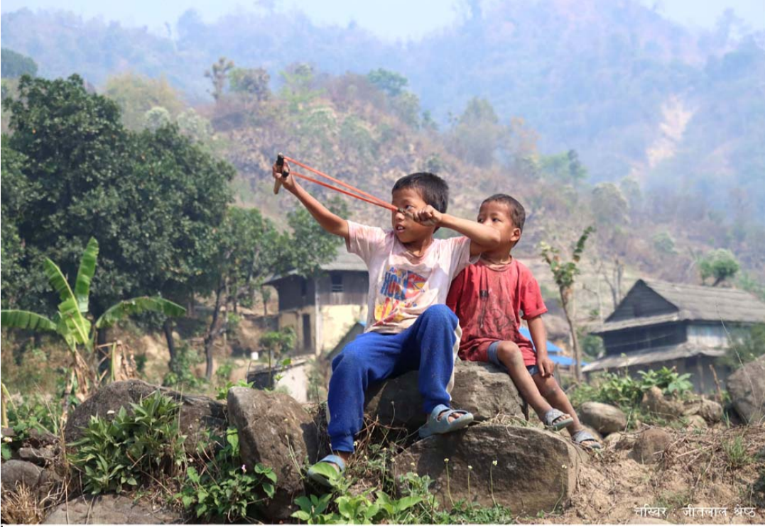
नताक गुलेली चरालाई पाप लाग्ला है: विद्यालय बिदा भएपछि चराचुरुङ्गीलाई निसाना लगाउन गुलेली तान्दै बालक । सुख्खायाममा पानीको खोजीमा चराचुरुङ्गीहरू गाउँबस्ती भौतारिने गर्छन् ।