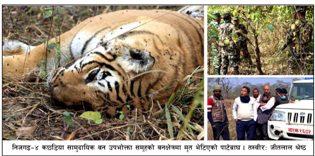
निजगढ-४ कछडिया सामुदायिक वन उपभोक्ता समूहको वनक्षेत्रमा मृत भेटिएको पाटेबाघ।

मृत अवस्थामा फेला परेको सो पाटेबाघ लगभग दुई साता अघि