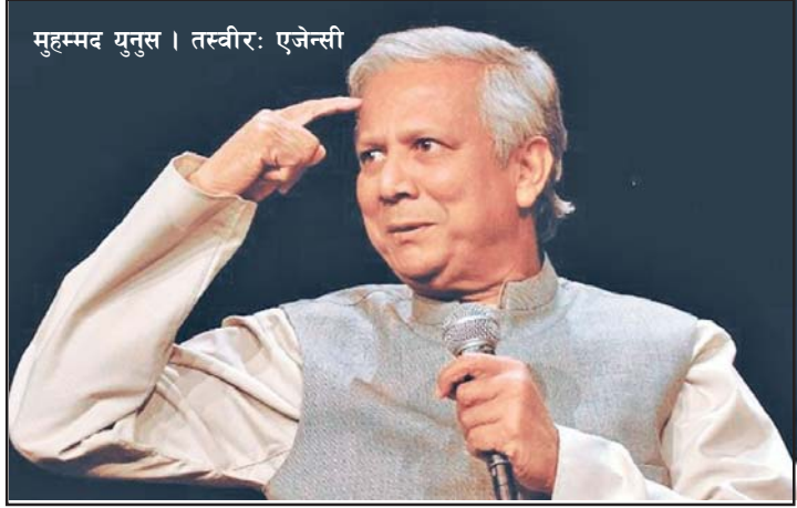
मुहम्मद युनुस।

यद्यपि स्वीट्जरल्यान्ड वा अमेरिकाका स्वनिर्वासनमा काम जारी राख्ने प्रस्तावलाई अस्वीकार गर्दै युनुस बङ्गलादेशमै बस्न कटिबद्ध छन्। “मलाई यही रहनुपर्छ र यहीबाट सबै शुरू भएको छ,” उनले भने, “यो म मात्र होइन, यसप्रति समर्पित मुलुकभर मेरो पूरा समूह छ, उनीहरूले सम्पूर्ण जीवन यसैमा बिताएका छन्, यदि म स्थानान्तरण भएँ भने सम्पूर्ण कुरा बिग्रिनेछ, यसले सम्पूर्ण कुरा नष्ट हुनेछ।” रासस