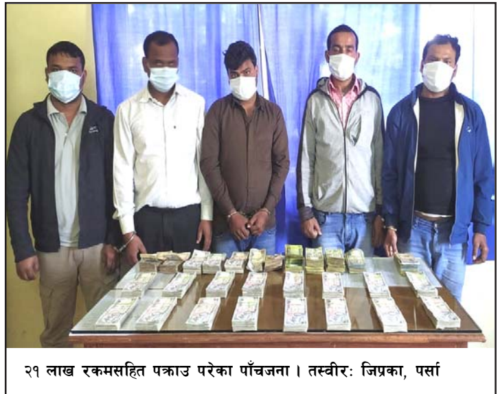
२१ लाख रकमसहित पक्राउ परेका पाँचजना।

स्थित अस्पताल रोडबाट भारतीय मोटरसाइकलमा सवार भारत, बिहारको