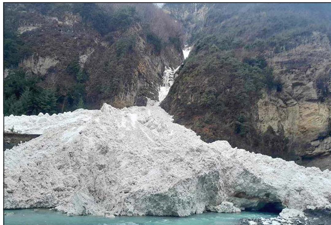
हिमपहिरो: हिमाली जिल्ला मनाङको मनाङ डिस्पाड गाउँपालिका-१ तलेखुस्थित सोमवार गएको हिमपहिरो।

चिकित्सकको सल्लाह: ग्याँस र पेट दुखाइको समस्या भएपछि चिकित्सकसँग सल्लाह लिनुस्। लामो समयसम्म ग्याँस र पेट दुखाइ कम गर्ने औषधिको सेवन नगर्नुस्। स्वस्थ दिनचर्या अपनाउनुस्, ताजा र पौष्टिक भोजन खानुस्। नियमितरूपमा व्यायाम गर्नुस्। - प्रतीक डेस्क (एजेन्सीको सहयोगमा)