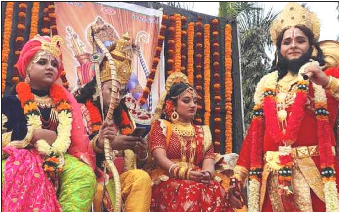
वीरगंजमा राम, सीता, लक्ष्मण र हनुमानसहितको रामकथा झल्किने गरी निकालिएको झाँकी।