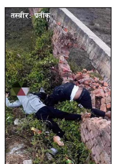
उक्त मोटरसाइकल अनियन्त्रित भएर दुर्घटनामा परेको प्रनाउ थापाले बताए । दुवैजनाको शव शल्यपरीक्षणको लागि नारायणी अस्पतालमा लगेको छ ।

दुवैजना वीरगंजको नेशनल मेडिकल कलेज तथा शिक्षण अस्पतालमा एमबिबिएस अध्यनरत विद्यार्थी रहेको उनले बताए । भिस्वाबाट भेडियाही जाने बाटोमा