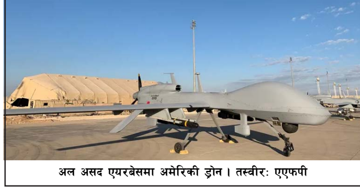
अल असद एयरबेसमा अमेरिकी ड्रोन।

इराकमा करीब अढाइ हजार र सिरियामा करीब ९०० अमेरिकी सैनिक छन्। रासस