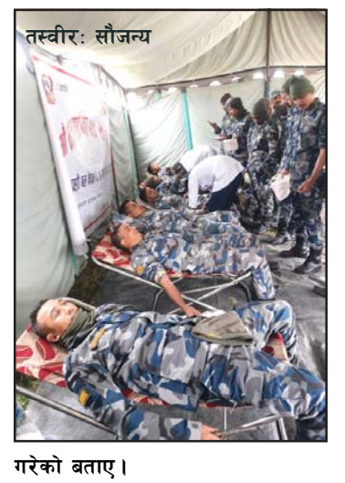
गरेको बताए ।