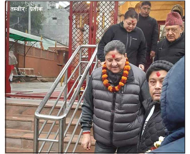
बिहान गहवामाई मन्दिरमा आएर पूजाअर्चना गरेका छन् ।

लगाएर फर्कने क्रममा उनको पहिचान खुलेपछि सर्वसाधारणले स्वागत गरेका थिए ।