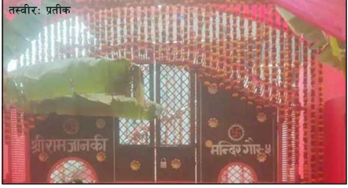
प्रस, रौतहट, ७ माघ/ रौतहटका विभिन्न मन्दिरहरूमा पूजापाठ तथा सरसफाइ आइतवारदेखि शुरू भएको छ ।

सरसफाइका साथै आजदेखि पूजापाठ शुरू भएको छ ।