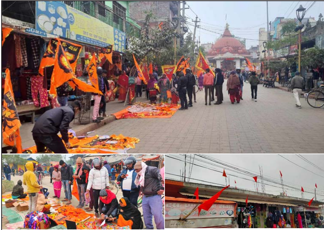
वीरगंज महानगरको गहवामाई मन्दिर र पोखरिया नगरपालिकामा रामनामी झन्डा, तस्वीर बिक्री गर्दै र घर, पसलहरूमा झुन्ड्याइएका झन्डा ।

यसैबीच, वीरगंज महानगरपालिकाले वीरगंज-१० घडीअर्वास्थित रामजानकी मन्दिरमा राम भगवानको प्रतिमाको प्राणप्रतिष्ठान सोही दिन गर्दैछ । यसलाई