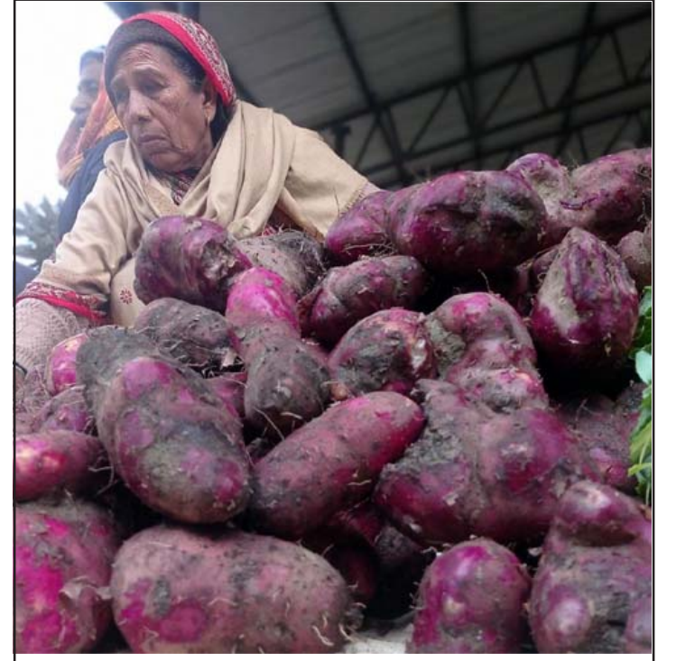
तरुलको व्यापार: माघे सङ्क्रान्ति नजीकै गर्दा सुनसरीको इनरुवास्थित बिहीवारे हटियामा बिक्री गर्न राखिएको तरुल। तरुल स्थानीय बजारमा प्रतिकिलो रु ४०-५० मा बिक्री भइरहेको व्यापारी बताउँछन्।

लगानीको विविधीकरण नभएको, जोखिम व्यवस्था नगरिएको, अनुत्पादक क्षेत्रको लगानी र पर्याप्त तरलतासमेत नराखिएका कारण पनि सहकारी क्षेत्रमा समस्या आएको देखिन्छ। हुनत सबै सहकारी संस्था समस्याग्रस्त छैनन्, कानूनको पालना गर्दै स्वनियमनमा चलेका सहकारी संस्थाहरूले राम्रा-राम्रा काम गरिरहेका पनि छन्। उद्यम गर्न चाहनेहरूलाई कर्जा पनि प्रवाह गरिरहेका छन्, सदस्यहरूको भविष्य सुरक्षाका लागि बचत गर्दै लाभसमेत लिइरहेका छन्। तर सहकारीको रकम अपचलन गरिरहेका सञ्चालकहरूलाई कानूनी कारबाहीको दायरामा ल्याउन नसक्दा चुनौती थपिएको छ। सहकारी क्षेत्रमा आर्थिक (वित्तीय) व्यवस्थापनको विषय मात्र होइन, यतिखेर समग्र सामाजिक उत्तरदायित्व, आफ्ना मूल्य मान्यता र सिद्धान्तसमेत जोगाउनु सहकारीका लागि चुनौतीको पहाड बनेर उभिएको छ। यस्तो विषम परिस्थितिबाट समग्र सहकारी क्षेत्रको संरक्षण, उत्थान, विकास र संवर्द्धन गर्दै सिङ्गे मुलुकको आर्थिक रूपान्तरणका लागि सम्पूर्ण सहकारी अभियानकर्ता, नेतृत्वकर्ता, विभिन्न विषयगत सङ्घसंस्थालगायत राज्य नै एकजुट भएर लाग्नुपर्ने अहिलेको आवश्यकता छ।