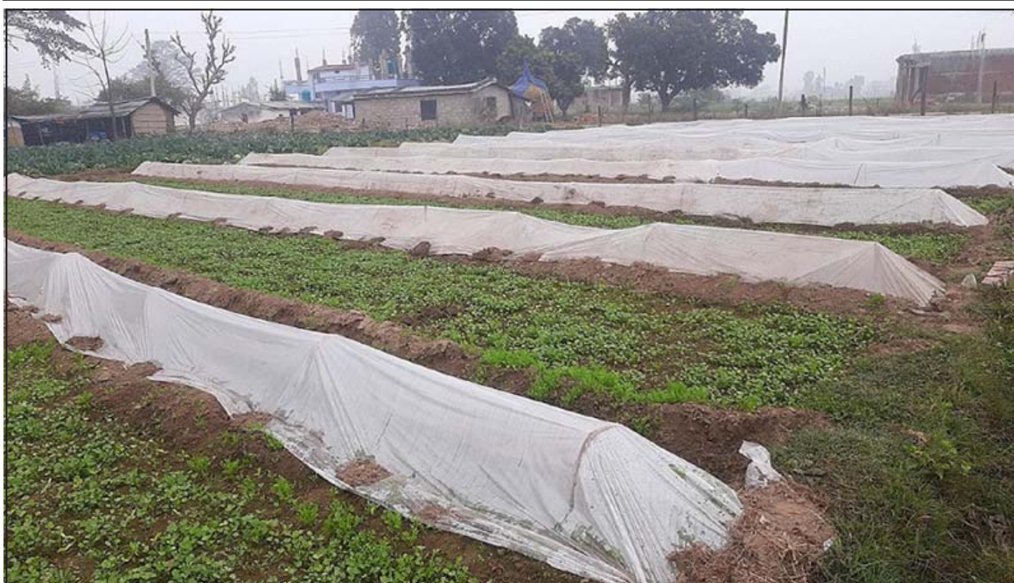
व्यावसायिक तरकारी खेती: धनगढी उपमहानगरपालिका- २ दीपटोल नजीकै एक स्थानीय किसानले गरेको व्यावसायिक तरकारी खेती। केही दिनदेखि यहाँ जाडो बढेसँगै बाक्लो हुस्सु लाग्ने गरेकोले तरकारी बचाउन टनेलको प्रयोग गरिएको ती किसानले बताएका छन्।