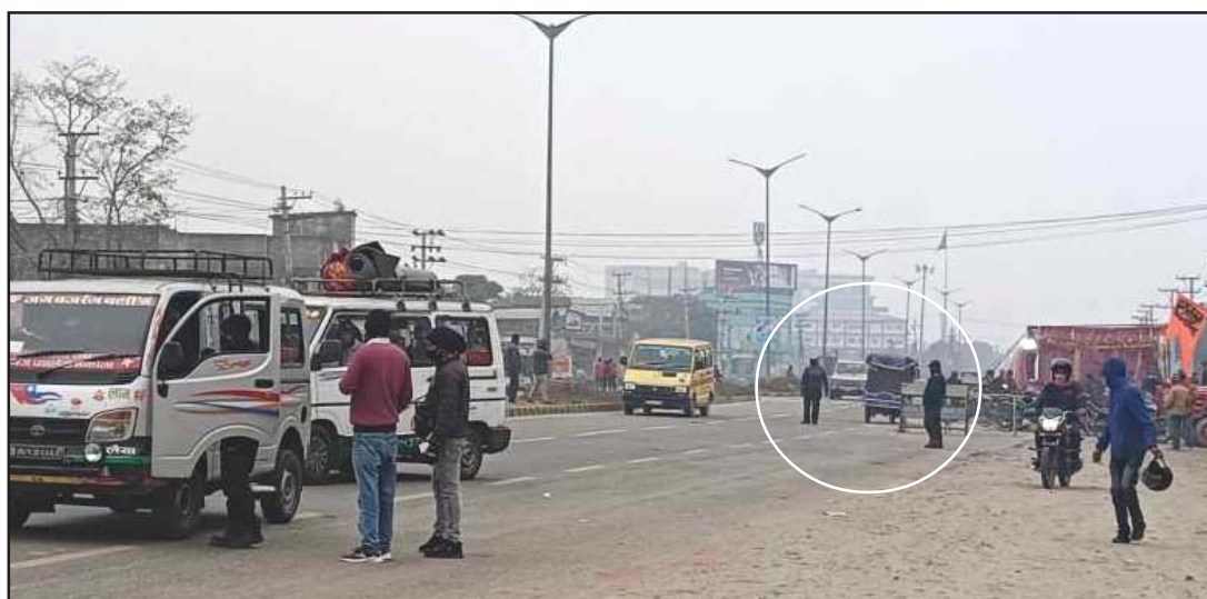
हाइवेमा जाँदै गरेको ईरिक्शालाई रोकेर सोधपुछ गर्दै ट्राफिक प्रहरी।

प्रस, परवानीपुर, २६ पुस/ वीरगंजलगायत पर्सा जिल्लाको ट्राफिक व्यवस्थापनमा ईरिक्शाले समस्या निम्त्याइरहेको छ।