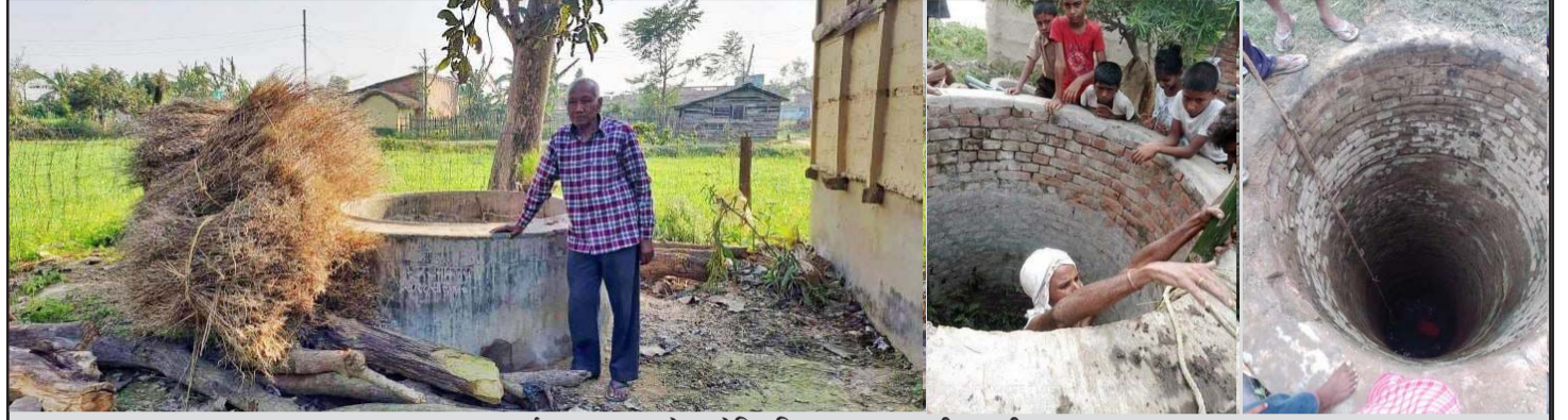
पर्स र बारामा रहेका ऐतिहासिक इनार।