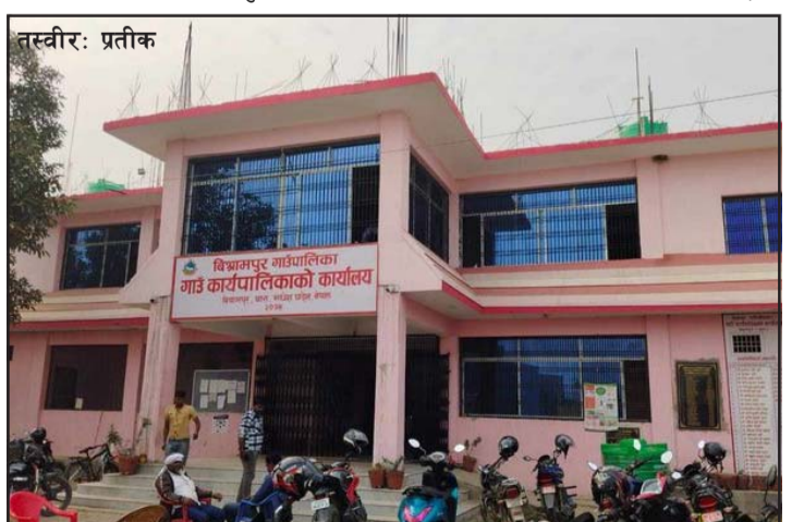
भएको थियो । यस विषयमा गापा कर्मचारीले माग अत्यधिक र बीउ सीमित भएकोले विवाद सिर्जना भएको बताए । गापाको कार्यपालिकाले बढीमा २० किलो र एउटा वडा १२० जनाभन्दा बढीलाई बीउ वितरण गर्न नमिल्ने मापदण्ड

आसेपासेलाई बढी ग्राह्यता दिन खोज्दा बीउ वितरणमा विवाद हुँदा भैँभगडा बनाएकोमा वडा नं ३ मा तीन सयभन्दा बढीको लाइन लागेपछि विवाद भएको थियो । यस विषयमा गापा कर्मचारीले माग अत्यधिक र बीउ सीमित भएकोले विवाद सिर्जना भएको बताए । गापाको कार्यपालिकाले बढीमा २० किलो र एउटा वडा १२० जनाभन्दा बढीलाई बीउ वितरण गर्न नमिल्ने मापदण्ड