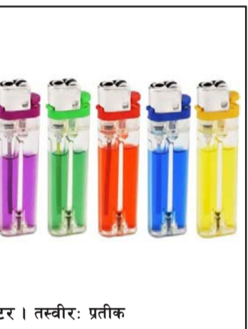
भारतको पटनामा बरामद भएको अरुण ट्रेडर्सको प्रिमियम लाइटर ।