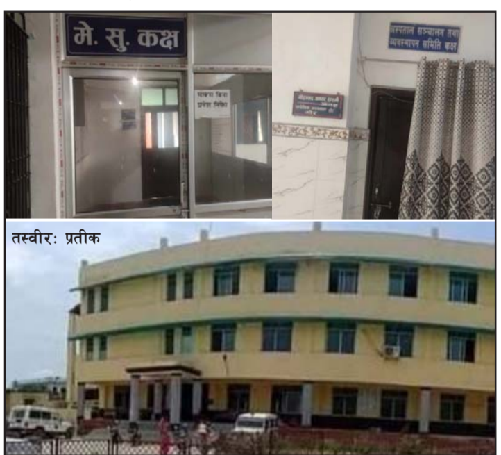
अस्पताल, गौर प्रमुखविहीन हुँदा सेवाग्राही मर्कामा परेका छन् ।