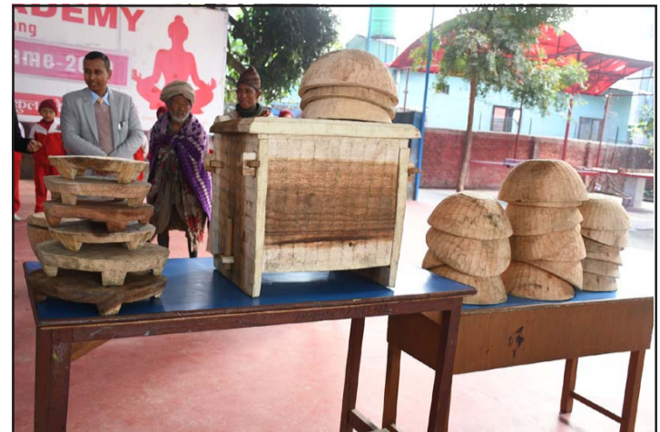
राउटे समुदायले बनाएको काठका सामग्री: वैलेखमा बसोबास गर्ने राउटे समुदायले परम्परागत हाते औजारबाट काठबाट बनाएका कोशी, मधुस, पिकाँलगायतका हस्तकलाका सामग्री।

दिन आधुनिक दासता र मानव बेचबिखन, नवीकरणीय ऊर्जा, नवप्रवर्तन र उद्यमशीलता, व्यावसायिक आचरण र सामाजिक उत्तदायित्व, डिजिटल अर्थतन्त्र शीर्षकमा छलफल हुनेछ। यसै, दोस्रो दिन विपद् जोखिम न्यूनीकरण र व्यावसायिक योजना, व्यवसाय र मानव अधिकार, व्यवसायजन्य सुरक्षा र स्वास्थ्य तथा व्यवसायमैत्री वातावरण विषयमा सामूहिक छलफल हुनेछ।