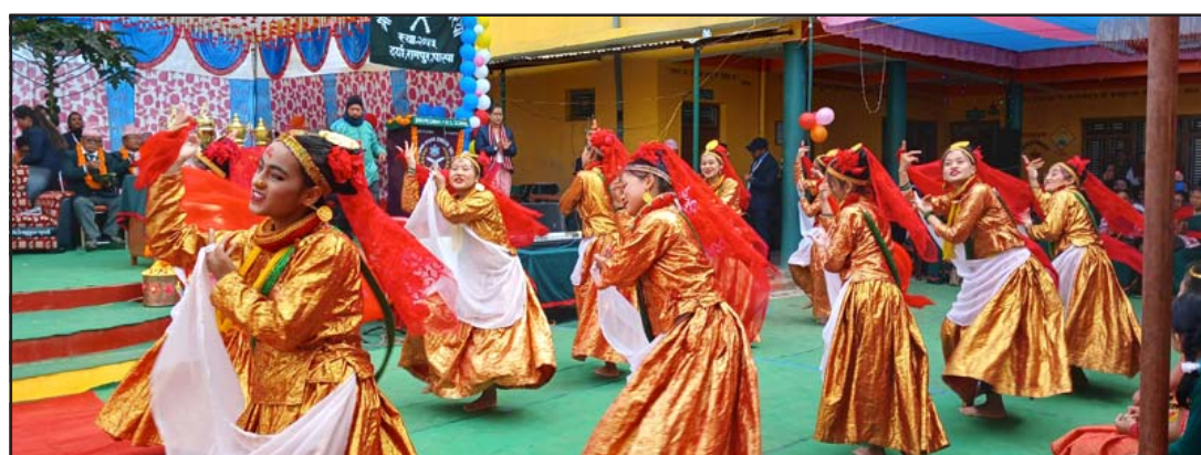
मारुनी नाच: भूपू सैनिक राइजिड सेकेन्डरी स्कूल रामपुर पाल्पाको बुधवार आयोजित रजतजयन्ती समारोहमा विद्यार्थीहरूद्वारा देखाइएको मारुनी नाच।