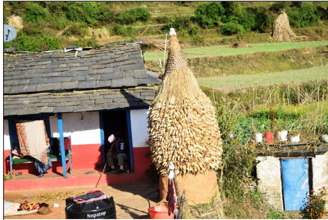
सुलीमा मकै: म्याग्दीको बेनी नगरपालिका-५ गाजनेस्थित एक घरमा परम्परागत शैलीमा राखिएको मकैको सुली। सुलीमा मकै राख्दा घामपानी तथा कीराबाट सुरक्षित राख्न सकिन्छ।

केही वर्षयता विदेश जाने युवाहरूको लर्काँ नै लाग्ने गरेका बेला उनले स्वदेशमै बसेर कम लगानीबाट राम्रो आम्वानी गर्न सकिन्छ भने उदाहरणसमेत प्रस्तुत गरेका छन्। बढी पैसा कमाउने लोभमा विदेश पलायन हुने युवाले उनीबाट पाठ सिकेर स्वदेशमै कमाउने बाटो खोज्नु जरुरी रहेको स्थानीयहरू बताउँछन्।