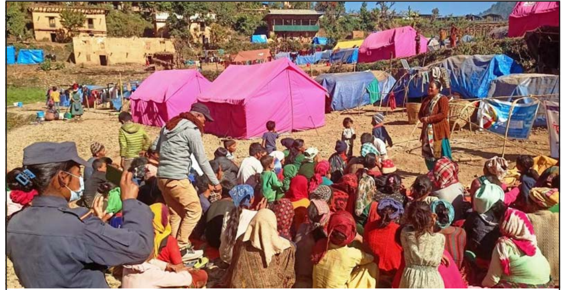
भूकम्प प्रभावितहरूलाई सचेतना कार्यक्रम: विभिन्न खालका हिसाबाट बच्नका लागि जाजरकोटको नलगाड नगरपालिकाको आयोजनामा नलगाड-१ स्थित कल्पतमा त्रिपालमा बसोबास गरेका भूकम्प प्रभावितहरूलाई भेला गरी सचेतनाको कार्यक्रम गरिँदै।

ट्रेनका अनुसार बस अग्लो स्थानबाट खस्ता ठूलो मात्रामा क्षति भएको हो। "प्रत्यक्षदर्शीहरूका अनुसार यान्त्रिक गडबडीका कारण बस दुर्घटना भएको हो, सम्भवतः ब्रेक फेल भएर चालकले नियन्त्रण गुमाएको हुन सक्छ," उनले भने। रासस