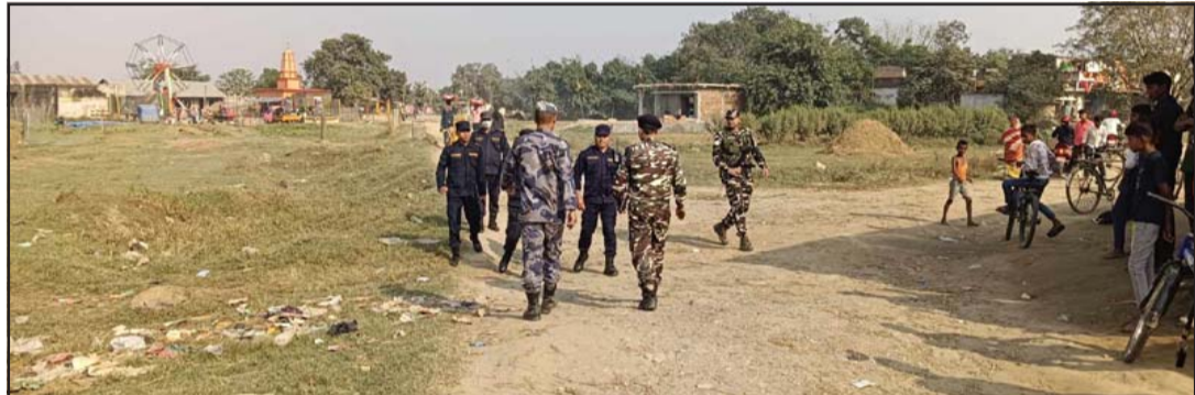
सीमावर्ती क्षेत्रको मेलामा झडप भएपछि संयुक्त गस्ती गर्दै जनपद, सशस्त्र र भारतीय एसएसबीका जवान।

गराउँदा ठूलो सङ्ख्यामा रहेका स्थानीयले विरोध गरेको बताए। घटनाको बेला