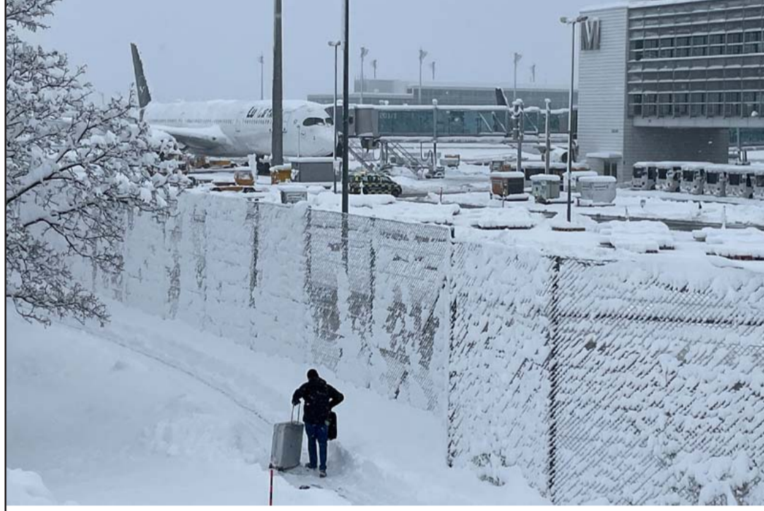
म्युनिख विमानस्थलमा भएको भीषण हिमपातले धेरै उडान प्रभावित भए।

छन्। सिएनएनले विमानस्थलका प्रवक्तालाई उद्धृत गर्दै जनाए अनुसार हिमपातका कारण म्युनिखमा बस, ट्राम र केही रेल सेवाहरूसमेत बन्द गरिएका छन्।