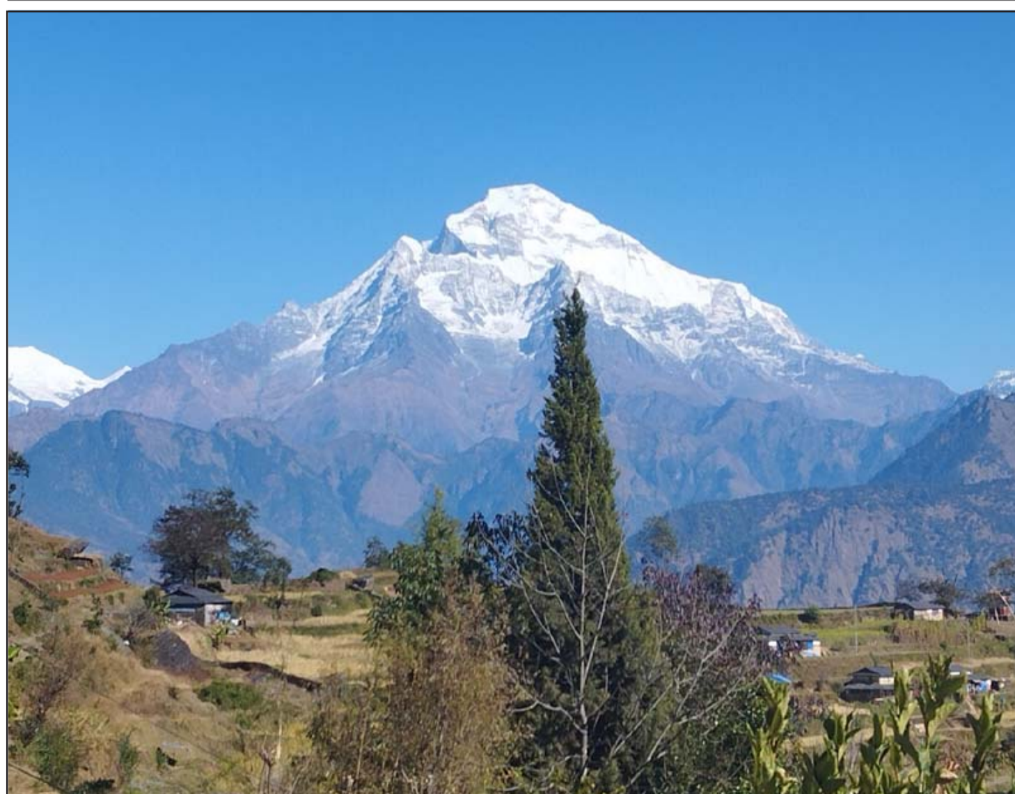
निस्कोटबाट देखिएको धौलागिरि: म्याग्दीको मालिका गाउँपालिका-१ निस्कोट गाउँबाट देखिएको धौलागिरि हिमाल।