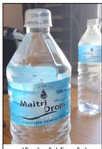
भुसुना भेटिएको पानीको सिलबन्दी बोतल