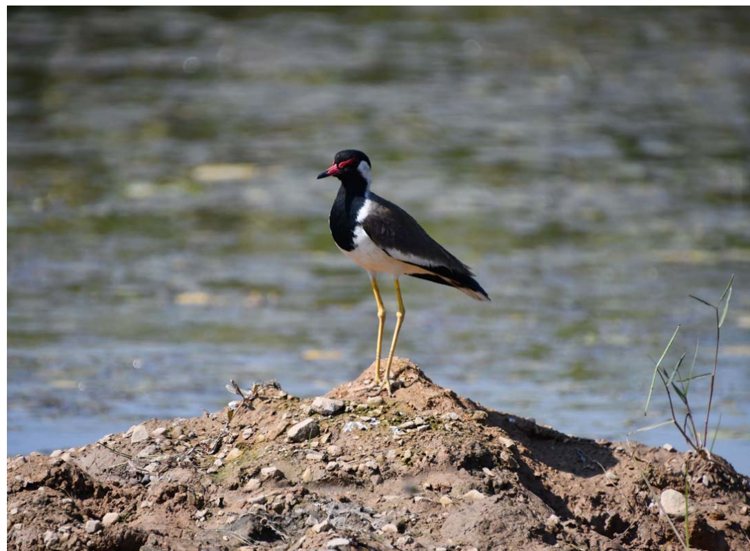
आहारा कुरेर बसेका हुटिटघाउ चरा: घोरही उपमहानगरपालिका-४ डाँडागाउँस्थित कटकैया तलाउमा आहारा कुरेर बसेका हुटिटघाउ चरा।

यसअघि पनि बेलाबखत पत्नीलाई कुट्ने र झैझगडा हुने गरेको जानकारी पाइएको र हिजो साँझ खाना खाएपछि राति कुन समयमा सो घटना भयो भन्नेबारे यकीन नभएको उनले बताइन्। कार्यालयबाट खटिएको प्रहरी टोलीले घटनास्थलको मुचुल्का गरेपछि दुवै शवलाई शल्यपरीक्षणका लागि चापाकोट अस्पताल ल्याउने तयारी भइरहेको र घटनाबारे थप अनुसन्धान शुरू भएको प्रति यादवले बताए।