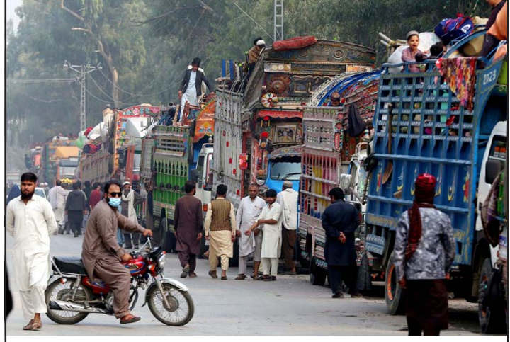
पाकिस्तानमा रहेका अप्रवासी अफगानीहरू अफगानिस्तानतर्फ लाग्दै ।

उत्तरी तोर्खम सीमाबाट ८० प्रतिशतभन्दा बढी मानिस खैबर पख्तुनख्वा प्रान्तमा गएका छन् । उक्त प्रान्तमा अधिकांश अफगान आप्रवासी बसोबास गर्छन् । स्वेच्छाले गएकाले अहिलेसम्म उनीहरूलाई पक्राउ नगरिएको सो प्रान्तका प्रहरीले बताएको छ । तर कराँची र इस्लामाबादमा अफगान शरणार्थीहरूले पक्राउ, उत्पीडन र जबरजस्ती गरेको बताएका छन् । रासस