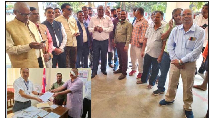
प्रजिअलाई जापनपत्र बुझाउँदै वडाध्यक्षहरूको टोली।