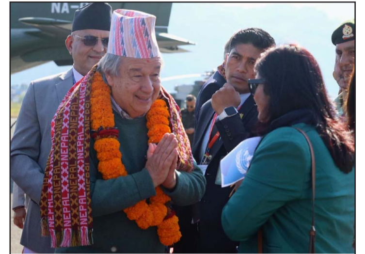
महासचिव गुटेरेसलाई पोखरा विमानस्थलमा सोमवार स्वागत गरिँदै।

बनाइएको बताए। उनले समग्र रूपदेखि जिल्ला र भ्रमण हुने क्षेत्रमा सुरक्षा व्यवस्था कडा पारिएको पनि बताए। महासचिवको भ्रमणको सुरक्षा