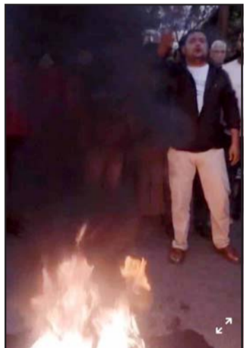
कलैयामा प्रदर्शन गर्दै स्थानीय।

गम्भीर घाइते भएका बोर्डिङ स्कूलका सञ्चालकको उपचारको क्रममा मृत्यु भएको जिल्ला प्रहरी कार्यालय, बाराले