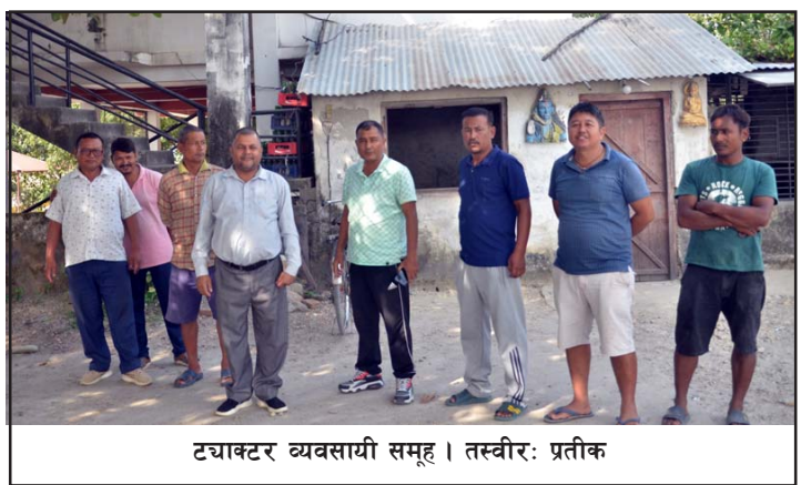
ट्याक्टर व्यवसायी समूह ।

गत वर्ष खोला ठेक्का नलागेको कारण दशै नजीकैको तिहार, छठ पर्वमा स्थानीय ट्याक्टर व्यवसायी,