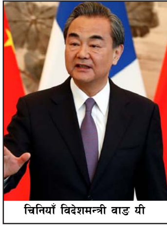
चिनियाँ विदेशमन्त्री वाङ यी

दुवै मुलुक एशिया-प्रशान्त क्षेत्र र त्योभन्दा बाहिरको प्रभावका लागि प्रतिस्पर्धा गरिरहेका र बेइजिङले अमेरिकी प्रभुत्वलाई कम गर्न रूससँग सहयोग बढाइरहेकाले विश्वका दुई शीर्ष