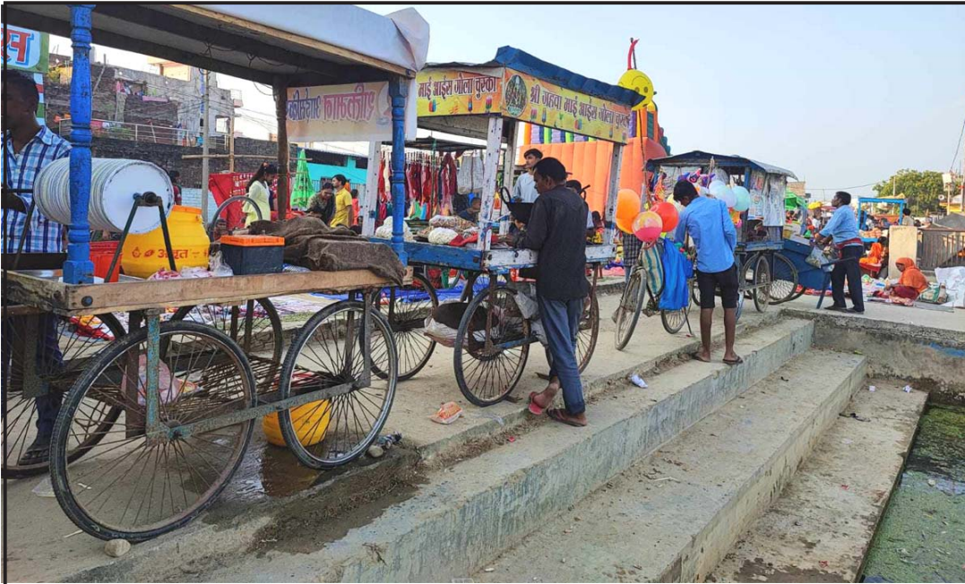
वीरगंज महानगरको मुर्ली पोखरानजीकै लागेको मेलामा ठेलामा बेचन राखिएका बरफ, बदाम, मकै, चटपटे ।