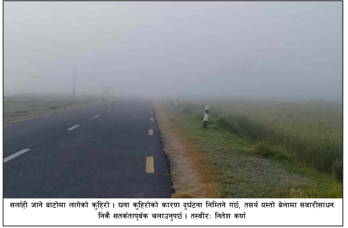
सलाई जाने बाटोमा लागेको कुहियो। घना कुहियोको कारण दुर्घटना निम्तिने गर्छ, तसर्थ यस्तो बेलामा सवारीसाधन निकै सतर्कतापूर्वक चलाउनुपर्छ।

यस्तो अनुसन्धान भविष्यमा अन्तरिक्ष अन्वेषण र औपनिवेशिक अभियानका लागि महत्त्वपूर्ण हुन सक्छ। रासस