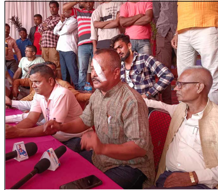
पत्रकार सम्मेलनमा वडाध्यक्ष महर्जनलगायत ।

मनपाका आठवटा वडाका अध्यक्ष एवं कार्यपालिका सदस्यहरूले बुधवार