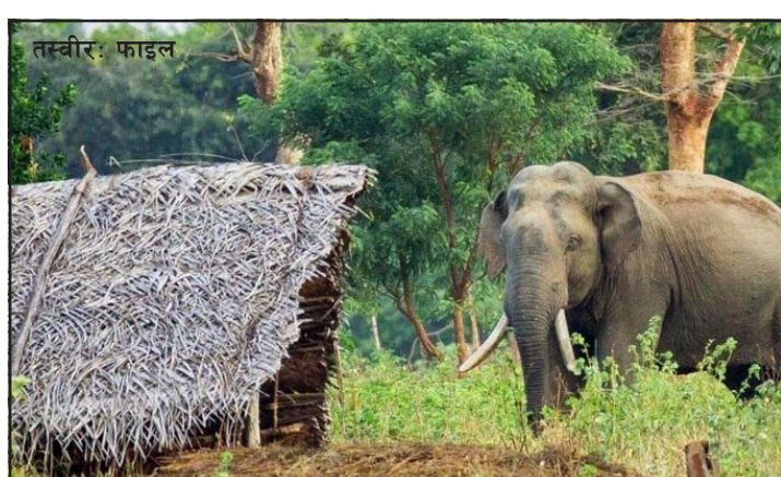
बजे निकुञ्जबाट आएको हात्तिले गाउँमा क्षति गरिरहेको गाउँलेले थाहा पाएपछि