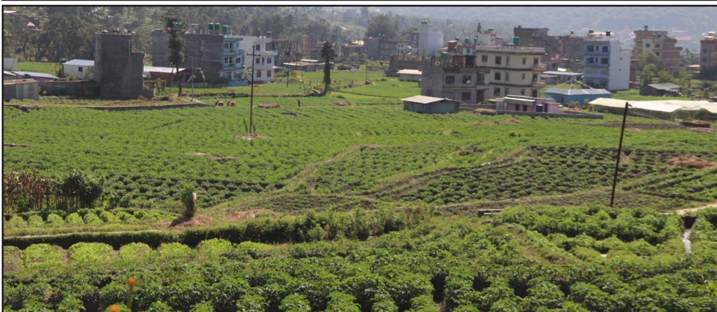
आलुखेती : काठमाडौँ शङ्खरापुर नगरपालिकाको साँखुमा खेतमा किसानले व्यावसायिकरूपमा लगाएका आलुखेती।

नदी किनारमा घुम्न आउने अधिकांश आन्तरिक पर्यटक यहाँ जलविहार गर्न रुचाउँछन्। यो यात्रामा यात्रीले नारायणी किनारको दृश्यसँगै नगरवन, गैँडाकोट, रिभरविन टापु, मौलाकालिका मन्दिर, हिमशङ्खला लगायतको दृश्यावलोकन गर्न पाउँछन्।