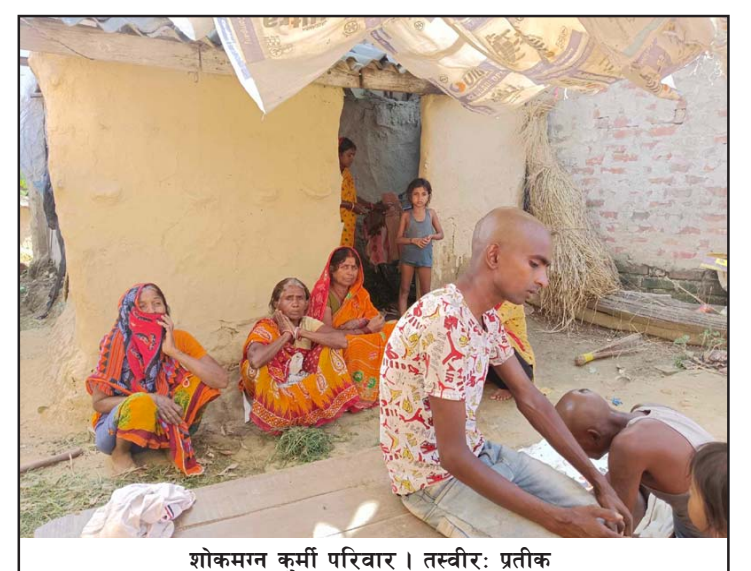
शोकमग्न कुर्मी परिवार ।

सर्प निस्केको थाहा पाएपछि कलवार परिवारले उनलाई बताएपछि सर्प समान्त खोज्दा उनको बायाँ हातमा सर्प बेरिएर बसेको थियो । सार्वजनिक बिदाका कारण राति उनलाई अस्पताल ल्याउन ढिला भएको र अस्पतालमा उपचारको क्रममा उनको मृत्यु भएको