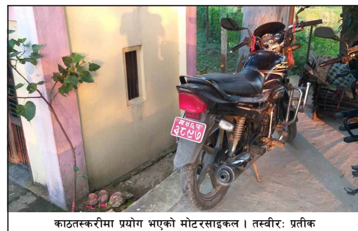
काठतस्करीमा प्रयोग भएको मोटरसाइकल ।

तस्करी भएको छ । चोरी भएको ना.३७प १८४ नम्बरको