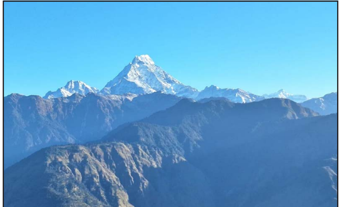
सिस्ने हिमाल: रूकुम पश्चिमको मुसीकोट नगरपालिका-१ जन्ती बस्ने लेकबाट देखिएको सिस्ने हिमाल।

उक्त टोलीको नेतृत्व ताङ होङ्गबोले गरिरहेका छन्। उनी अन्तरिक्ष स्टेसनमा आफ्नो पहिलो फिती अभियानमा रहेका छन्। उनीसँगै ताङ सेङ्जि र जियाङ्ग जिङ्गलिन पनि रहेका छन्। यो उनीहरूको पहिलो अन्तरिक्ष अभियान हो। सबै पुरुष चालक दलको औसत उमेर ३८ वर्ष रहेको छ। अन्तरिक्ष स्टेसनको अभियानमा यिनीहरू सबैभन्दा कान्छा हुन्। रासस