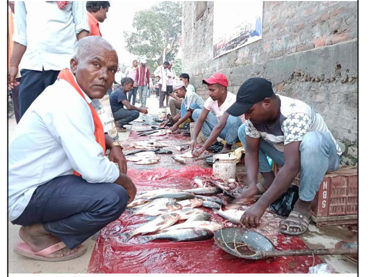
कालिकामाई गाउँपालिकाको बिरञ्चीबर्वामा लागेको भवानी मेला। यो मेला विजयादशमीदेखि पाँच दिनसम्म लाग्ने यस मेलामा माछामासुको निकै बिक्री हुने गर्छ।