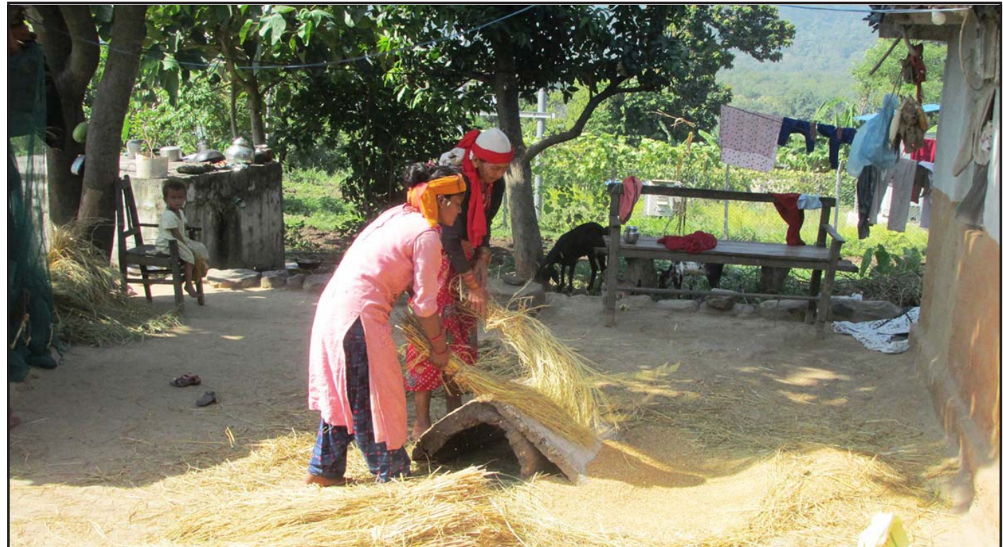
धान चुट्दै गरेका महिला: भीमदत्त नगरपालिका-९ खल्लाका महिला धान चुट्दै।

अहिले आइटी क्षेत्रमा धेरै कलेज आइरहेका छन् तर समय अनुसार पाठ्यक्रम अपग्रेड हुन सकेको छैन। फलस्वरूप आइटी उद्योग र कलेजबीच जोडिने इकोसिस्टम निर्माण हुन सकेको छैन। काठमाडौं महानगरपालिकाले अहिले त्यो पहलकदमी शुरू गरेको छ। यस्ता पहलकदमीलाई राज्यले नीतिकै तहमा लगेर कार्यान्वयन गराउन सक्नुपर्छ। सूचना प्रविधि क्षेत्रका विद्यमान जनशक्तिलाई अन्तर्राष्ट्रियस्तरको सीप हासिल गर्नका लागि मदत पुग्ने पहल राज्यस्तरबाट हुनुपर्छ। यसका साथै काठमाडौं उपत्यकाबाहिरका केही शहरलाई आइटी हबका रूपमा विकास गर्दै लगनुपर्छ। उदाहरणका लागि वीरगंज, विराटनगर वा जनकपुरमध्ये कुनै एउटा शहरलाई आइटी हबको रूपमा विकास गर्नुपर्छ। यसका लागि ती शहरमा आइटीमैत्री पूर्वाधार, आवश्यक कलेज र जनशक्ति उत्पादन गर्न सक्ने संस्थाहरू तथा आइटी कम्पनी स्थापनाका लागि करमा केही छुट र प्रोत्साहनका प्याकेज ल्याएर काम गर्न सक्नुपर्छ। यसैगरी, सूचना प्रविधि उद्योग विकासका लागि राज्यले संस्थागत ज्ञान साझेदारी कार्यक्रम ल्याउनुपर्छ, यस अन्तर्गत सरकारको समन्वयमा भारतका केही शहरमा अध्ययनरत नेपाली विद्यार्थीलाई केही समयका लागि भएपनि त्यहाँस्थित सूचना प्रविधि क्षेत्रका ठूलो कम्पनीहरूमा इन्टर्नकै रूपमा काम गर्ने अवसरको खोजी गर्नुपर्छ। प्रदेश सरकारले पनि भारत सरकारसँग मिलेर यसलाई एउटा योजनाको रूपमा अगाडि बढाउन सक्छ।