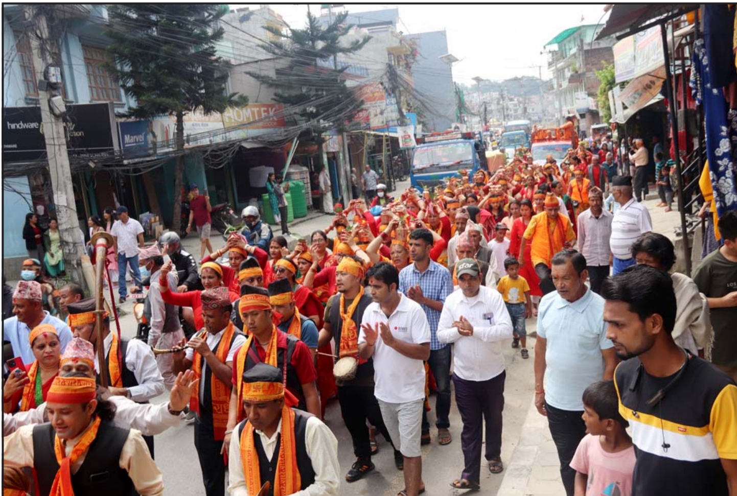
कलशयात्रा : कृष्ण जन्माष्टमीको अवसरमा तारकेश्वर नगरपालिका-८ स्थित लामबजारको श्री फचेश्वर महादेव मन्दिर संरक्षण तथा व्यवस्थापन समितिले लामबजारको राधाकृष्ण मन्दिरबाट निकालेको कलश तथा रथ यात्रामा सहभागी भक्तजनहरू।

र निश्चुल्क मन्त्र दीक्षा कार्यक्रम हुने बताइएको छ। कार्यक्रममा भाग लिन नेपाल, भारतका बिहार, पश्चिम बङ्गाल, सिक्किमलगायतबाट भक्तजनहरू आएका बताइएको छ। भदौ २३ गते सम्पन्न कार्यक्रममा आजदेखि शुद्ध घ्युको लड्डु प्रसाद वितरण भइरहेको र करीब डेढ लाखभन्दा बढी भक्तजन सहभागी हुने लक्ष्य लिएको बताइएको छ। तीन दिने कार्यक्रममा कबीर साहेब तथा सन्त रामपालजी महाराजको जीवनको विशेष क्षणहरूलाई तस्वीरमार्फत चित्रण गरिने र विद्वानहरूबाट शास्त्र अनुकूल भक्ति विधिको प्रमाण सम्झाइनेछ।