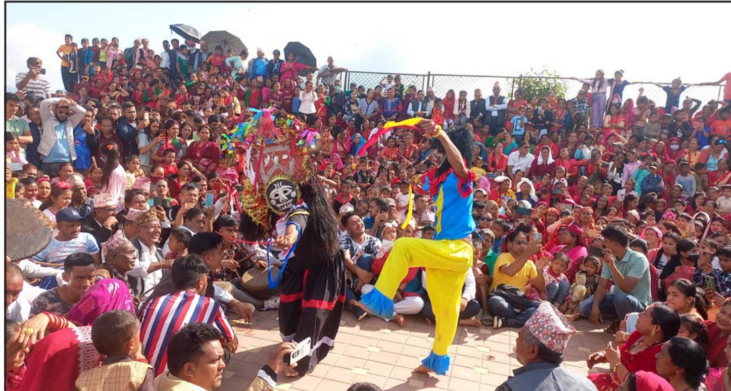
लासे नाँच : ऐतिहासिक तथा धार्मिक पर्यटकीयस्थल अर्घा भगवती मन्दिरमा बुधवार श्रीकृष्ण जन्माष्टमीको अवसरमा लासे नाच प्रस्तुत गरिँदै।

काठमाडौंको कागेश्वरी मनोहरामा खेलाडी आवासगृह र ललितपुरको (बाँकी अन्तिम पातामा)