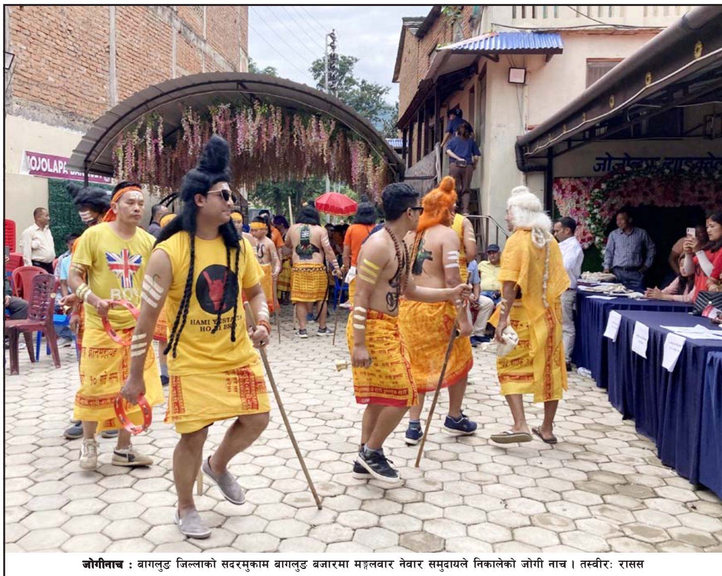
जोगीनाच : बागलुङ जिल्लाको सदरमुकाम बागलुङ बजारमा मङ्गलवार नेवार समुदायले निकालेको जोगी नाच।

तनाव कम गर्न यी उपायहरू अपनाउन सकिन्छ। यद्यपि यी उपायहरू गर्नुअघि विशेषज्ञहरूको मद्दत पनि लिन सक्नुहुन्छ। - प्रतीक डेस्क (एजेन्सीको सहयोगमा)