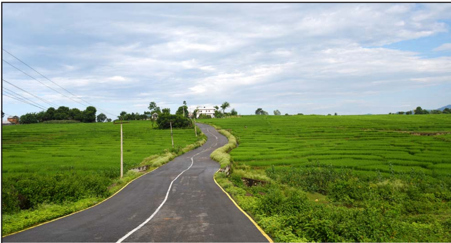
धानफाँट : घोराही उपमहानगरपालिका-१२ बटौलपुरबाट देखिएको साइपुरको धानफाँट र मदन भण्डारी लोकमार्गको घोराही-रक्षाचौर सडकखण्ड।