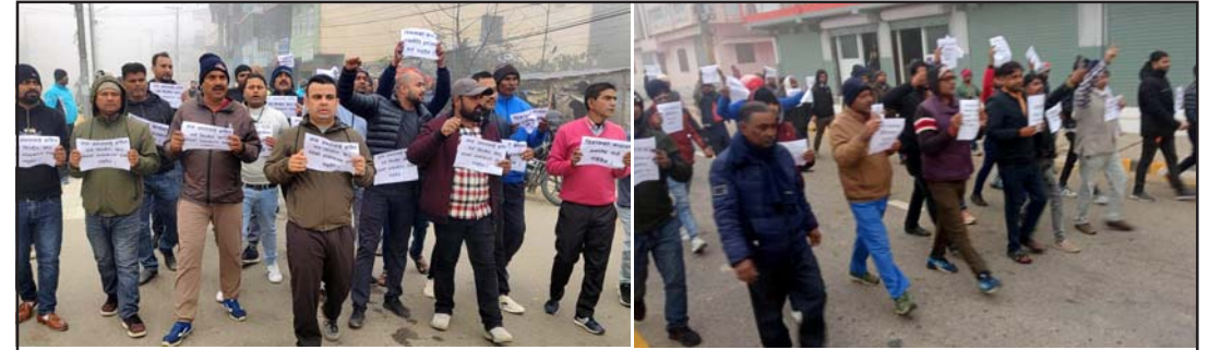
पक्ष र विपक्ष दुवैले छुट्टाछुट्टै गरेको प्रदर्शन।

नामकरण गर्नुभन्दा केही दिनअघि विरोध शुरू भएपछि नामकरण समारोह