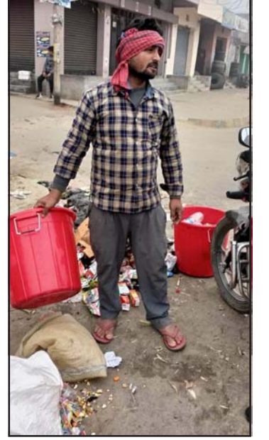
फोहर गर्ने ५१ जनालाई जरिवाना गरि सकेको छ।