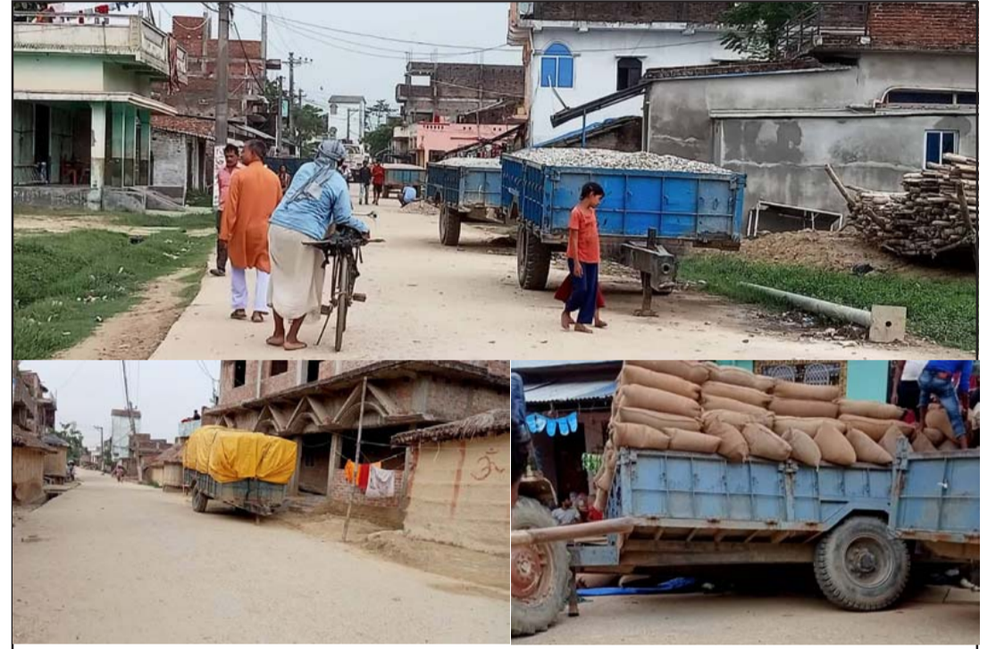
नेपालबाट भारततर्फ बालुवा र गिट्टी तथा भारतबाट नेपालतिर खाद्यान्न तस्करी हुँदै ।