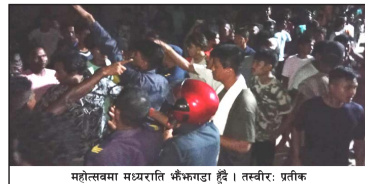
महोत्सवमा मध्यराति भैंसगडा हुँदै ।

प्रस, बिस्वागुठी, २१ असार/ पर्सागढी नगरपालिका-३ बडनिहारमा जारी प्रथम पर्सागढी महोत्सवमा दिनहुँ झैँझगडा हुने गरेको छ ।