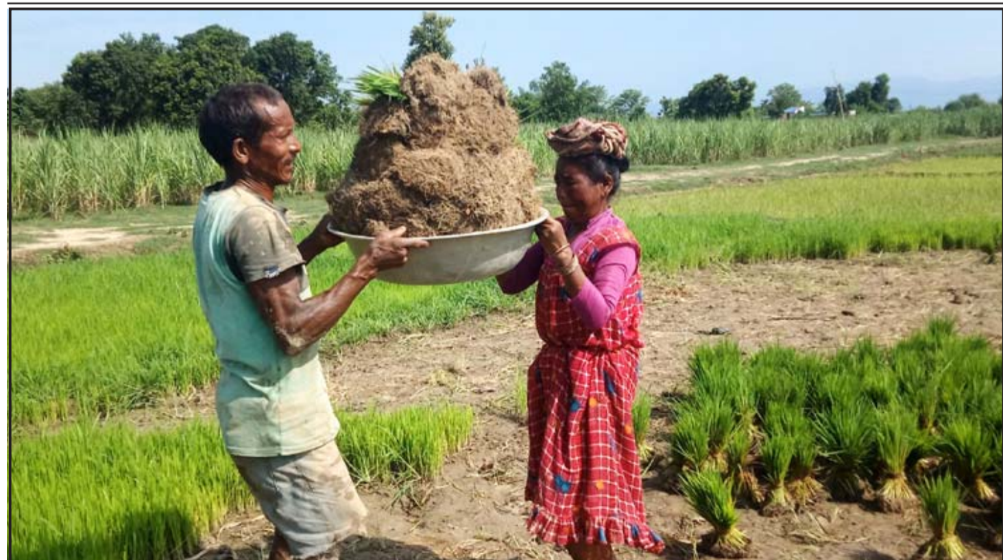
धान रोप्न बीउ लैजाँदै किसान : शुक्लाफाँटा नगरपालिका-२, रानीपुरका किसान बीउ उखेलेर रोपाइँ गर्न लैजाँदै। वर्षा नहुँदा किसान पम्पसेटबाट रोपाइँ गर्न बाध्य छन्।