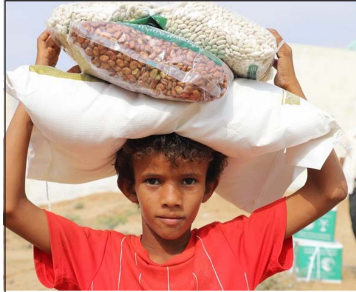
राहत सामग्री पाएपछि खुशी मुद्रामा एक सुडानी बालक ।

आवश्यक पोषण र खाद्यान्नको अभावमा बालबालिका कुपोषणको शिकार भइरहेका र कतिपय स्थानमा खाद्यान्न र औषधिजस्तो आधारभूत आवश्यकता पाउन नसकेको भन्दै यस अघि नै संयुक्त राष्ट्रसङ्घले दक्षिण सुडानका लागि सहायता आवश्यक परेको बताउँदै आएको थियो । रासस