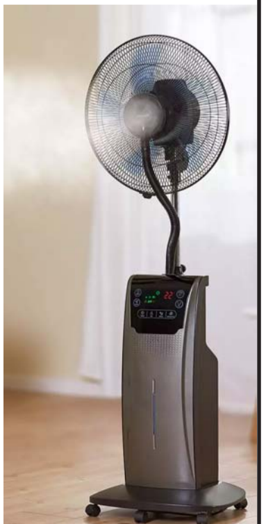
- प्रतीक डेस्क (एजेन्सीको सहयोगमा)

भारतमा यस पड्खाको मूल्य भार ४ हजारभन्दा बढी छ तर अमेजनमा यो पड्खा अहिले भार २६ सयमा बिक्री भइरहेको छ। यो पड्खासँगै पाइप, टैप कनेक्टर पनि पाइन्छ।