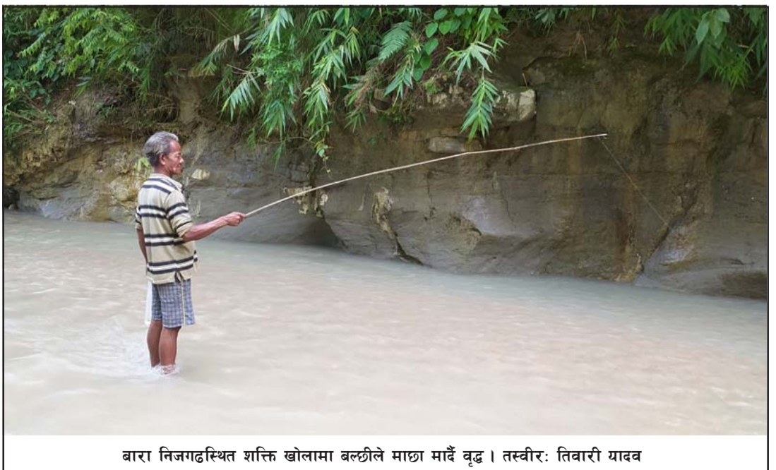
बारा निजगढस्थित शक्ति खोलामा बल्छीले माछा माउँदै वृद्ध।