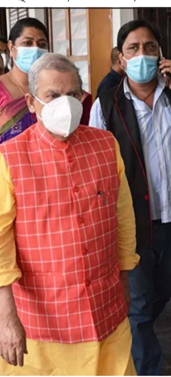
महन्थ ठाकुर।

अनुसार हाल प्रदेशसभामा जसपा पहिलो, काङ्ग्रेस दोस्रो, लोसपा तेस्रो, नेकपा