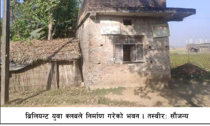
ब्रिलियन्ट युवा क्लबले निर्माण गरेको भवन।

सूचनाको आधारमा प्रहरीले कलैया उपमहानगर-९ रामपुरबाट २९ वर्षीय