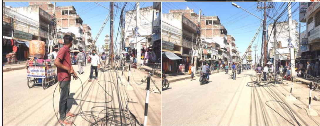
सडक अवरुद्ध गरि निजी नेटवर्कको कार्य गरिदै।

व्यवस्थापनको लागि जिल्ला प्रहरी कार्यालय, पसाले छलफल गरेको थियो। छलफलमा ट्राफिक व्यवस्थापनमा स्थानीय जनप्रतिनिधि र महानगरले चासो नदेखाएको भनी सहभागीहरूले दुःखेसो पनि पोखेका थिए।