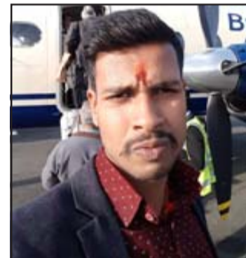
शुक्राएर आकस्मिक कक्षबाट आइसियुमा सिफ्ट हुने क्रममा नेशनल मेडिकल कलेज तथा शिक्षण अस्पतालबाट फरार भएका थिए।