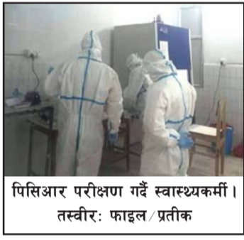
पिसिआर परीक्षण गर्दै स्वास्थ्यकर्मी।