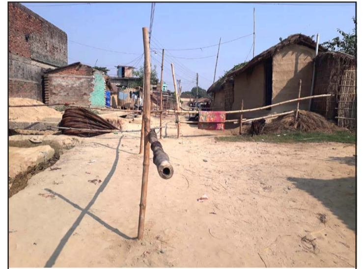
पोखरिया-१० शिवबर्वाको चरिहवाटोलमा लगाइएको छेकबार।

ठेकेदारले निर्माण सामग्री लैजाने भयले उनीहरूले सो कार्य गरेको बताएका