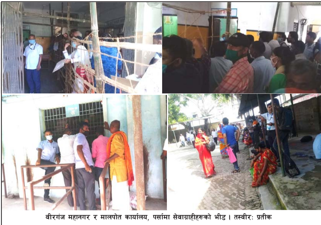
वीरगंज महानगर र मालपोत कार्यालय, पसांमा सेवाग्राहीहरूको भीड ।