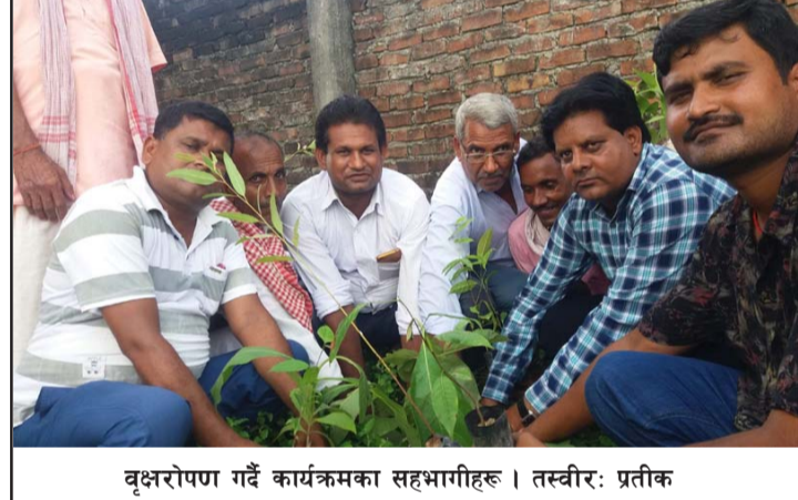
वृक्षरोपण गर्दै कार्यक्रमका सहभागीहरू।