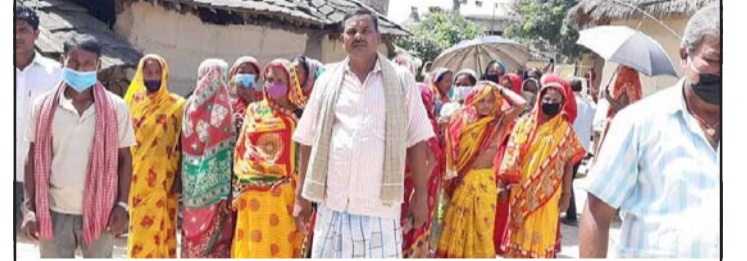
पटेवासुगौली गाउँपालिका-५ का वासीहरू।

प्रस, पंचगावाँ, ४ असोज/ पटेवासुगौली गाउँपालिका-५ का वडावासीहरूले स्थानीय जनप्रतिनिधि र प्रमुख प्रशासकीय अधिकृतको ध्यानाकर्षण गराएका छन्।