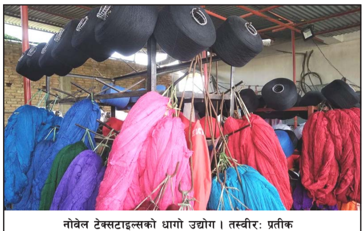
नोबेल टेक्सटाइल्सको धागो उद्योग।