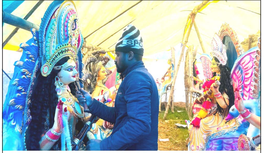
सरस्वतीको मूर्तिमा रङ लगाउँदै मूर्तिकार: सर्लाहीको मलङ्गवा नगरपालिका-४ मा विद्याकी देवी सरस्वतीको मूर्तिमा रङ लगाउँदै मूर्तिकार। श्रीपञ्चमी अर्थात् सरस्वतीपूजाका दिन सरस्वतीको मन्दिर वा शैक्षिक संस्थामा गएर सरस्वतीको मूर्तिमा पूजा आराधना गर्ने गरिन्छ।

“यदि भन्सार महसूल वर्षभरि कायम रह्यो भने मेक्सिकोको जिडपी सन् २०२५ मा चार प्रतिशतले घट्न सक्छ”-उनले चेतावनी दिए-“सन् २०२४ को अन्त्यसम्म मेक्सिको मन्वीको सँघारमा थियो। यदि यो भन्सार महसूल केही महीनासम्म रह्यो भने मेक्सिकाली अर्थतन्त्र गम्भीर मन्वीमा जानेछ।” रासस