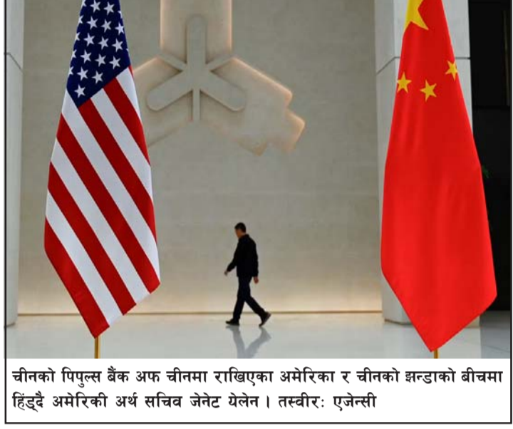
चीनको पिपुल्स बैंक अफ चीनमा राखिएका अमेरिका र चीनको झन्डाको बीचमा हिंडु अमेरिकी अर्थ सचिव जेनेट येलेन।

“व्यापार वा भन्सार युद्धमा कोही विजेता हुँदैन”-विज्ञप्तिमा चीनको विदेश मन्त्रालयले भनेको छ-“थप भन्सार महसूल लगाउने अभ्यास उचित छैन र यसले लागूऔषध नियन्त्रणमा भविष्यको द्विपक्षीय सहयोगलाई अनिवार्यरूपमा प्रभावित र क्षति पुऱ्याउनेछ।” रासस