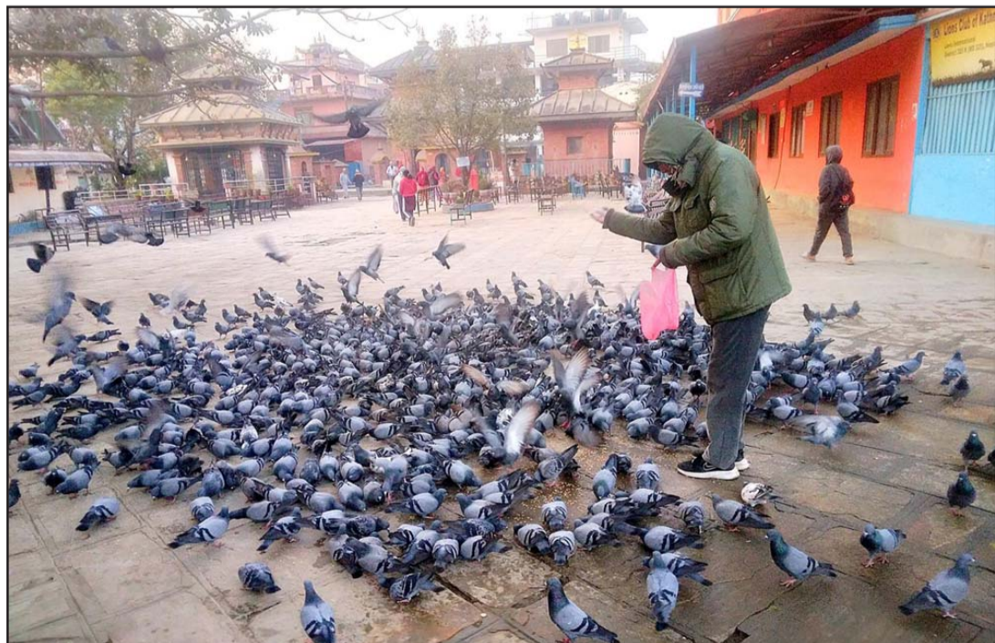
परेवालाई चारो दिई: काठमाडौं महानगरपालिका-१६ स्थित तारकेश्वरधाम परिसरमा परेवालाई चारो दिई सर्वसाधारण।

साथै उन्नति सहकार्य लघुवित्त वित्तीय संस्था, ग्लोबल आइएमई लघुवित्त वित्तीय संस्था, अभियान लघुवित्त वित्तीय संस्था, विजया लघुवित्त वित्तीय संस्था, भूगोल इनर्जी डेभलपमेन्ट कम्पनी लिमिटेड, ग्रामीण विकास लघुवित्त वित्तीय संस्था र एनएमबी माइक्रोफाइनेन्स वित्तीय संस्थाका शेयर मूल्यमा सकारात्मक सर्किट लागेको छ। साथै सामुदायिक लघुवित्त वित्तीय संस्थाको शेयर मूल्यमा भने नकारात्मक सर्किट लागेको छ।