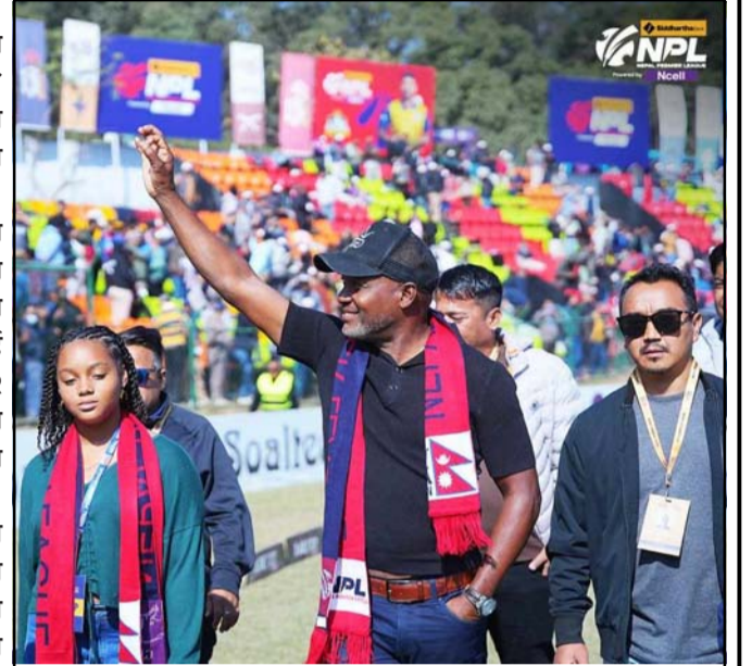
त्रिवि क्रिकेट मैदानमा दर्शकहरूलाई अभिवादन गर्दै वेस्ट इन्डिजका ब्रायन लारा।