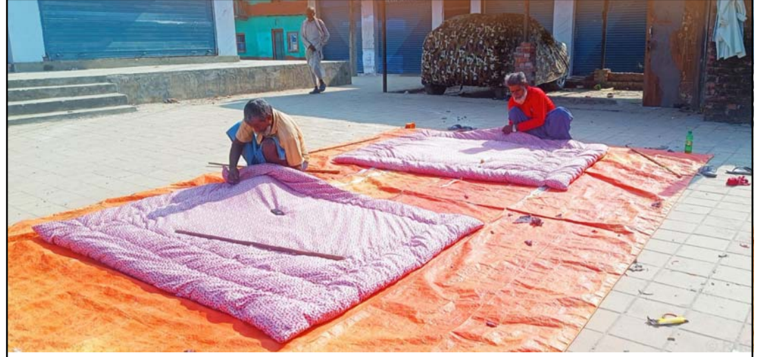
सिरक बनाइँदै: सलाहीको हरिपुर नगरपालिका-२ स्थित बजारमा सिरक बनाइँदै। चीसो बढेसँगै जिल्लामा न्यानो कपडा, सिरक र उसनाको व्यापार बढेको छ।

उनले अबको १८० दिनभित्र आउने अदालतको फैसलाले कोरियाली जनतालाई प्रजातन्त्र र स्वतन्त्रतापतिको आत्मसम्मानलाई प्रकट गर्ने बताए। रासस