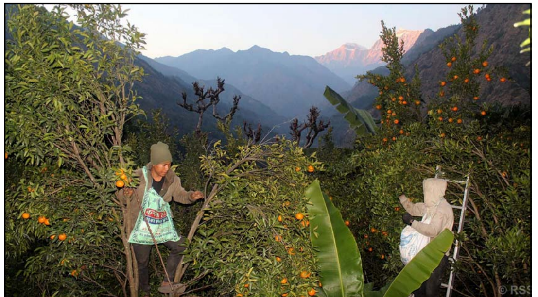
सुन्तला टिप्पि: म्याग्दीको मालिका गाउँपालिका-७ बिमको दुलेमा सुन्तला टिपिपि। फूलबारीका किसानको बारीमा फलेका सुन्तला व्यवसायीहरूले बोटबाटै खरीद गरेर लैजाने गरेका छन्।