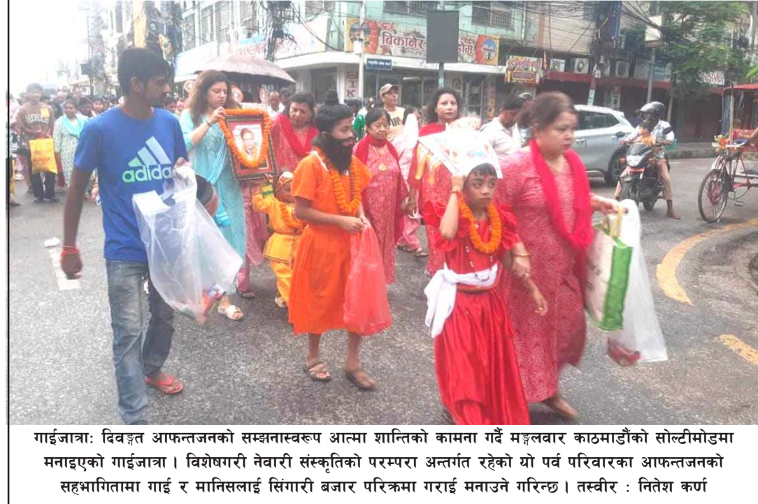
गाईजात्रा: विवर्जित आफन्तजनको सम्झनास्वरूप आत्मा शान्तिको कामना गर्ने मङ्गलवार काठमाडौंको सोल्टीमोडमा मनाइएको गाईजात्रा। विशेषगरी नेवारी संस्कृतिको परम्परा अन्तर्गत रहेको यो पर्व परिवारका आफन्तजनको सहभागितामा गाई र मानिसलाई सिंगारी बजार परिक्रमा गराई मनाउने गरिन्छ।