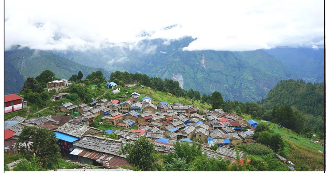
टिकोट गाउँ: बादलको घुम्तोभित्र लुकेको म्याग्दीको अन्नपूर्ण गाउँपालिका-७ अवस्थित टिकोट गाउँ। अन्नपूर्ण-धौलागिरि सामुदायिक पर्यावरणीय पदमार्गमा समेटिएको झुरूप ढुङ्गेघरहरू रहेको यस गाँउमा मगर समुदायको बाहुल्य रहेको छ।

कार्यालय प्रमुख कर्णले चालू आवमा वनपैदावारसँग सम्बन्धित मुद्दालाई प्राथमिकतामा राखेर फर्सोर्ट गर्ने बताए। उनले भने-“वनपैदावारसँग सम्बन्धित मुद्दाको आवश्यक कागजात सङ्कलन गर्ने प्रक्रिया अघि बढेको छ। त्यसैले अब वन पैदावारसँग सम्बन्धित मुद्दा फर्सोर्टले गति लिनेछ।”