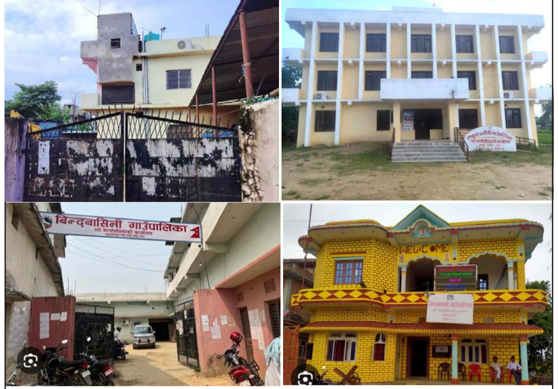
भाडाको घरमा सञ्चालित बहुदरमाई, पटेवासुगौली, विन्ध्यवासिनी र जीराभवानी गापाको कार्यालय ।

जिल्ला प्रहरी कार्यालय, पर्साले प्रवक्ता वीरगंज भारतीयले कार र चालक प्रहरी नियन्त्रणमा रहेको र निजविस्तर मुद्दा दर्ता प्रक्रियामा रहेको जानकारी गराएका छन् ।