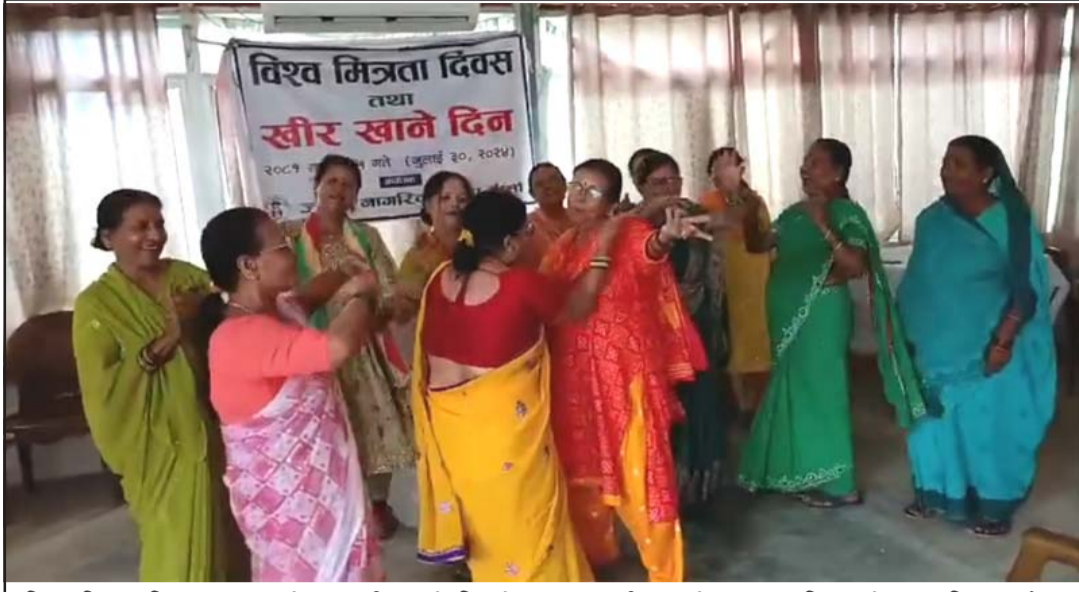
विश्व मित्रता दिवस तथा साउने पन्ध्र खीर खाने दिनको अवसरमा वीरगंजको लक्ष्मणावास्थित ज्येष्ठ नागरिक पार्कमा नाचगान गरेर रमाइलो गर्दै ज्येष्ठ नागरिकहरू।