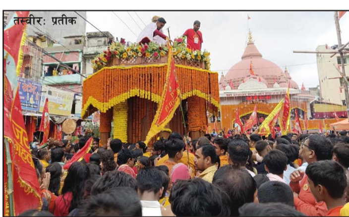
प्रस, वीरगंज, २३ असार/

गहवामाई मन्दिर पुनर्निर्माणको १२ वर्ष पुगेको अवसरमा आइतबार दोस्रोपटक रथयात्रा निकालिएको छ । गत वर्षदेखि शुरू भएको रथयात्रामा ठूलो सङ्ख्यामा भक्तजनहरू सहभागी भएका थिए ।