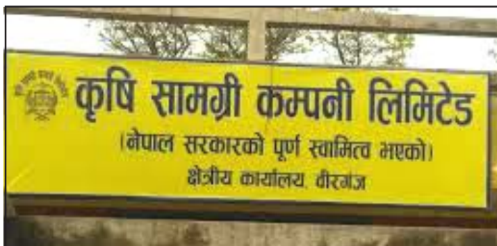
भोगनुपरेको बताए ।

धानबाली लगाउने अहिले मुख्य सिजन हो । तर किसानले भने रासायनिक मल पाइरहेका छैनन् । माग बमोजिमको आपूर्ति नहुनाले प्रत्येक वर्ष किसानले बाली लगाउने बेलामा यो समस्या भेल्लै आउनुपरेको छ । यस वर्ष पनि पर्सामा किसानले माग अनुसारको मल पाउन सकेका छैनन् । वीरगंज-१८ सुखचैनाका मन्दिरका साहले मलको लागि बडा कार्यालय र विभिन्न सहकारी चहादासमेत मल नपाएको गुनासो गरे । उनले यो समस्या यस वर्ष मात्र होइन प्रत्येक वर्ष