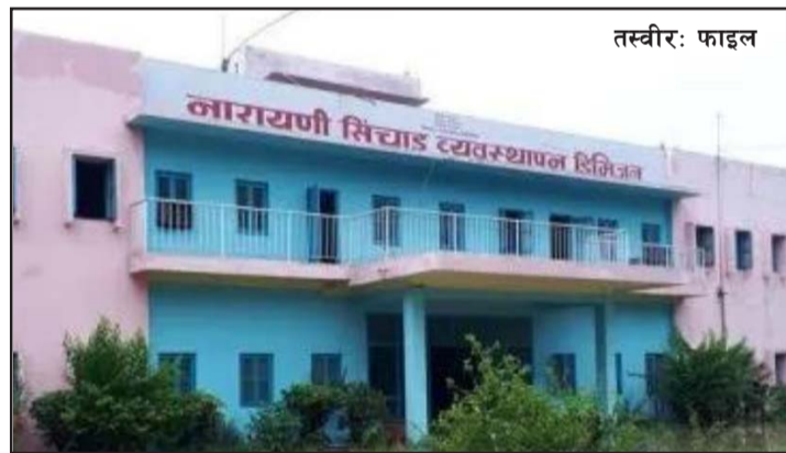
प्रस, परवानीपुर, २३ असार/

नारायणी सिंचाइ व्यवस्थापन कार्यालय, गण्डक, वीरगंजको करीब साढे चार करोड रकम फ्रीज भएर जलस्रोत तथा सिंचाइ मन्त्रालयलाई फिर्ता पठाउनुपरेको छ ।