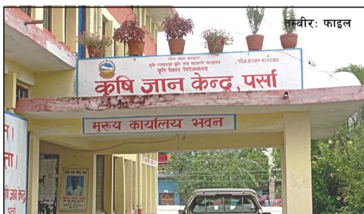
प्रस, परवानीपुर, २३ असार/

जिल्लास्तरमा किसानसँग प्रत्यक्ष सरोकार राख्ने सरकारी कार्यालयको रूपमा कृषि ज्ञान केन्द्रलाई चिनिन्छ । तर कृषि ज्ञान केन्द्र, पर्सामा चालू आवमा करीब तीन करोडभन्दा बढी रकम फ्रीज भएको बुझिएको छ ।