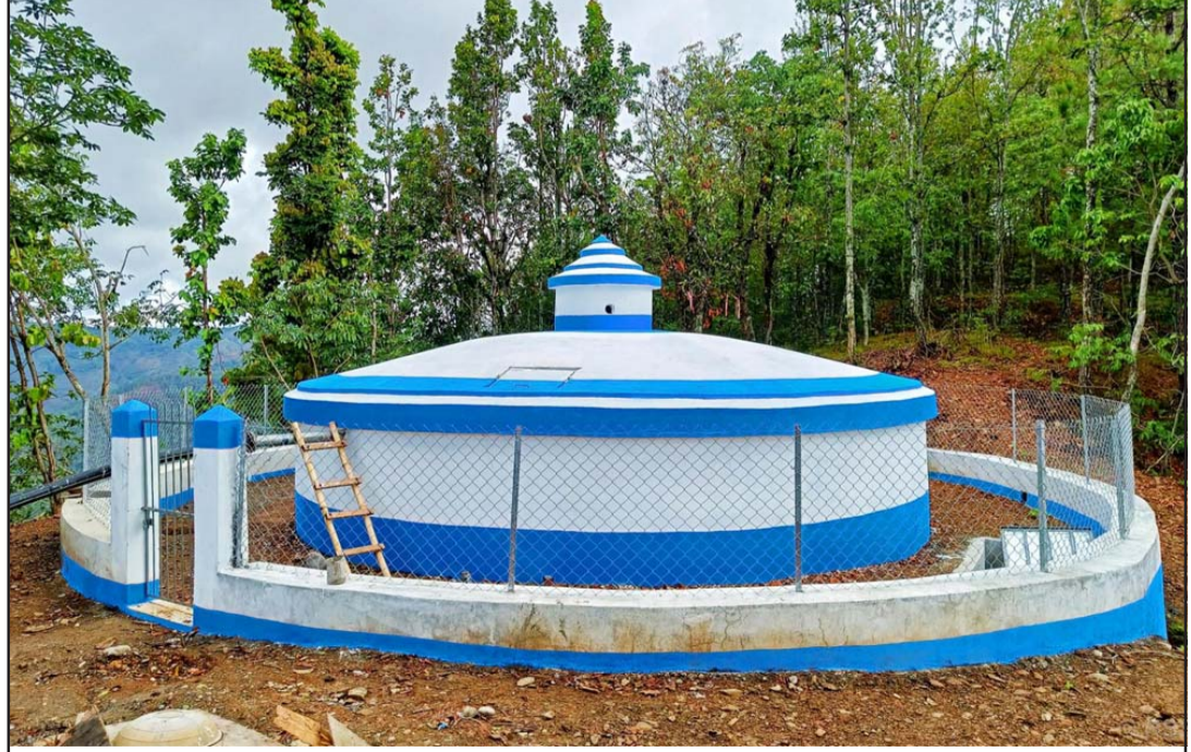
राउतकोटमा निर्माण भएको रिजर्भ बायर टङ्की: दैलेखको भैरवी गाउँपालिका वडा नं १ राउतकोटमा रु दुई करोड २५ लाखको लागतमा निर्माण सम्पन्न भएको राउतकोट लिफ्टेड आयोजनाको रिजर्भ बायर टङ्की । यस आयोजनाबाट २१८ घरधुरी लाभान्वित भएका छन् भने राति ३ बजे पानी लिन जानुपर्ने बाध्यता लिफ्टेडले हटाएको स्थानीयवासी बताउँछन् ।

महामारीहरूले स्वास्थ्य क्षेत्र र चिकित्सकमा ठूलो दबाव पार्ने हुँदा स्वास्थ्य सेवा प्रणालीको बलियो पक्ष र कमजोरीहरू दुवै उजागर हुन्छ । महामारीको प्रभावकारी व्यवस्थापन गर्न पर्याप्त, प्रशिक्षित र लचिलो स्वास्थ्यकर्मीहरूको टिम सुनिश्चित गर्नु