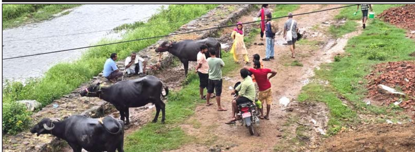
भैँसीको व्यापार: दाङको घोराही उपमहानगरपालिका-१८ स्थित नवलपुरको कटुवा खोला किनारमा बिहीवार भैँसी किनबेच हुँदै। नवलपुरमा हरेक वर्ष असार र साउन महिनामा दाङको देउखुरीबाट बिक्रीका लागि भैँसी लिएर किसान आउने गर्छन्।