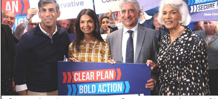
अन्तिम चुनावी प्रदर्शनमा बेलायतका प्रम ऋषि सुनकका साथ पत्नी अक्षत मूर्ति र आमाबुबा।

बेलायतको सार्वजनिक सेवाको स्थिति, जीवनयापनको लागत, कर, आप्रवासन र अर्थतन्त्र निर्वाचनको प्रमुख