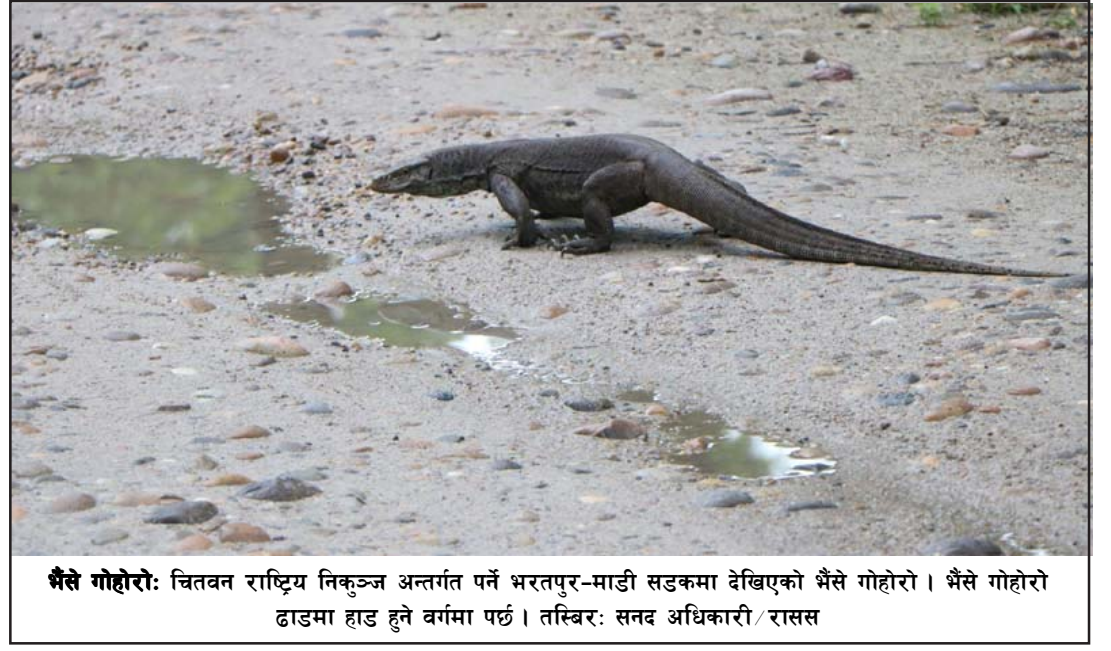
भैसे गोहोरो: चितवन राष्ट्रिय निकुञ्ज अन्तर्गत पर्ने भरतपुर-माडी सडकमा देखिएको भैसे गोहोरो। भैसे गोहोरो डाडमा हाड हुने वर्गमा पर्छ।

इजरायली सेनाले आक्रमणकारीको नाम उल्लेख नगरी अप्रिलदेखि पूर्वबाट थुप्रै हवाई आक्रमणहरू भएका बताउँदै, तर ती सबैलाई यसको हवाई क्षेत्रमा प्रवेश गर्नु अघि रोकिएको पुष्टि गरेको छ। रासस