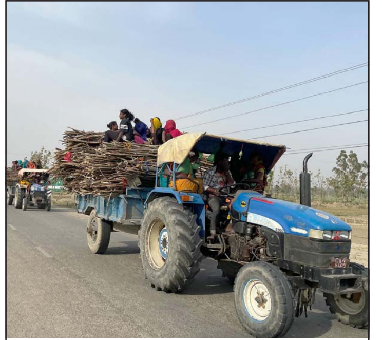
बाउराको जोहो: महोत्तरी जिल्लाको औरही नगरपालिका-२ बस्ने मुसहर समुदायका महिला तथा बालबालिकाहरू चुरे क्षेत्रबाट बाउरा सङ्कलन गरी ट्याक्टरमा राखेर घर फर्कदै।

त्यस्तै, छात्रवृत्तिमा पढेका चिकित्सकलाई काठमाडौंभित्र पदस्थापन नगर्ने नीति कार्यान्वयनमा रहेको मन्त्री यादवले जानकारी दिए।