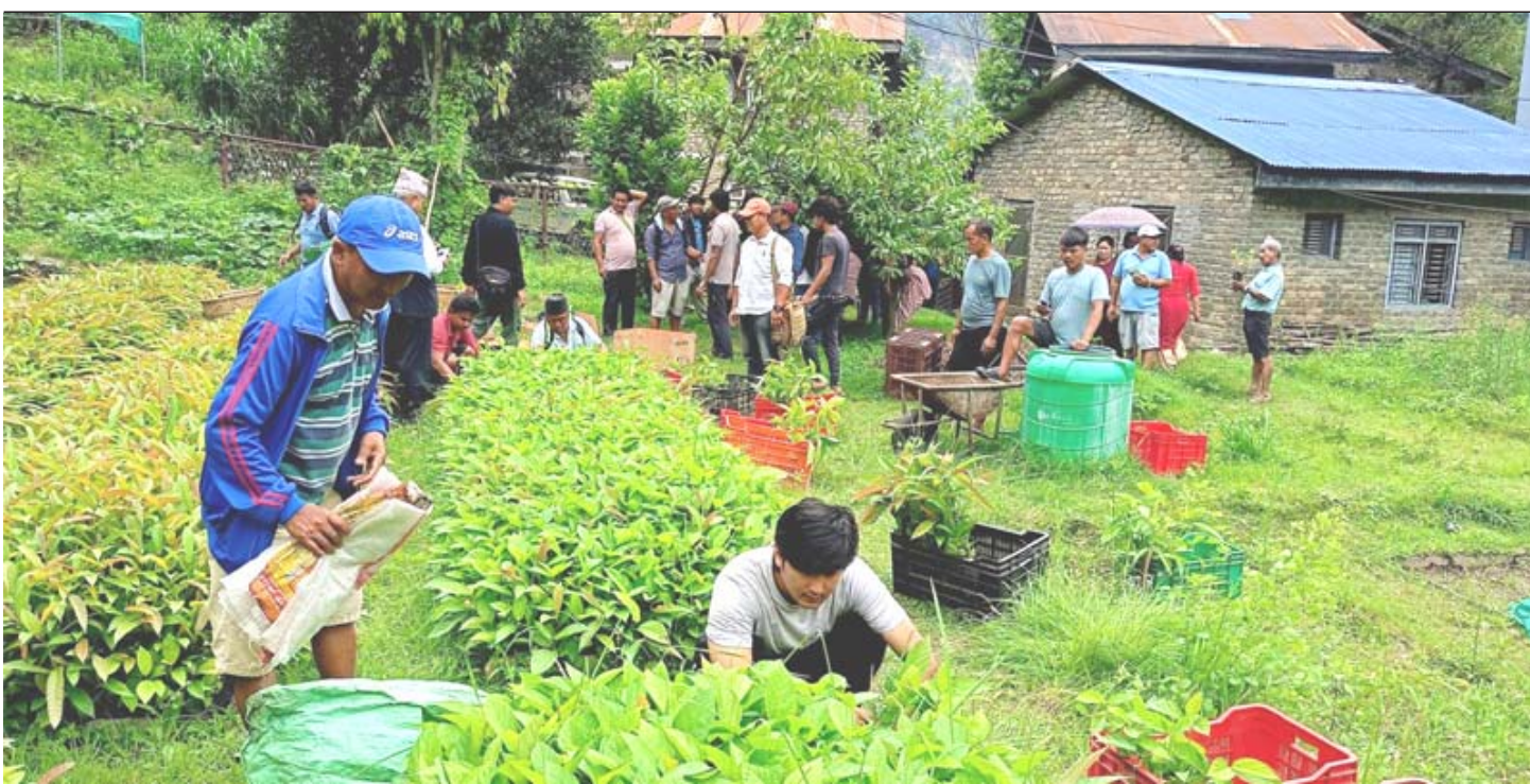
घाँसका विरुवा वितरण गर्दै: भू तथा जलाधार व्यवस्थापन कार्यालय म्याग्दीको बेनीस्थित नर्सरीमा उत्पादन भएको घाँसको विरुवा कृषकलाई वितरण गरिँदै। कृषकलाई घाँस आपूर्तिमा सहज बनाउने, पशुपालनको लागत घटाउने र भक्ष्य न्यूनीकरण गर्ने उद्देश्यले कार्यालय मातहतका चारवटा नर्सरीमा यस वर्ष ६७ हजार घाँसका विरुवा उत्पादन गरेर वितरण थालिएको छ।

माथि प्रस्तुत गरिएका विवरणहरूको आधारमा नेका र एमालेबीच भएको सत्ता साझेदारीको सहमतिको आयु लामो