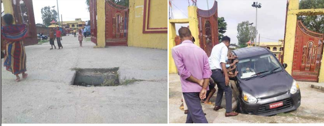
वीरगंज महानगरपालिका-१९ विन्ध्यवासिनीमाई मन्दिरको मूलगेटअगाडि रहेको नालामाथि रहेको प्लेट चार महीनादेखि फुटेपछि दुर्घटनाको सम्भावना बढेको छ। आज बिहान सो स्थानमा कार अडकिँदा निकै सास्ती भएको थियो।