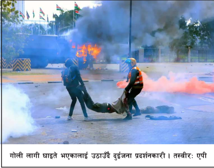
गोली लागी घाइते भएकालाई उठाउँदै दुईजना प्रदर्शनकारी।

प्रदर्शनकारीहरूले सामाजिक सञ्जालमा फाँट राष्ट्रपति रूटोको राजीनामा माग गर्दै विरोध प्रदर्शन गरिरहेका छन्। रासस