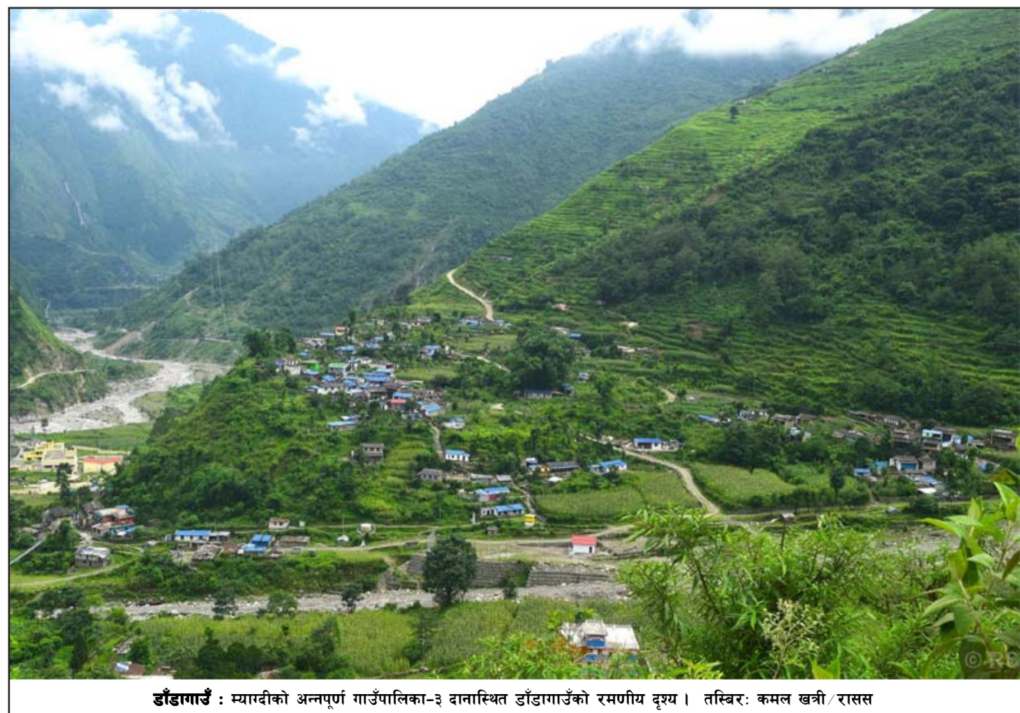
डाँडागाउँ : म्याग्दीको अन्नपूर्ण गाउँपालिका-३ दानास्थित डाँडागाउँको रमणीय दृश्य।