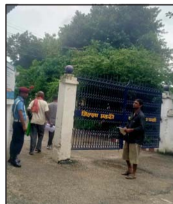
जि.प्र.का. पर्सामा पुगेका बालिकाका दाइ।