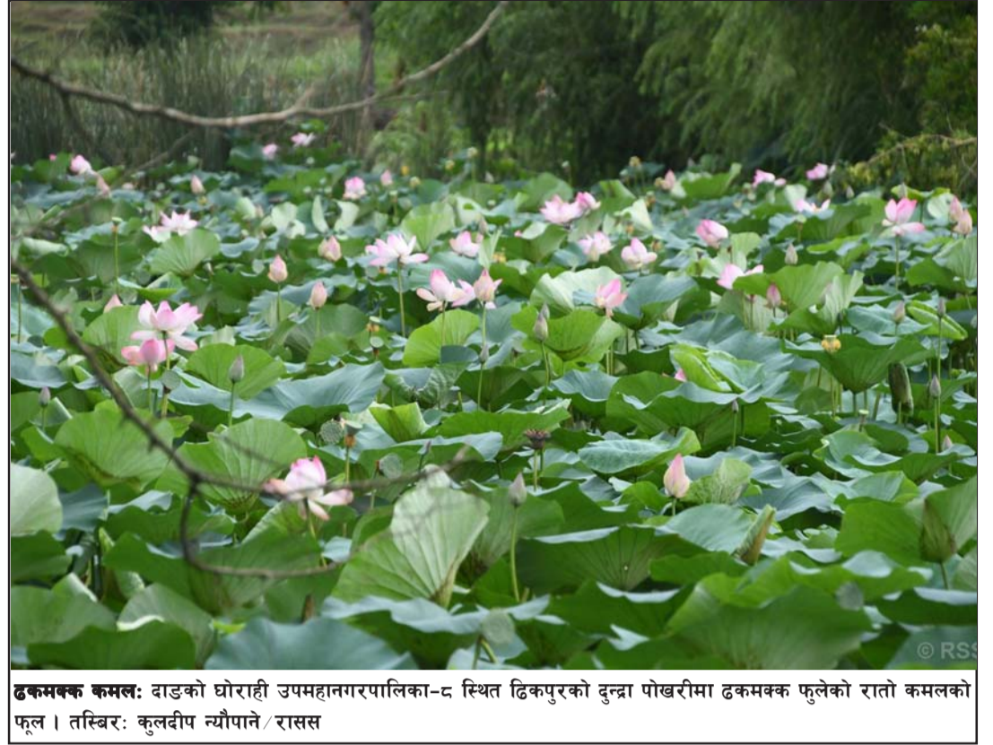
ढकमक्क कमल: दाङको घोराही उपमहानगरपालिका-८ स्थित ढिकपुरको दुन्द्रा पोखरीमा ढकमक्क फुलेको रातो कमलको फूल।

हालै युद्धको तीव्र चरण समाप्त हुँदै गएको घोषणा गर्ने नेतान्याहुले सेनाहरू गाजापट्टीको जताततै राफाह, सुजैयामा सक्रिय रहेको बताए। रासस