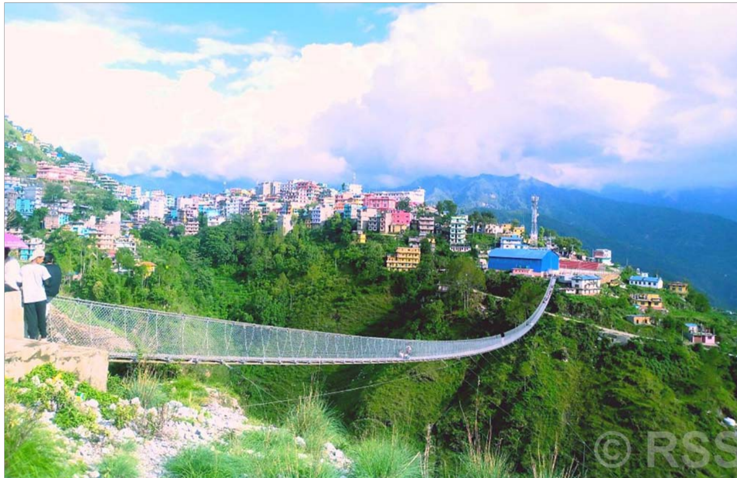
शोलुङ्गे पुल र खलङ्गा बजार: रूकुमपश्चिमको मुसीकोट नगरपालिका-१ स्थित जिल्ला सदरमुकाम खलङ्गा बजार र खलङ्गालाई सल्लेबजारसँग जोड्ने शोलुङ्गे पुल ।

डिब्बाबन्द फल: डिब्बाबन्द फलहरूमा प्रायः सिरप हुन्छ, जसमा चिनी धेरै हुन्छ । मधुमेहका रोगीहरूले ताजा फलफूल खानुपर्छ, जसमा प्राकृतिकरूपमा चिनी (फ्रक्टोज) र फाइबर पनि होस् । - प्रतीक डेस्क (एजेन्सीको सहयोगमा)