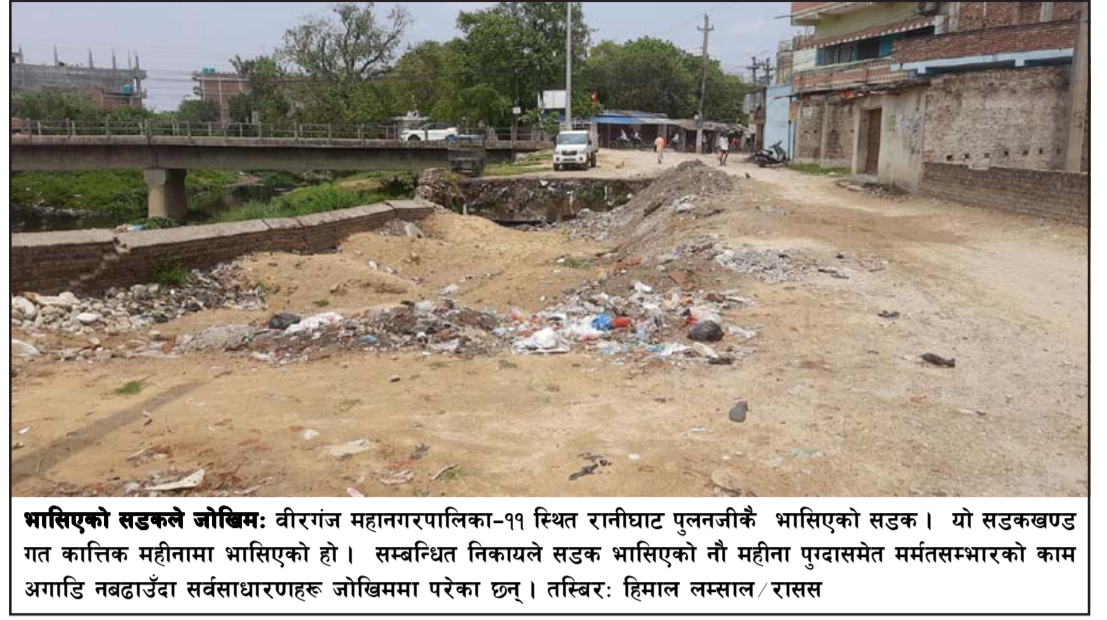
भासिएको सडकले जोखिम: वीरगंज महानगरपालिका-११ स्थित रानीघाट पुलनजीकै भासिएको सडक। यो सडकखण्ड गत कात्तिक महीनामा भासिएको हो। सम्बन्धित निकायले सडक भासिएको नौ महीना पुग्दासमेत मर्मतसम्भारको काम अगाडि नबढाउँदा सर्वसाधारणहरू जोखिममा परेका छन्।

सन् २०१४ मा रुसले कब्जा गरेको तर अन्तर्राष्ट्रियरूपमा युक्रेनी क्षेत्रको रूपमा मान्यताप्राप्त क्रिमियामा घातक इन्द्रमा उल्लेखनीय वृद्धि भइरहेको छ। रासस