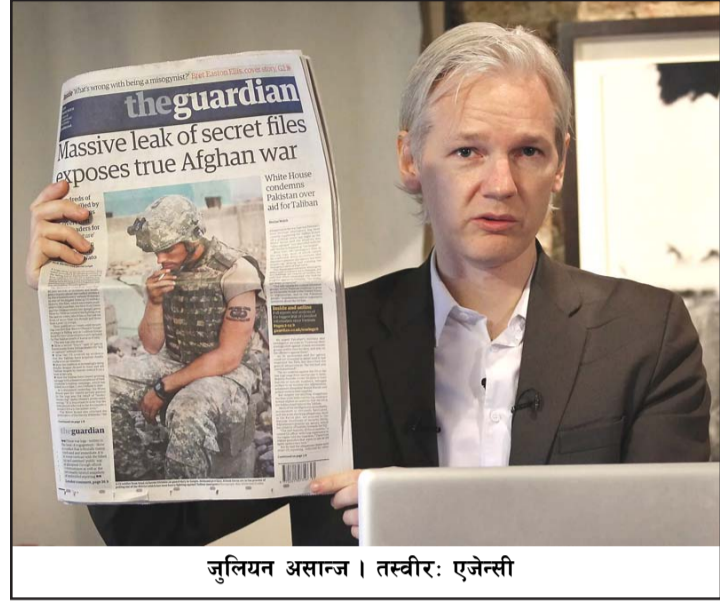
जुलियन असान्ज।

आफूहरूले बारम्बार यो विषय उल्लेख गरिसकेको जनाउँदै उनले यो मुद्दाले लामो समयदेखि मानव अधिकारको चिन्ताको शृङ्खला खडा गरेको बताइन्। रासस