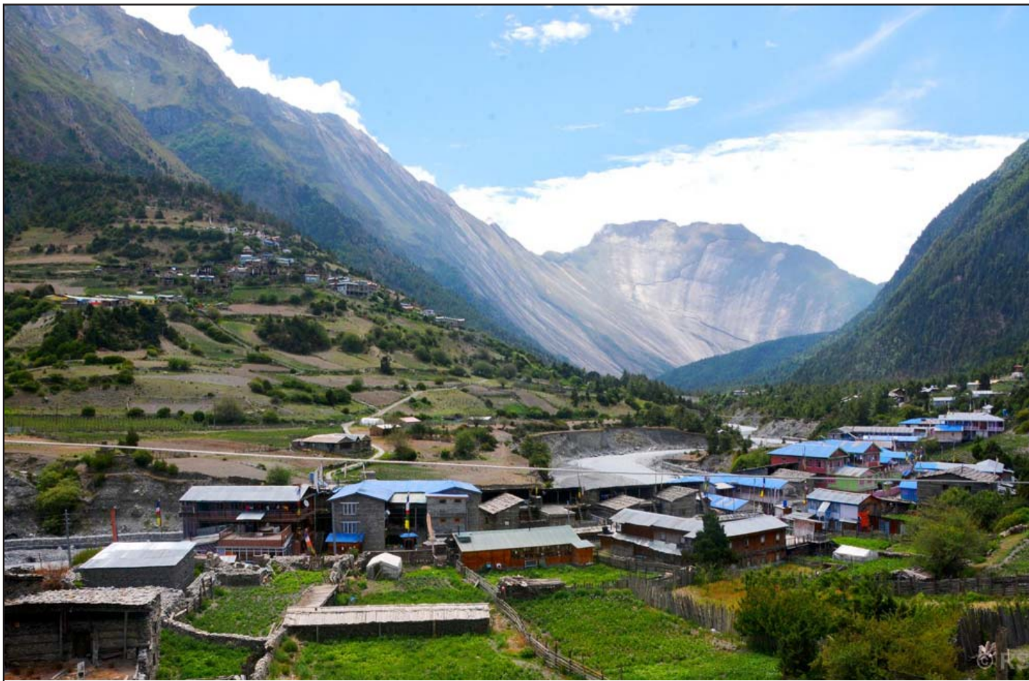
पिसाड गाउँ: हिमालपारिको जिल्ला मनाङको मनाङ डिस्त्रिक्ट गाउँपालिका-१ स्थित पिसाड गाउँ। सामुद्रिक सतहदेखि ३३ सय मिटरको उचाइमा अवस्थित पिसाड विश्वप्रसिद्ध अन्नपूर्ण चक्रीय पदमार्गमा पर्छ।

विश्वास: जीवनसाथीमाथि भरोसा गर्नुस् र साथ मिलेर चुनौतीको सामना गर्न तयार हुनुहोस्। - प्रतीक डेस्क (एजेन्सीको सहयोगमा)