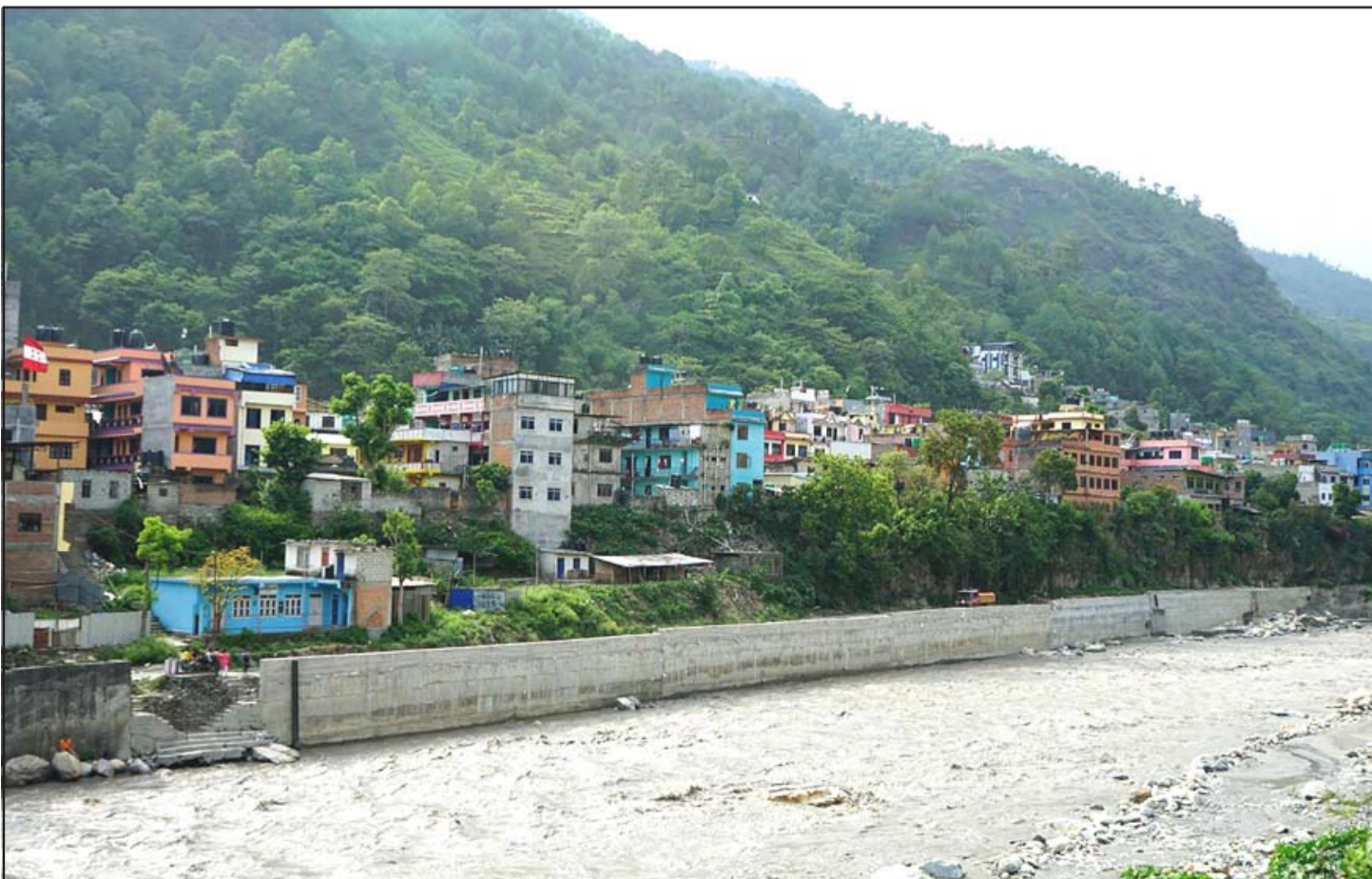
नदी कटान नियन्त्रणका लागि ‘काउन्टर फोर्ट’ प्रविधिको पखाल: म्याग्दीको सदरमुकाम बेनीमा कालीगण्डकी नदीको कटान नियन्त्रणका लागि निर्माण गरिएको काउन्टर फोर्ट प्रविधिको पखाल। रूपताल संरक्षण परियोजनामार्फत बेनी नगरपालिका-७ मा कालीगण्डकी नदी किनारमा १४० मिटर लम्बाइ भएको काउन्टर फोर्ट (नयाँ प्रविधिको बलियो पखाल) र ३० मिटर ‘ग्राभेटी’ प्रविधिको पखाल निर्माण गर्ने काम हालै सम्पन्न भएको छ।