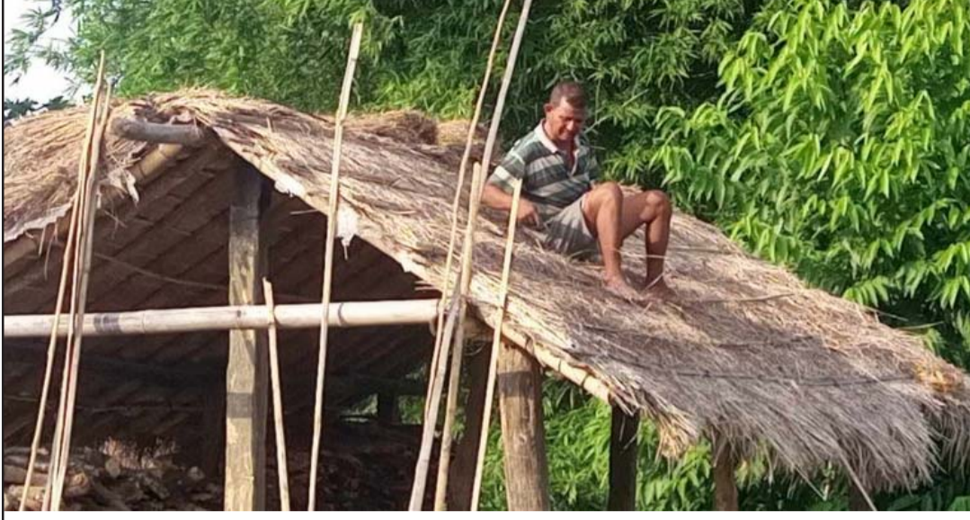
ठोरी गाउँपालिका-२ मा स्थानीयले खरको छाना छाएर फुसको छाप्रो बनाउँदै।