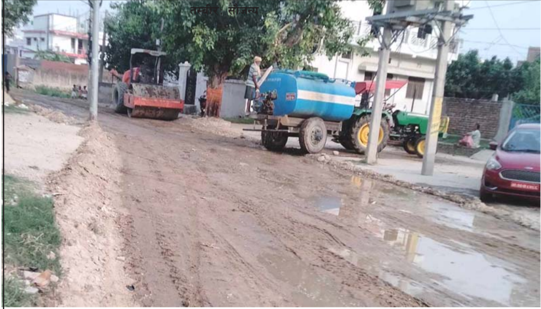
वीरगंज महानगर-१ प्रगतिनगरमा निर्माण भइरहेको सडक ।

भएको हुँदा साढे तीन करोड रुपैयाँ विकास निर्माणका कार्यहरू भुक्तानी बाँकी रहेको बताए । उनले अन्य आशाप्रद रूपमा गर्न सक्ने सङ्केत देखा परेको