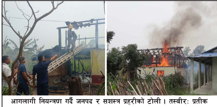
आगलागी नियन्त्रण गर्दै जनपद र सशस्त्र प्रहरीको टोली।