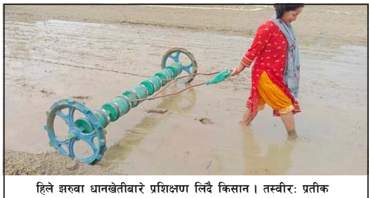
हिले झरुवा धानखेतीबारे प्रशिक्षण लिँदै किसान।