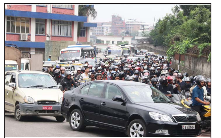
काठमाडौं उपत्यकामा पेट्रोलियम पदार्थको अभावका कारण सोमवार भद्रकालीस्थित सैनिक कल्याणकारी कोषद्वारा सञ्चालित रिपुमर्दिनी पेट्रोलपम्पमा सवारी चालकको लामो लाइन।

कार्यरत श्रमिकलाई उपलब्ध गराउने प्रतिबद्धता व्यवसायीले गर्नेगरी सहमति भएको छ।