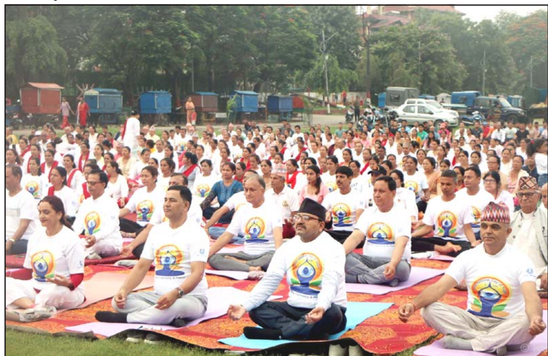
योग शिविर: १०औं अन्तर्राष्ट्रिय योग दिवसको अवसरमा भारतीय महावाणिज्य दूतावास वीरगंजको आयोजनामा चितवनको नारायणी नदी किनारमा सोमवार आयोजित योग शिविरमा सहभागीहरू योगाभ्यास गर्दै।

पार्टीका नेता झलनाथ खनालले सहमति साथ नेतृत्व निर्माणका लागि पार्टीको दस्तावेज तयार गरिएको र अझै परिष्कृत गरेर पारित गरिने बताए। पूर्वप्रधानमन्त्री रहेका नेता खनालले एउटा वैचारिक राजनीतिक कार्यदिशाका साथै नीति, सिद्धान्त र लक्ष्यका आधारमा एकता र सहमति खोजनुपर्ने उल्लेख गरे।