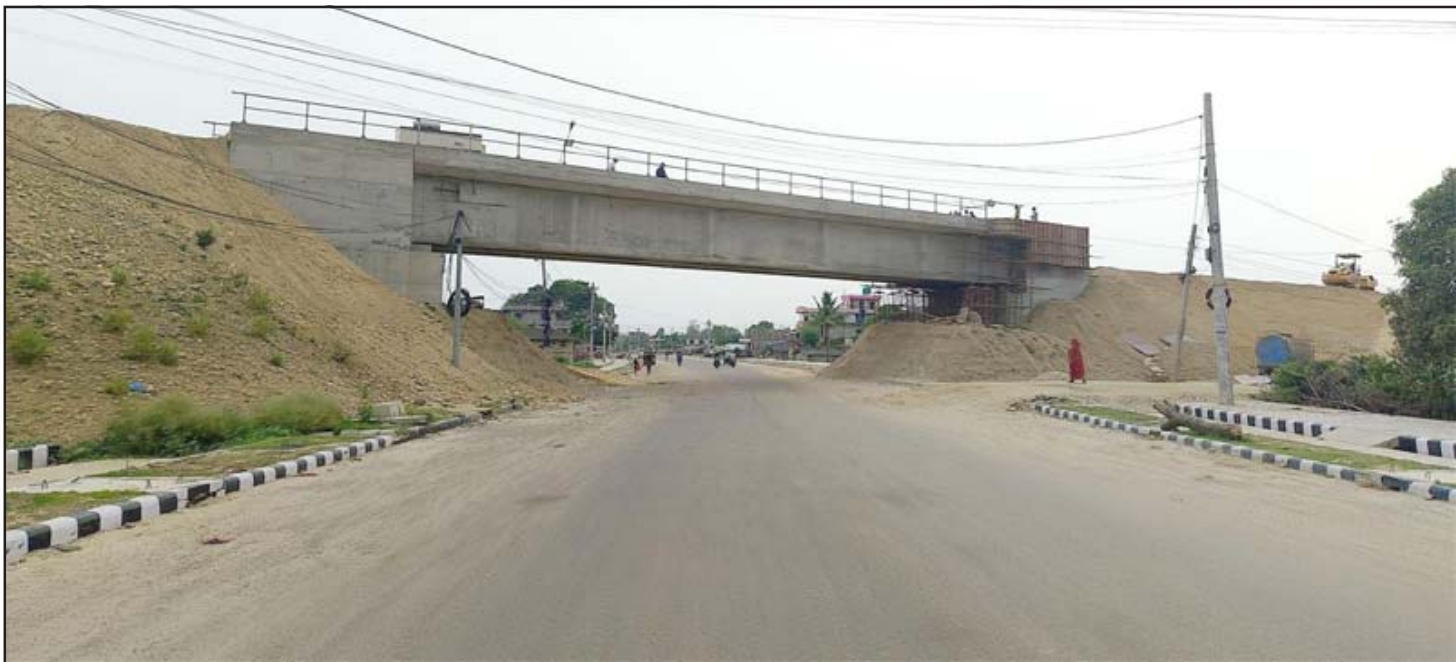
ओभरब्रिज: पूर्व-पश्चिम रेलमार्गका लागि महोत्तरी जिल्लाको बर्दिबास भित्री शहरको सडकमाथि बनाइएको 'ओभरब्रिज'। यस पुलको मुनिबाट अन्य सवारीसधान तथा यात्रीहरू ओहोरदोहोर गर्छन् भने माथिबाट रेल चल्छ।

सम्झनामा अहिले पनि साउदी अरबमा आतेजाते विमान टिकटको व्यवस्था गरी पर्ने यी दुवै तीर्थस्थलमा ठूलो मेला लाने गरेको छ, उनले भने।