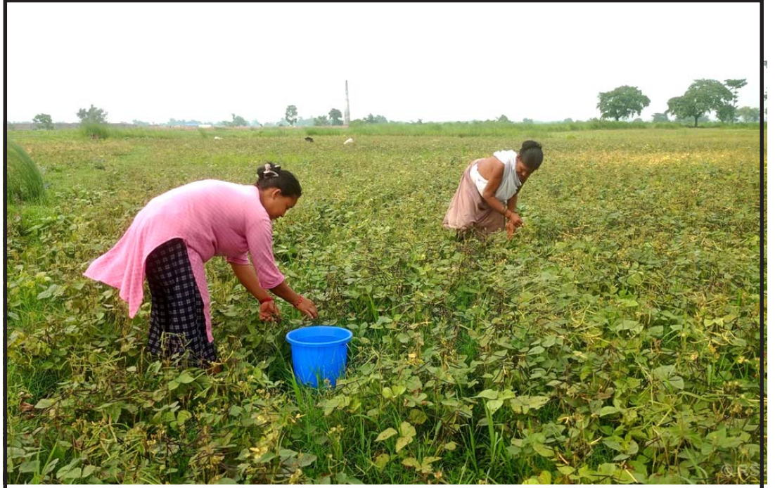
सुनसरीको गढी गाउँपालिका-३ छिटाहामा मुडको दालको कोसा टिप्दै किसान। मुडको दाल एक कट्टामा १५ देखि २० किलो फल्ले किसान बताउँछन्।

"हामी सधैं सहमत हुन सक्दौं, र यदि असहमतिका बिन्दुहरूलाई मौन