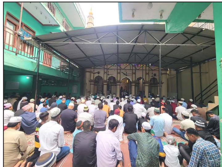
तनहुँको व्यास नगरपालिका-४ स्थित नुरी हन्फी जामे मस्जिदमा सामूहिक नमाज पढ्दै मुस्लिम समुदाय।

जन्मिनुभएको सलल्ला ५३ वर्षको यस पर्वका अवसरमा मक्का मदिना उमेरपछि मदिनामा सन्नुभएको थियो, यही जानु शुभ मानिन्छ। गृह मन्त्रालयले