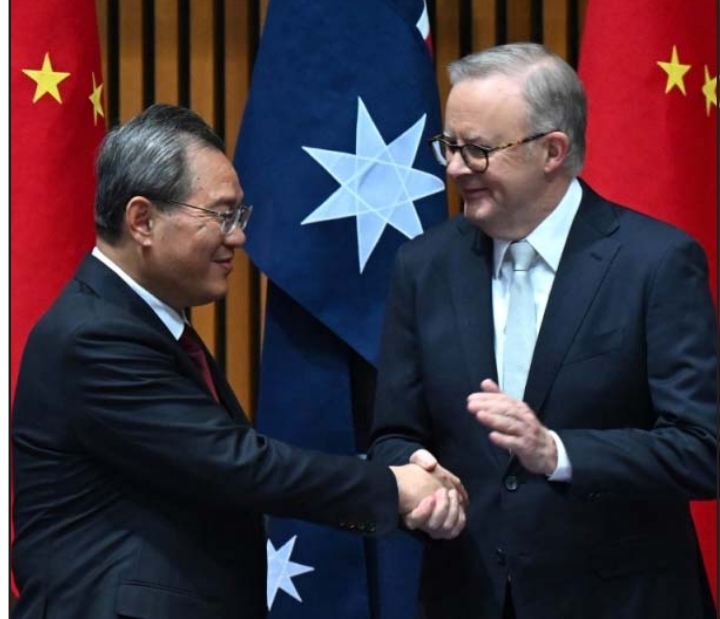
चिनियाँ प्रधानमन्त्री ली किआङ र अस्ट्रेलियाका प्रधानमन्त्री एन्थोनी अल्बानिज वार्ता गर्नु अघि।

ती प्रतिबन्धहरूले गर्दा अस्ट्रेलियाली निर्यातकर्ताहरूलाई एक वर्षमा २० अर्ब अस्ट्रेलियाली डलर (१३ अर्ब अमेरिकी डलर) घाटा लागेको थियो। रासस