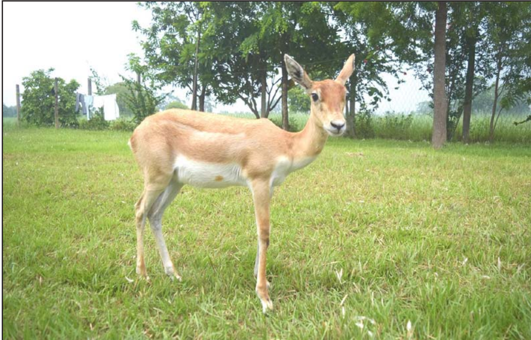
दुर्लभ वन्यजन्तु कृष्णसारको बच्चा: बर्दियाको गुलरिया नगरपालिकास्थित खैरापुरको प्राकृतिक वासस्थानमा पाइने एन्टीलोप प्रजातिको दुर्लभ वन्यजन्तु कृष्णसारको बच्चा। प्रजाति लोप हुनबाट जोगाउन शुक्लाफाँटा राष्ट्रिय निकुञ्जको फाँटामा स्थानान्तरण गरी संरक्षण भइरहेको छ।

कारोबार रकम र कारोबार भएका शेयर सङ्ख्याका आधारमा नेपाल फाइनान्स लिमिटेडको सबैभन्दा धेरै रु ३० करोड ४० लाख ५३ हजार ४९२ बराबरको चार लाख ७९ हजार ९८७ किता शेयर किनबेच भएका छन्।