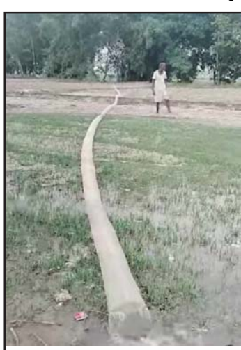
पम्पिङसेटबाट बीउमा सिंचाइ गर्दै किसान ।

उत्पादन नबढाउने बताए । उनले वर्षाबाट हुने सिंचाइले बीउ राम्ररी हुर्किने र त्यस्तो