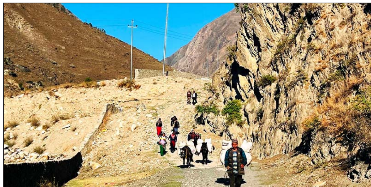
यातायातका साधन घोडा: जाजरकोटको नलगाड नगरपालिका-१२ तल्लुबजारबाट डोल्पाको सदरमुकाम दुनै घोडामा सामान लगीदै।