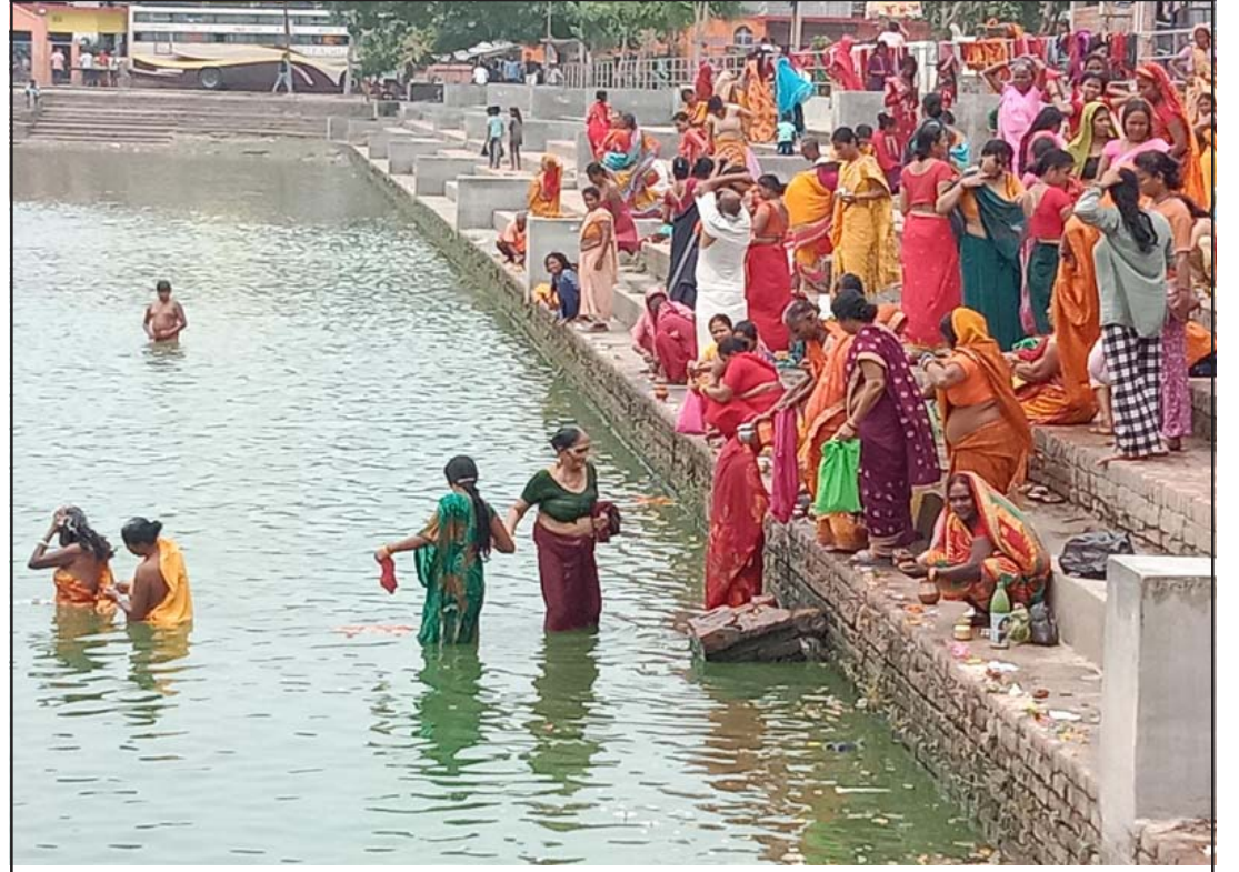
पोखरीमा ब्रतलुहरूको घुईचो: जनकपुरधाम उपमहानगरपालिका-८ मा रहेको दशरथ 'तलाव' पोखरीमा गङ्गा दशहरा पर्वको अवसर पारी नुहाउने ब्रतलुहरूको घुईचो।

निर्यातकर्ताहरूलाई एक वर्षमा अनुमानित २० अर्ब अस्ट्रेलियाली डलर (१३ अर्ब अमेरिकी डलर) घाटा लागेको थियो। सन् २०२२ मा प्रधानमन्त्री एन्थोनी अल्बानेजको सरकारले सत्ता सम्हालेपछि र चीनप्रति नरम कूटनीतिक दृष्टिकोण राखेपछि क्रमशः ती वस्तुमा लगाइएको अतिरिक्त शुल्क हटाइएको छ। ली र अल्बानीजले सोमवार क्यानबेरामा बन्द कोठामा विदेशी प्रभाव, मानव अधिकार, यस क्षेत्रमा चिनियाँ सेनाको कथित 'असुरक्षित' व्यवहार र प्रशान्त क्षेत्रमा उनीहरूको प्रतिद्वन्द्विताका विषयमा वार्ता गर्नेछन्। रासस