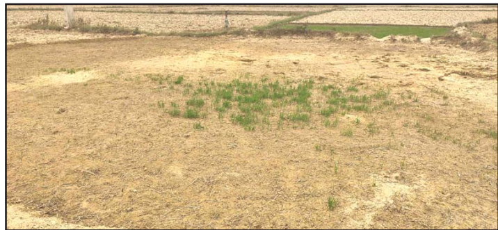
किसानहरूले रोपेका धानका बीउ सुक्न थालेका छन् ।