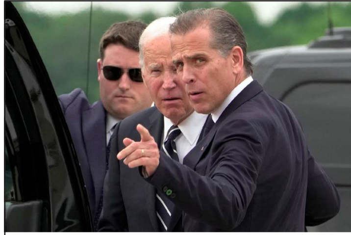
राष्ट्रपति बाइडेन छोरा हन्टर बाइडेनसँग कुरा गर्दै।

उनका भाइ व्यूको सन् २०१५ मा क्यान्सरबाट मृत्यु भएको थियो भने उनकी बहिनी नाओमीको सन् १९७२ को कार दुर्घटनामा मृत्यु भएको थियो। यसै घटनामा जो बाइडेनको पहिलो पत्नी निलियाको पनि मृत्यु भएको थियो।