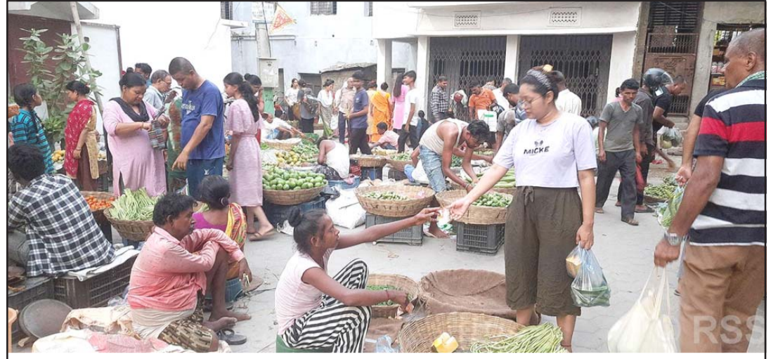
तरकारी किनमेल: वीरगञ्ज-४ बितामा तरकारी किन्दै सर्वसाधारण। यहाँ तरकारी अन्यत्रभन्दा सस्तोमा पाइने उपभोक्ताहरू बताउँछन्। बितामा सातामा दुई दिन मङ्गलवार र शुक्रवार बजार लाग्ने गर्छ।

नेता जोर्डन बार्डेलसँग भएको बहसमा उनलाई व्यापकरूपमा पछ्याइएको थियो। रासस