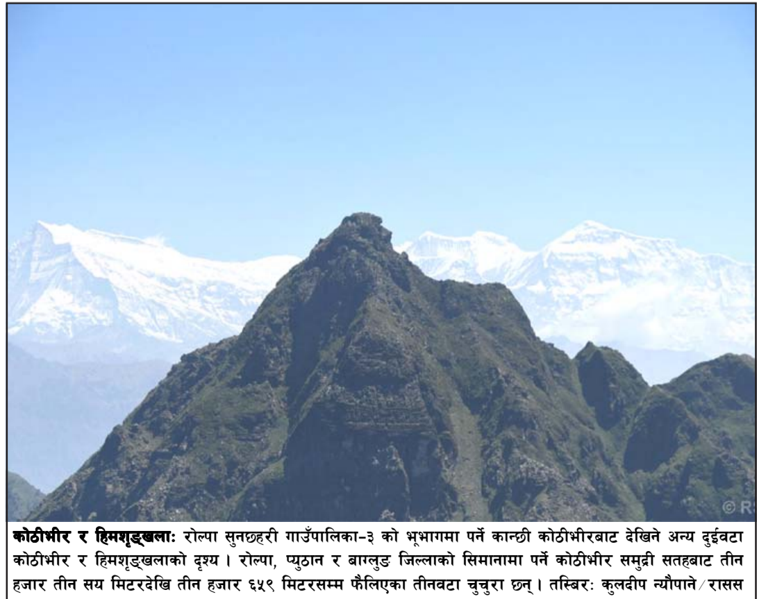
कोठीभीर र हिमशृङ्खला: रोल्पा सुनछहरी गाउँपालिका-३ को भूभागमा पर्ने कान्छी कोठीभीरबाट देखिने अन्य दुईवटा कोठीभीर र हिमशृङ्खलाको दृश्य। रोल्पा, प्युठान र बागलुङ जिल्लाको सिमानामा पर्ने कोठीभीर समुद्री सतहबाट तीन हजार तीन सय मिटरदेखि तीन हजार ६५९ मिटरसम्म फैलिएका तीनवटा चुचुरा छन्।

महाधिवेशनबाट २०१ सदस्यीय केन्द्रीय कमिटी र २० सदस्यीय पदाधिकारी निर्वाचित हुनेछन्। त्यसमा अध्यक्ष एक, सहअध्यक्ष एक, उपाध्यक्ष पाँच, महासचिव दुई, उपमहासचिव तीन, सचिव सात र कोषाध्यक्ष एकजना चयन हुनेछन्।