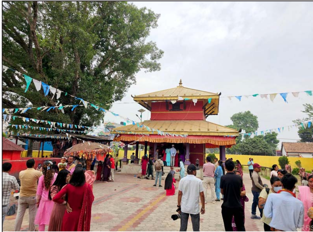
सुर्खेतको देउतीबज्यै मन्दिर: कर्णाली प्रदेशको राजधानी सुर्खेतको वीरेन्द्रनगरमा अवस्थित प्रसिद्ध धार्मिक पर्यटकीयस्थल देउतीबज्यै मन्दिरमा मङ्गलवार बिहान पूजा आराधना गर्न आएका भक्तजनहरू।

तिर्खा लाग्ने, टाउको दुख्ने, खुट्टा बाउँडिने, चक्कर आउने, बेहोश हुने, मांसपेशीहरू दुख्ने, बान्ता आदि हुन सक्ने सम्भावित असरहरू देखिन्छन्। यसबाट बच्न बढी गर्मीको समयमा घरभित्र अर्थात् चिसो स्थानमा रहने, बाहिरी वातावरणमा बढी नजान्ने, हल्का लुगा लगाउने, सुती कपडा लगाउने, बाहिर निस्कँदा टाउको छोप्ने, टोपी लगाउने, नियमित पानी तथा झोल पदार्थ (जुस, सर्बत आदि) प्रशस्त मात्रामा पिउन महाशाखाले सुझाएको छ।