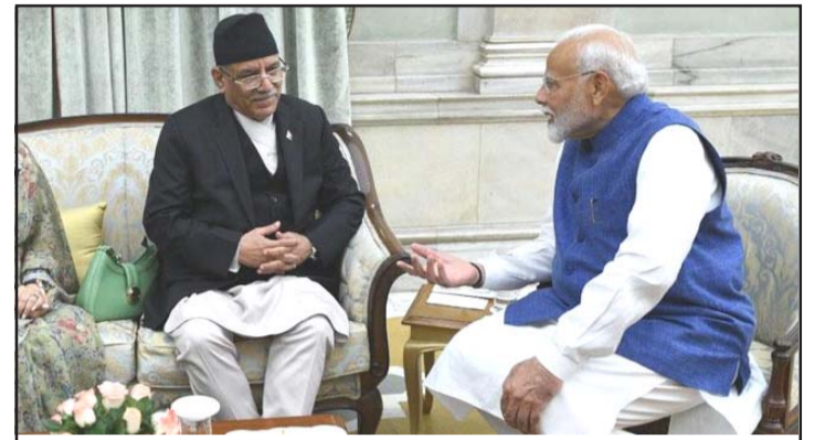
प्रधानमन्त्री प्रचण्ड र प्रधानमन्त्री नरेन्द्र मोदीसँग भेटवार्ता गर्दै ।

नवनि्युक्त सङ्घीयमन्त्री एस जयशङ्करले शिष्टाचार भेट गरेका छन् ।