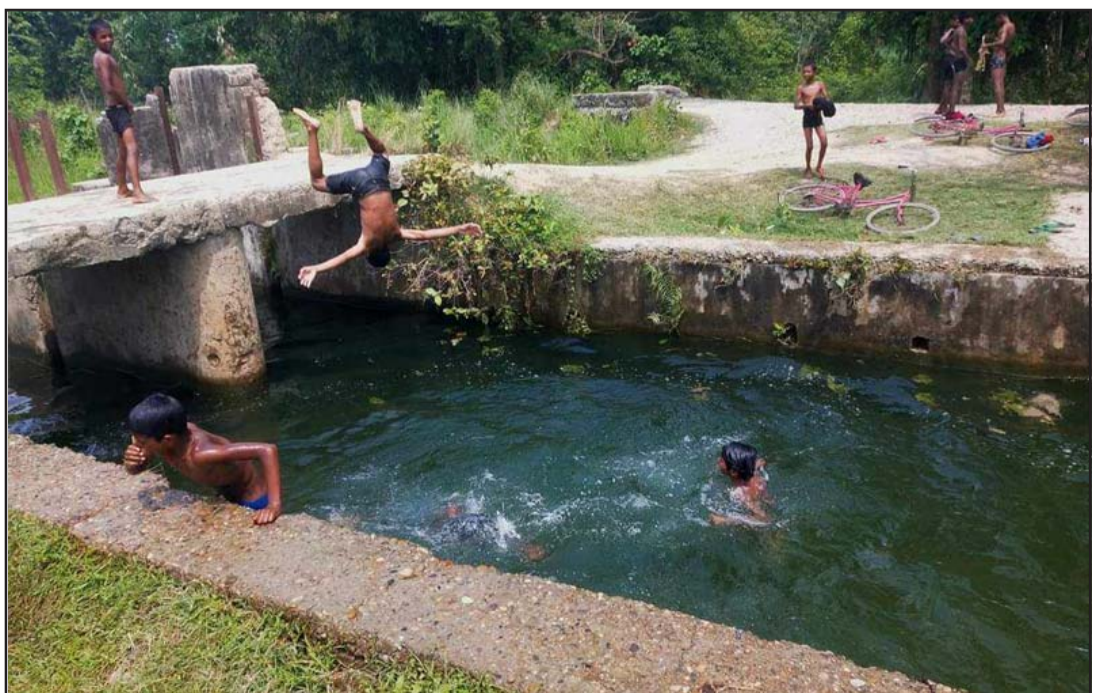
बागमती सिंचाइ कार्यालयले नहरमा पानी दिएपछि सर्लाहीमा गर्मी छल्न बच्चाहरू नहरमा नुहाउँदै ।

सूचना अधिकारी कँडेलले सेवा लिनेले हरेक वर्ष नवीकरण गराउनुपर्ने बताइन् । उनले भनिन्, “नवीकरण आवश्यक छ । नयाँ दर्ता गराउन चाहनेले आफू बस्ने वडामा गएर स्वास्थ्य बीमा गराउन सक्छन् । प्रत्येक वडामा दर्ता सहयोगी छन् ।”