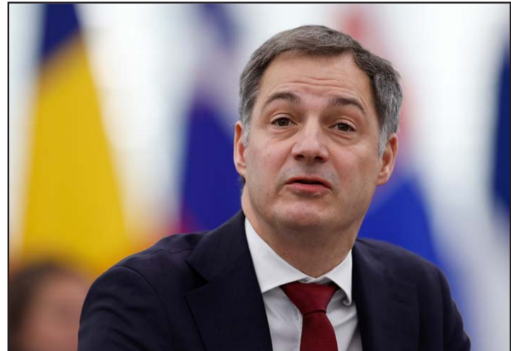
बेल्जियमका प्रधानमन्त्री अलेक्ज्यान्डर डी क्रू।

रूसले युक्रेनमा गरेको आक्रमणले युरोपेली संसद्को किनारमा द्वन्द्व ल्याएको छ, जसले यस क्षेत्रमा शान्ति र स्थिरता कायम गर्न सडकको भूमिकालाई जोड दिएको छ। युरोपेली संसद्मा सामेल हुन चाहने युक्रेनले भूराजनीतिक जटिलतालाई थप जोड दिन्छ। रासस