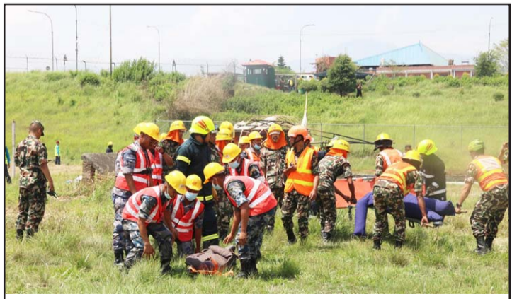
विमान दुर्घटना उद्धार अभ्यास: विमानस्थल सङ्घटनकालीन योजना अन्तर्गत हवाई उडान तथा सुरक्षा र मेडिकल एवं उद्धार सम्बन्ध विभिन्न निकायको सहभागितामा विमान दुर्घटनासम्बन्धी पूर्णकालीन अभ्यासमा सोमवार त्रिभुवन विमानस्थल परिसरमा विमान आगलागीपश्चात् नमूना उद्धार अभ्यास गर्दै।

सँगालेका छन्। प्रदर्शनीको छेउमा उनले लेखेका छन्, "यहाँबाट कुनै सिक्का ननिकाल्नुहोला, बरु आफ्नो कलेक्सनमा रहेको तर यहाँ नभएका सिक्काहरू इच्छा अनुसार दान गर्न सक्नुहुन्छ। इच्छा अनुसार अर्को प्रदर्शनीमा नाम र फोटो डकुमेन्ट गरिनेछ। यो कला देशभित्र वा बाहिरको कुनै सङ्ग्रहालय, ग्यालरी वा पब्लिक प्लेसमा कलेक्सन होस् भन्ने चाहना रहेको छ।" तर कलाकार श्रेष्ठको त्यहाँको अनुभव नौलो छ।