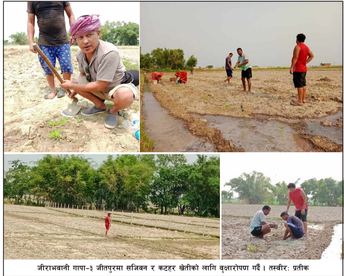
जीराभवानी गापा-३ जीतपुरमा सजिवन र कटहर खेतीको लागि वृक्षारोपण गर्दै ।

अलपत्र रहेका पुराना घरहरू सम्पन्न गर्ने रणनीति लिएको बताए । प्रमुख मिश्रले आवश्यक रकम नआए पनि जति आउँछ, सबै रकम पुराना अलपत्र परेका घरको भुक्तानी गर्नमा लगाउने बताए ।