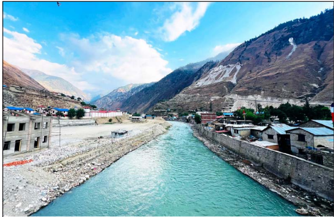
भेरी नदी: डोल्पाको सदरमुकाम दुनै बजारको बीच भाग भएर बगिरहेको भेरी नदी। वर्षायाममा नदीको बहाव उच्च भएपछि सदरमुकाम दुनै बजार जोखिममा पर्ने गरेको छ।

भारतीय प्रधानमन्त्री मोदीले नवनिर्वाचित सबै मन्त्रीहरूलाई बधाई ज्ञापन गर्दै भने-"म १४० करोड भारतीयको सेवा गर्न र भारतलाई प्रगतिको नयाँ उचाइमा पुऱ्याउने मन्त्रपरिषदसँग मिलेर काम गर्न उत्सुक छु। आज शपथ ग्रहण गर्नुहुने सबैलाई बधाई छ। मन्त्रीहरूको यो टोली युवा र अनुभवको ठूलो मिश्रण हो र हामी जनताको जीवन सुधार गर्न कुनै कसर बाँकी राख्नेछैनौं।" रासस