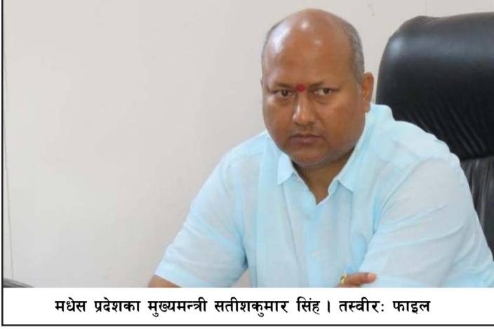
मधेस प्रदेशका मुख्यमन्त्री सतीशकुमार सिंह।

नवगठित प्रदेश सरकारले विगतका योजना पूरा गर्ने प्रतिबद्धता व्यक्त गरे। सर्वोच्च अदालतले सांसद विकास कोष खारेजका सम्बन्धमा गरेको निर्णयको सम्मान गर्दै सांसदहरूले आफ्नो संसदीय क्षेत्रमा सञ्चालन गर्ने योजना तथा