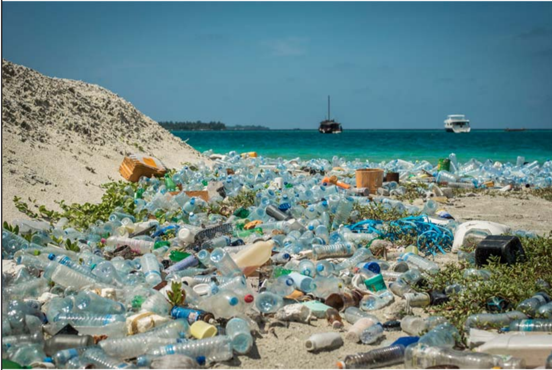
समुद्री किनारामा फैलिएको प्रदूषण।

संयुक्त राष्ट्रसङ्घ, २७ जेठ/सिन्धवा संयुक्त राष्ट्रसङ्घका महासचिव एन्टोनियो गुटेरेसले शनिवार सङ्घटन समुद्रलाई बचाउने कदम चाल्न अन्तर्राष्ट्रिय समुदायसमक्ष आह्वान गरेका छन्।