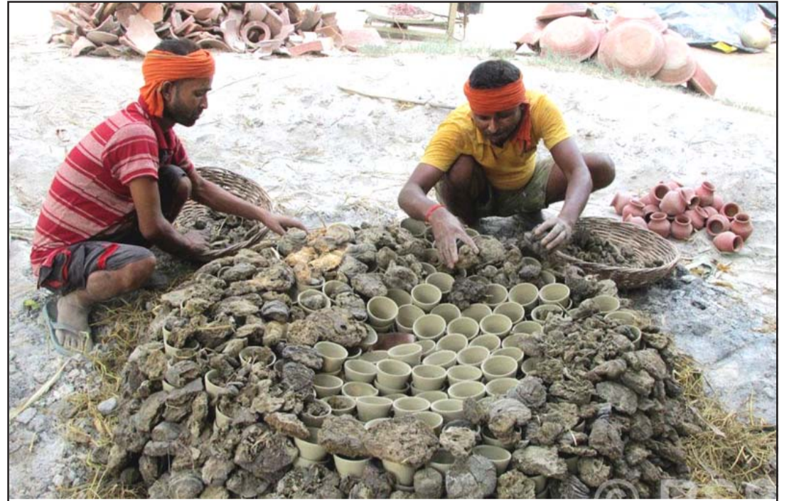
मट्का पोल्दै कुमाले: कञ्चनपुरको शुक्लाफाँटा नगरपालिका-१२ कालागौडीका कुमाले मट्का पोल्दै। धातुका भाँडाभन्दा माटोका भाँडाको माग धेरै हुन थालेपछि कुमालेलाई काम गर्न भ्याइनभ्याइ छ।

इजिप्टले ३६ हजार भन्दा बढी मानिसको ज्यान लिएको यो मानवीय सङ्घटन अन्त्य गर्ने जिम्मेवार निकाय आवश्यक भएको कुरामा जोड दिँदै गाजा पट्टीभरि पूर्ण युद्धविराम हासिल गर्ने अनिवार्यता र क्षेत्रमा सबै क्रिसिडमाफत मानवीय सहायता र राहत आपूर्तिलाई अप्रतिबन्धित प्रवेश दिनुपर्ने कुरामा जोड दिएको छ। रासस