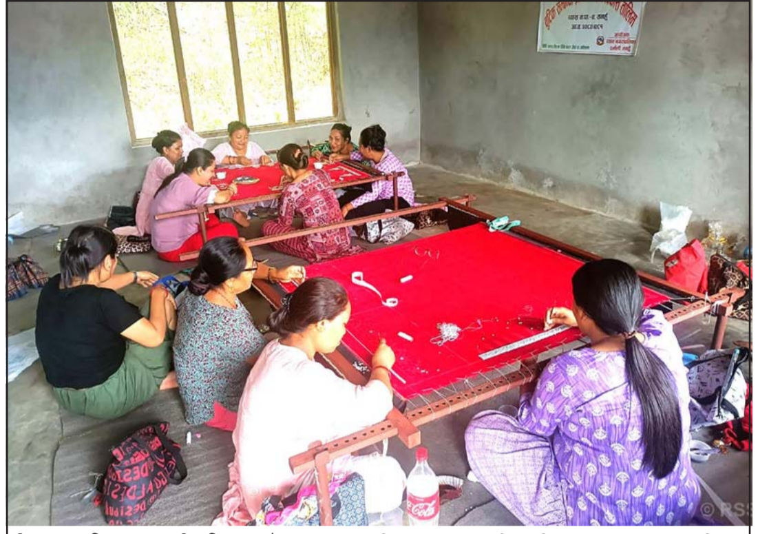
सीपमूलक तालिममा सहभागी महिला: तनहुँको व्यास नगरपालिका-४ मा सञ्चालित बुटिक तालिममा सहभागी महिला। महिलालाई आत्मनिर्भर बनाउन वडा कार्यालयको आयोजनामा सीपमूलक तालिम दिइएको हो।

प्राकृतिक स्रोतहरूको खानी रहेको कचिन राज्यमा यी प्राकृतिक स्रोत जातीय कचिन विद्रोही र म्यान्मामाको सेनालाई दशकौं लामो गृहयुद्धका क्रममा आकर्षक आम्दानीको रूपमा रहेका छन्। यो क्षेत्र इलेक्ट्रिक साधनहरूमा प्रयोग हुने चुम्बकको खानीका लागि पनि प्रसिद्ध छ। रलोबल विटनेसले गत महीना सेटेलाइट इमेजरीलाई उद्घृत गर्दै पाडुवा शहरको वरपर ३०० भन्दा बढी खानी स्थल रहेका बताएको थियो। रासस