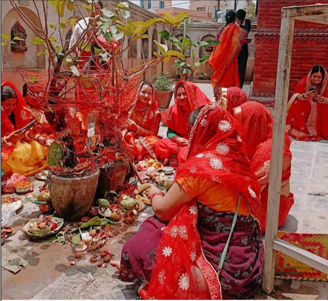
वटसावित्री पर्व अन्तर्गत बिहीवार वीरगंजमा पीपलमा पूजा आराधना गर्दै महिलाहरू।