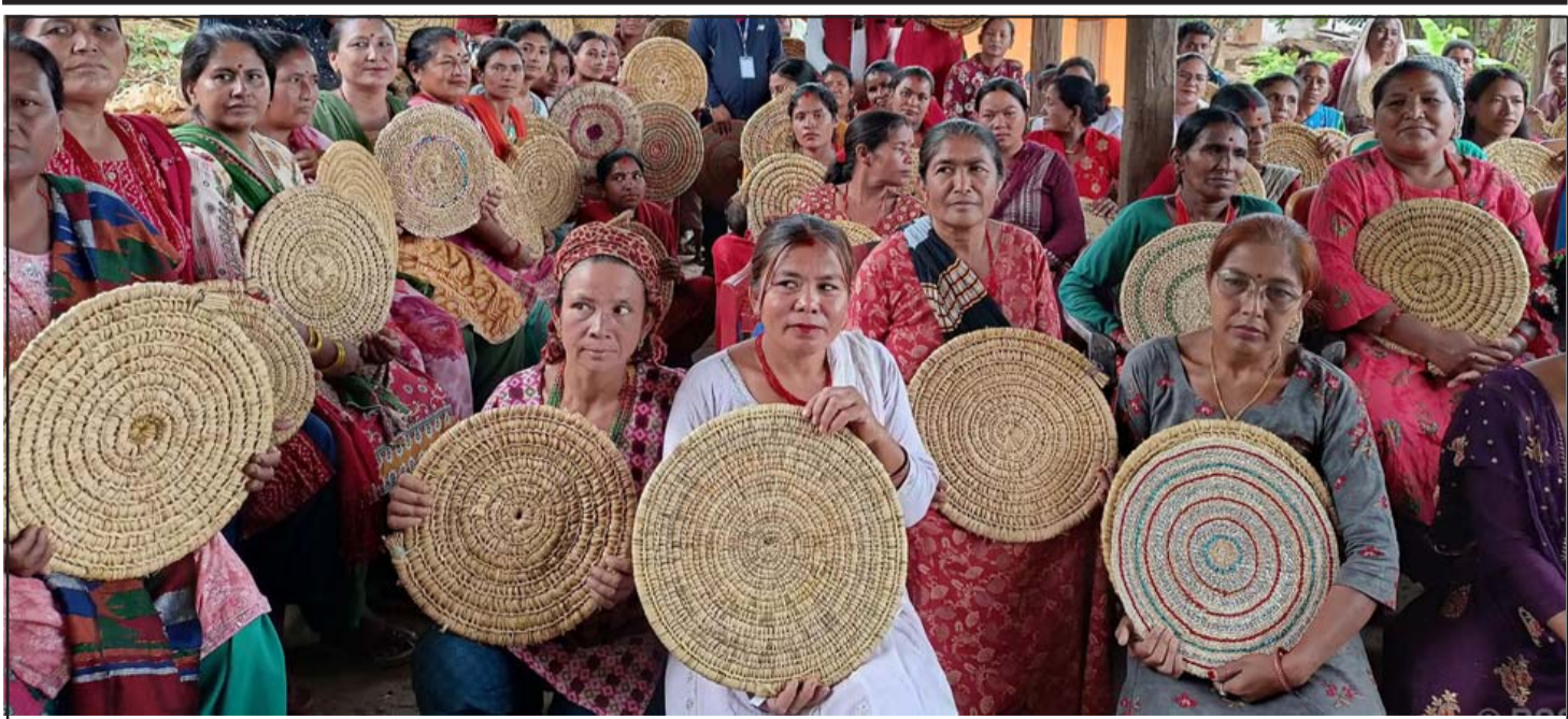
सिन्धुलीका महिलाले निर्माण गरेको चकटी: सिन्धुलीको कमलामाई नगरपालिका-४ ज्यामिरेका महिला आफूले बनाएको चकटी देखाउँदै। कमलामाई नगरपालिका-४ को वडा कार्यालयले यहाँका ५० जना महिलालाई १० दिने तालीममा पराल, बाबियो, थाकल, खर र खोस्टाको चकटी बनाउन सिकाएको थियो। उनीहरू आजभोलि चकटी बिक्री हुने बजारको खोजीमा छन्।

कुनै पनि देशको आर्थिक विकास हुनका लागि त्यस देशमा स्थिर र शक्तिशाली सरकार हुन आवश्यक छ।