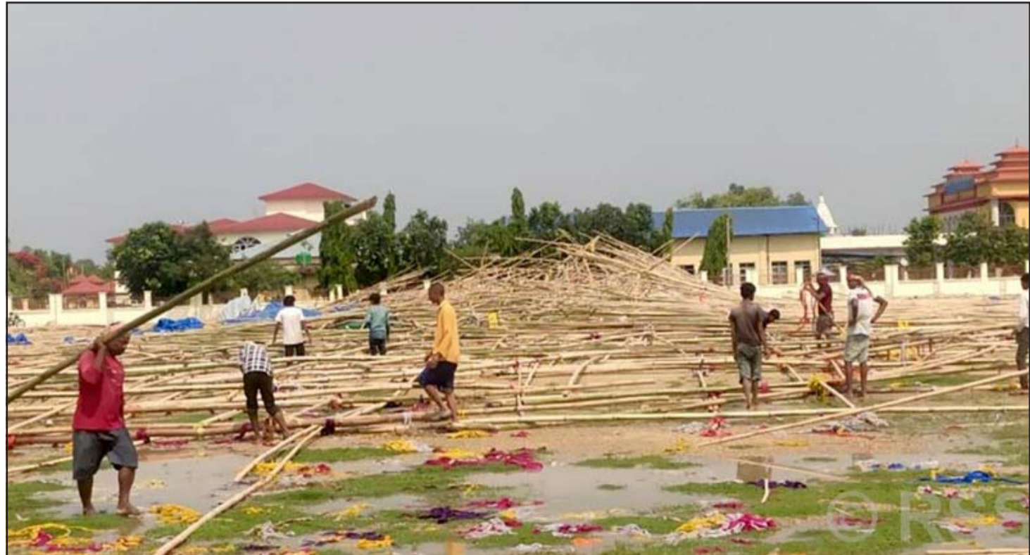
वर्षा र हावाहुरीले क्षति: सोमवार राति आएको वर्षा र हावाहुरीले जसपा नेपालको आगामी जेठ २८ गतेदेखि हुने एकताको प्रथम राष्ट्रिय महाधिवेशनको लागि जनकपुरधामको तिरहुतियागाछी मैदानमा निर्माणाधीन टेन्ट, मञ्चलागायत भत्केपछि व्यवस्थापन गर्दै मजदूरहरू।

बाथरोग लागेकामध्ये आम बाथरोग दुई तिहाइ महिला र एक तिहाइ पुरुषमा