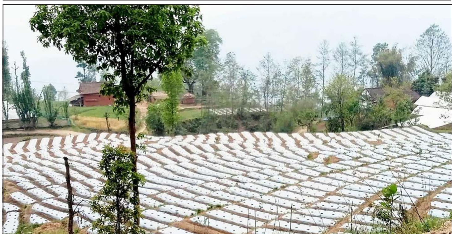
अकबर खुसानीखेती: भोजपुर नगरपालिका-५ बोखिमका किसानले मलिचड प्रविधिबाट गरिरहेको अकबर (डल्ले) खुसानीखेती। यहाँका किसानले व्यावसायिक अकबर खुसानीको खेतीबाट मनग्य आम्रानी गर्दै आएका छन्।