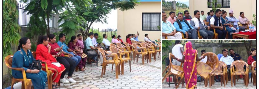
अध्यक्ष गर्मी बढेसँगै भवनबाहिर गर्ने कार्यक्रमहरू प्रभावित भएका छन्। नदीजन्य पदार्थको चरम उत्खनन, दोहन र वनजङ्गलको विनाश बढेसँगै वातावरण असन्तुलनले तराई-मधेसमा मात्र होइन पहाडी र हिमाली भेगमा समेत यसको प्रभाव बढ्दो छ। निजगढ नगरपालिका कार्यालय परिसरमा गणतन्त्र दिवस मनाइरहेका एकाबिहानै अचाक्ली गर्मी बढेपछि रूखको छहारीमा बसेका कार्यक्रमका सहभागीहरू।