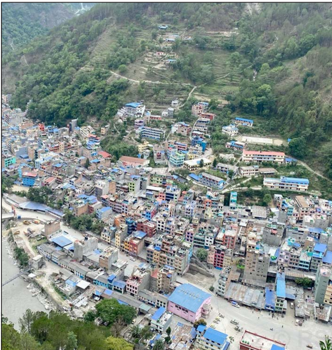
बेनी बजार : म्याग्दीको सदरमुकाम बेनी बजार। पछिल्लो समय घर निर्माण गर्ने क्रम बढ्दै जाँदा बेनी बजारको बस्ती घना भएको छ।