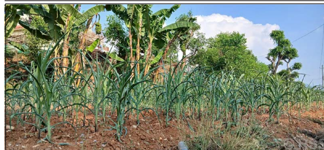
खडेरीले सुकेका मकै : लामो समय खडेरी परेपछि तनहुँको व्यास नगरपालिका-१० बैरेनीको बारीमा लगाइएको सुकेका मकै। पर्याप्त मात्रामा पानी नपर्दा खेतबारीमा लगाइएका मकै सुकेर उत्पादन घट्ने देखिएको कृषि ज्ञान केन्द्र तनहुँले जनाएको छ।