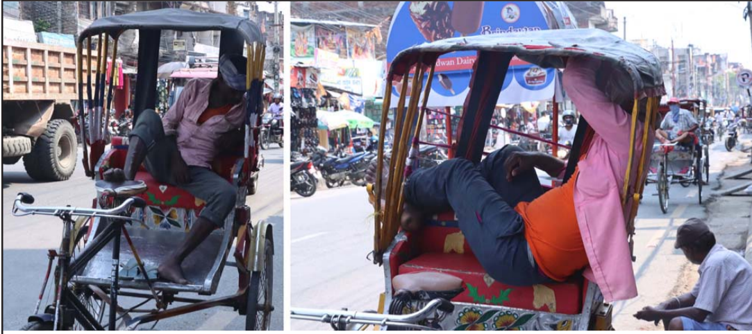
पर्सा र बाराको तापक्रम बढेपछि दैनिक जनजीवन निकै कष्टकर भएको छ। शारीरिक बलबाट चलाउनुपर्ने रिक्शाचालकहरूलाई यतिबेला निकै अठ्ठरो पर्ने गरेको छ। शुक्रवार वीरगंजको माईस्थान क्षेत्र वरपर रिक्शामा विश्राम गर्दै दुई चालकहरू।