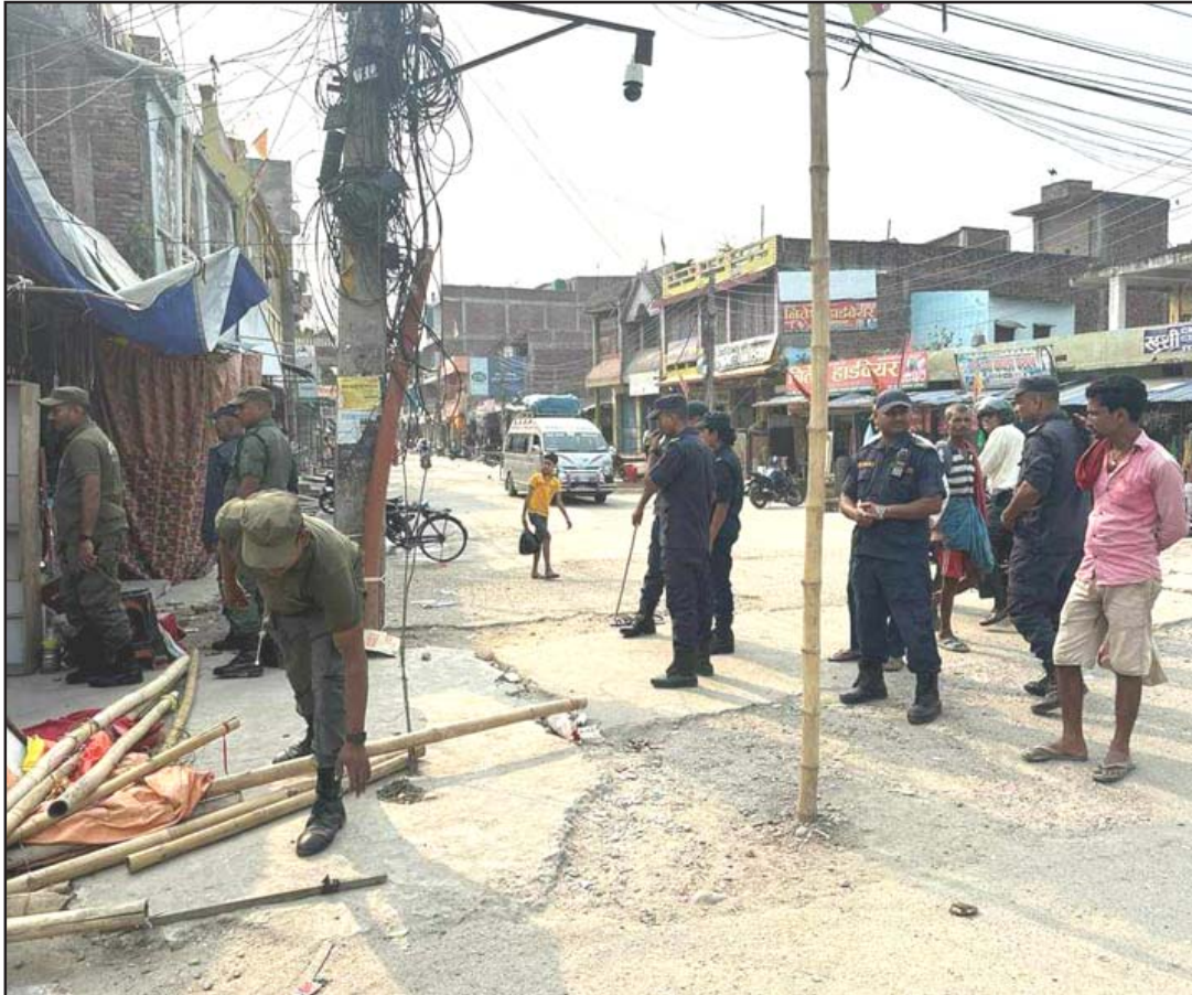
सर्लाही जिल्लाको सदरमुकाम बरहथवा बजारमा नाला अतिक्रमण गरी बनाइएको संरचना हटाउँदै प्रहरी ।