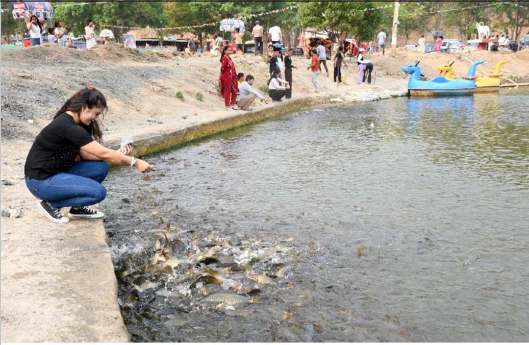
माछालाई चारो विदे पर्यटक: दाङको घोराही उपमहानगरपालिका-१३ स्थित धार्मिकस्थल बाह्रकुने देहमा व्यवस्थापन समितिले छाडेका माछालाई चारो दिएर माछा हेर्दै आन्तरिक पर्यटक।

एउटै पाइपलाइनबाट पेट्रोल र मट्टिलेन आयात गर्न सम्भव भएपनि भण्डारण गर्ने क्षमता नहुँदा अहिले ट्याङ्करबाटै पेट्रोलियम पदार्थ ल्याउनुपर्ने बाध्यता छ। पाइपलाइनबाट पेट्रोलियम पदार्थ आयात हुँदा प्राविधिक नोक्सानी शून्य हुने, ढुवानी खर्च जोगिने तथा वातावरणीय प्रदूषण कम हुन सहयोग पुग्नेछ।