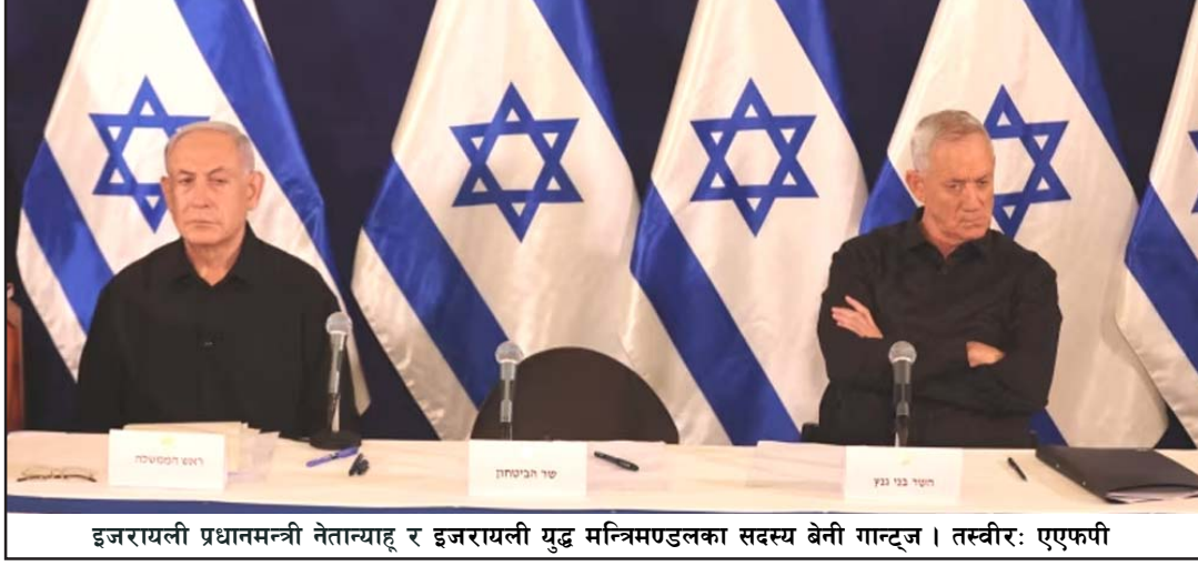
इजरायली प्रधानमन्त्री नेतान्याहू र इजरायली युद्ध मन्त्रिमण्डलका सदस्य बेनी गान्ट्ज।

इजरायल, ६ जेठ/एएनआई गाजामा जारी युद्धलाई लिएर इजरायली नेताहरूमा बढ्दै गइरहेको तनावकाबीच इजरायली युद्ध मन्त्रिमण्डलका सदस्य बेनी गान्ट्जले तीन हप्ताभित्र गाजा युद्धको लागि नयाँ योजना नआए सरकारबाट राजीनामा दिने चेतावनी दिएका छन्। उनको यो कदमले प्रधानमन्त्री बेन्जामिन नेतान्याहूलाई आफ्नो अति-दक्षिणपन्थी सहयोगीहरूमा बढी निर्भर बनाउनेछ।