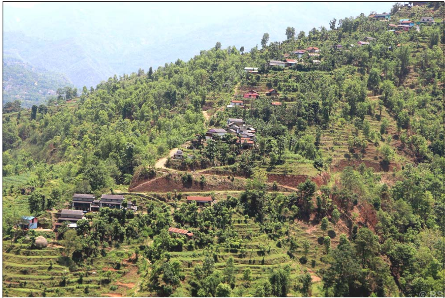
बसाइँसराइका कारण बस्न योग्य घर खाली: बसाइँसराइले रिक्तिदै गएको बागलुङको जैमिनी नगरपालिका-५ स्थित बिनामारे गाउँ। एक दशक अगाडिसम्म ८८ घरपरिवार रहेकामा अहिले करीब ३० घरपरिवार मात्र छन्। यहाँबाट दैनिक बसाइँसराइ गर्नेको सङ्ख्या बढ्दै गएको छ।