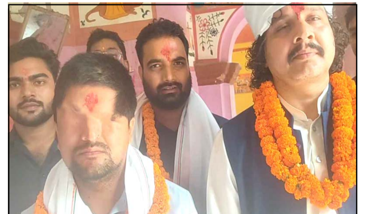
रास्वपाका नेता प्रसाईं र सांसद ढकाल ।

उनले सिम्रौनगढको विकास हुन नसक्नुमा ३० वर्षदेखि शासन गर्दै आएका दलहरू बढी जिम्मेवार भएको आरोप लगाए ।