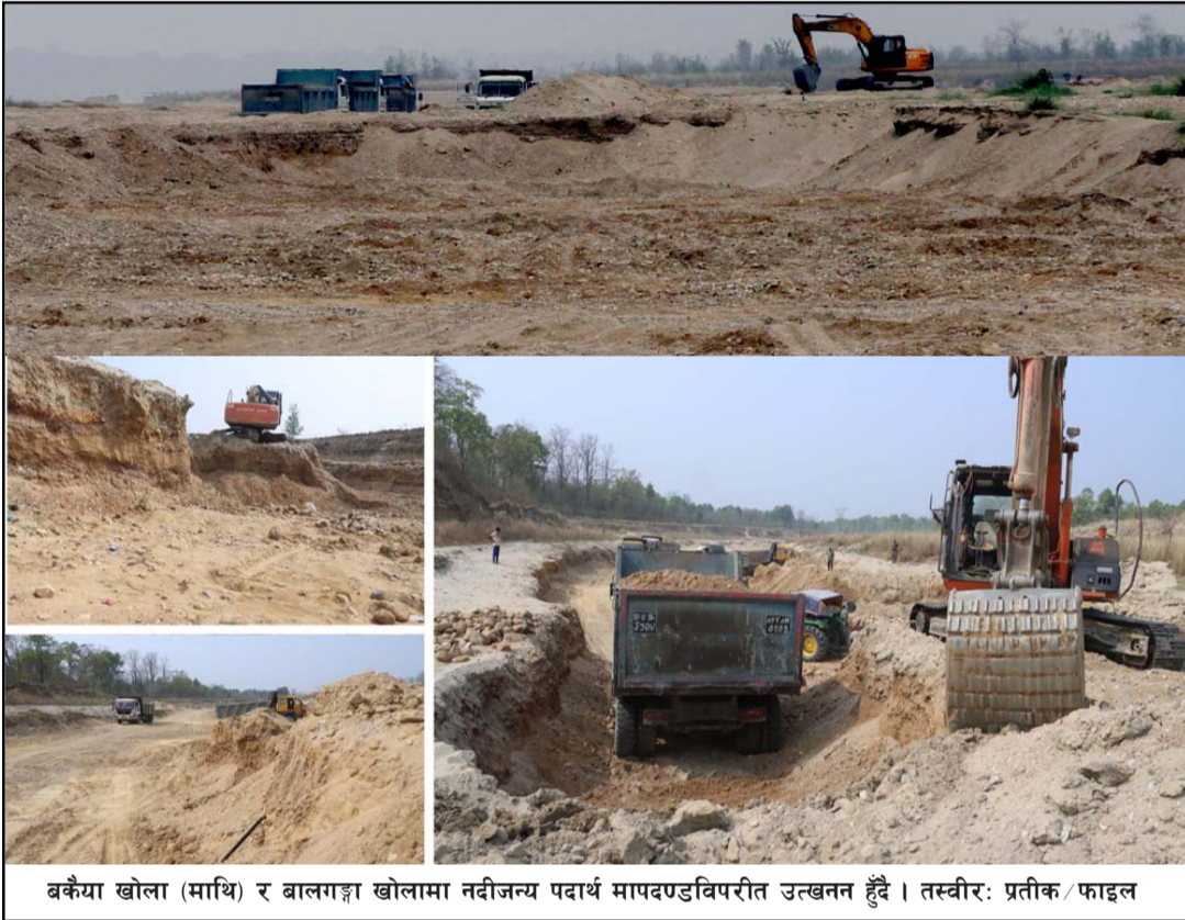
बकैया खोला (माथि) र बालगङ्गा खोलामा नदीजन्य पदार्थ मापदण्डविपरीत उत्खनन हुँदै ।

सिमसार क्षेत्र सुक्ने क्रम बढेको ती किसानको भनाइ छ । सफेदाका पातमा भएको अम्लले वर्षामा बाधा पुऱ्याउने गरेको किसानहरू बताउँछन् । पातको अम्लले वर्षाका लागि तयार हुने बादल तयार हुन नदिने गरेको र पानीको वाफसँग रासायनिक प्रतिक्रिया गरी