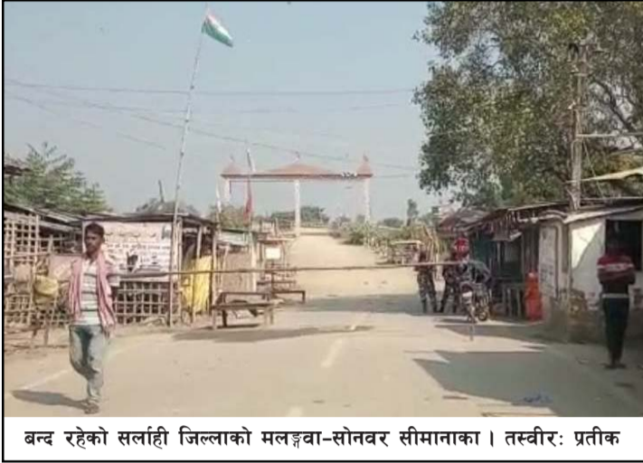
बन्द रहेको सर्लाही जिल्लाको मलङ्गा-सोनवर सीमानाका ।

यसैगरी, रौतहट जिल्लाको राजदेवी नगरपालिका-९ ब्रह्मपुरीदेखि ईशनाथ नगरपालिका-१ बन्जरहासम्म बन्द हुने जनाइएको छ भने सिराहाका सबै नाका बन्द हुने जनाइएको छ ।