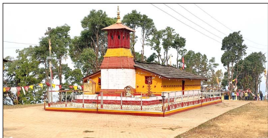
मल्लिकार्जुन राष्ट्रिय धाम: दार्चुला जिल्लाको मल्लिकार्जुन गाउँपालिका-३ मा अवस्थित प्रसिद्ध धार्मिकस्थल शैल्य मल्लिकार्जुनमा द्वादश ज्योतिर्लिंग अर्थात् मल्लिकार्जुन राष्ट्रिय धाम।

बिदाईको समय नगद नारायण एक-दुई रुपियाँदेखि पाँच-दशको नोट कतैकतै २० रुपियाँसम्म दिइन्थ्यो। हुनत लालाबालाहरूले विवाहमा प्राप्त गरेको नगद नारायण माताजीहरूद्वारा 'चारआना' (पच्चीस पैसा) आठआना (पचास पैसा) ले साट्टिदिने अवस्था वास्तवमा अत्यन्तै रोचक थियो। हालको पुस्ता त्यो परिवेशबाट वञ्चित भइसकेको छ। मधेसी सभ्यताको अद्भुत परम्परा भातवान अहिले अपवादबाहेक रिसराग र द्वेषमा परिणत हुन थालेको दुःखद अवस्था छ।