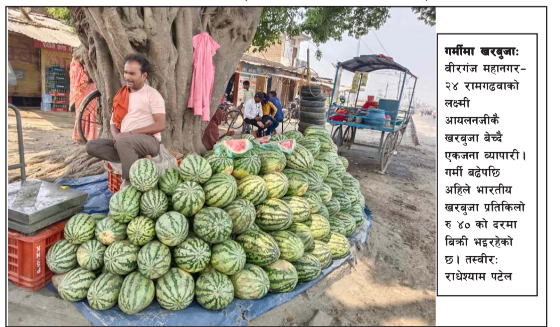
गर्मीमा खरबुजा: वीरगंज महानगर-२४ रामगढवाको लक्ष्मी आयलनजीकै खरबुजा बेच्दै एकजना व्यापारी। गर्मी बढेपछि अहिले भारतीय खरबुजा प्रतिकिलो रु ४० को दरमा बिक्री भइरहेको छ।