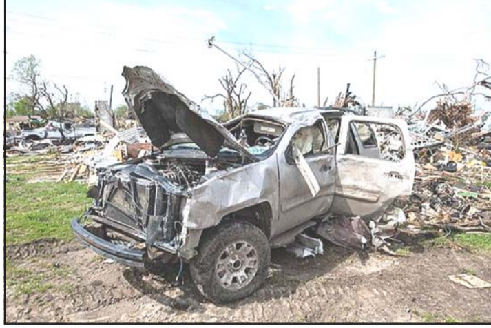
घाइते भएका थिए, जसमध्ये चारको अवस्था गम्भीर रहेको छ। ट्रक चालकलाई प्रहरीले हिरासतमा लिएको छ। रासस

बिस्केक, २१ वैशाख/सिन्धुवा दक्षिणी किर्गिजस्तानमा बिहीवार एक उत्सव कार्यक्रममा विद्यार्थीहरूको समूहलाई मिनी ट्रकले ठक्कर दिँदा ३१ जना बालबालिका घाइते भएको आन्तरिक मामिला निर्देशनालयले जनाएको छ। जलालाबाद क्षेत्रको सुजाक जिल्लामा मानस नामको एक कार्यक्रममा सहभागी बालबालिकाहरू घाइते भएका थिए। बालबच्चाका लागि आइसक्रिम बोकेको मिनीट्रक चालकको असावधानीका कारण सडकबाट एकाएक विद्यार्थीको भीडमा खसेको थियो। स्वास्थ्य मन्त्रालयका अनुसार दुर्घटनामा ९-१६ वर्षका ३१ बालबालिका