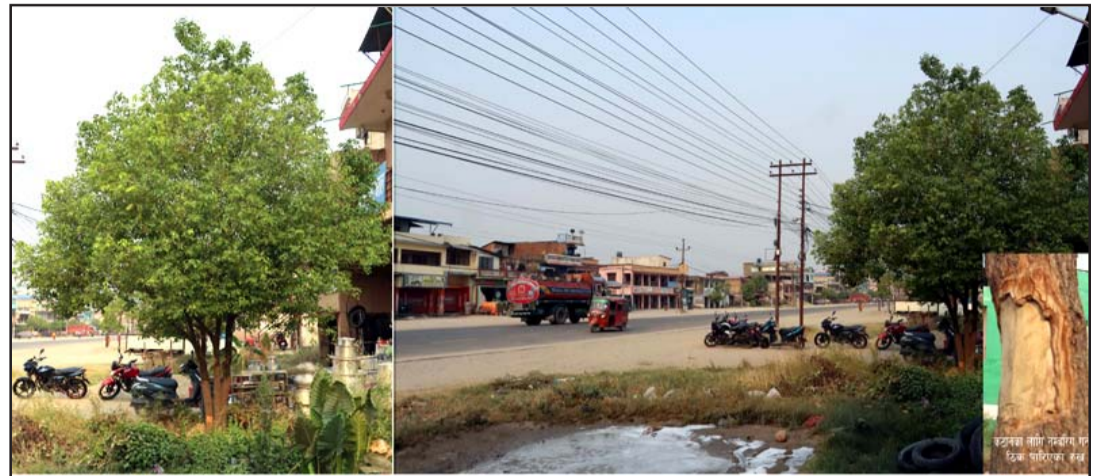
पूर्व-पश्चिम महेन्द्र राजमार्गको निजगढ सडकको दायो/बायो चार वर्ष अघि रोपिएका हरिया रूखहरू राजमार्ग विस्तारको नाममा काटिने भएका छन्।

सानो, रोप्ने कार्यतर्फ सम्बन्धित सरोकारवाला निकायहरूले बेलायत ध्यान जानुपर्ने स्थानीय प्रकाश श्रेष्ठले बताए। आवश्यकता महसूस गरी रोपिएका