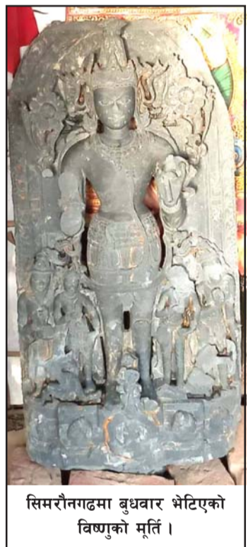
सिमरौनगढमा बुधवार भेटिएको विष्णुको मूर्ति।

प्रतिनिधित्व मूर्तिले मात्र गरेको हुन्छ भन्ने होइन तर तत्कालीन मानिसको कला, आस्था तथा आध्यात्मिक पक्षबारे