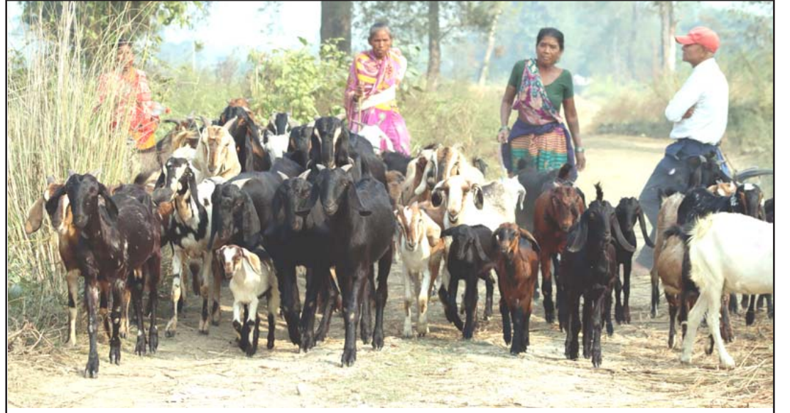
बढी भएर पनि सकेको भ्रम गर्नुपर्छ भन्दै चौपायाको गोठालो लादै कोल्हवीका स्थानीय। बस्तीनजिकको वन क्षेत्रमा चरिचरणका लागि पशु चौपाया धपाउँदै। जताततै वनमा उडेलो लानाले झन्डै दुई महीनायता चरिचरणको अभाव छ।

इजरायली र गाजा दुवै छेउमा सडकहरू पक्का गरेपछि गाजा पट्टीको उत्तरी भागमा पर्याप्त मात्रामा सहयोगको प्रवेशलाई सक्षम बनायो। मार्चमा इजरायली सैनिकहरूले गाजामा फेला परेको सबैभन्दा ठूलो सुडको विध्वंस गरी इरेज सीमा क्रसिडसम्म तथा हमासको छेउमा थियो। अक्टोबर ७ मा गाजा सीमानजिकै इजरायली समुदायहरूमा हमासको आक्रमणमा कम्तीमा एक हजार दुई सय मानिस मारिएका थिए भने २४० इजरायली र विदेशीलाई बन्धक बनाइएको थियो। रासस