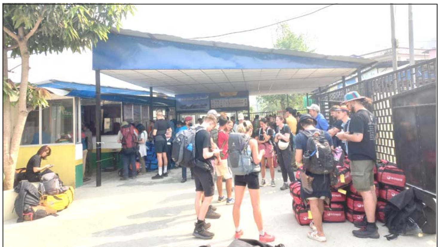
मन्थली विमानस्थलमा पर्यटक: सगरमाथालागायत हिमाल आरोहण र पदयात्राका लागि रामेछापको मन्थली विमानस्थलमा लुक्ला उड्ने जहाजको प्रतीक्षामा बसेका विदेशी पर्यटक।

माथि नाम लेखाउन चाहने चिकित्सकहरूले यस दैनिकको वार्षिक ग्राहक हुन जानकारी गराइन्। सम्पर्क: बजार व्यवस्थापक जीतेन्द्र पटेल मोबाइल नं. ८८४०४९७५८, ८८०७७७७५३