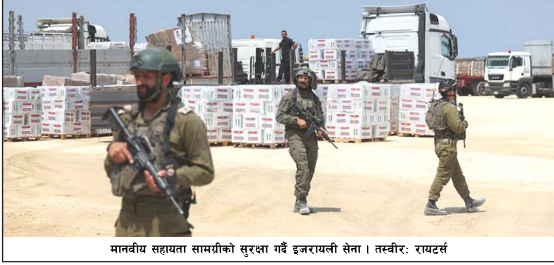
मानवीय सहायता सामग्रीको सुरक्षा गर्दै इजरायली सेना।

इजरायल, २० वैशाख/एनआई/टिपिएस इजरायलले अक्टोबर ७ मा शुरू भएको विनाशकारी युद्धको श्रृंखलापछि रोकिएको इरेज क्रसिडमार्फत जोर्डनबाट उत्तरी क्षेत्रमा खाद्यान्न र चिकित्सा आपूर्तिलाई पुनः खुल्ला गरेको छ। गाजाको उत्तरी सीमामा अवस्थित एकमात्र क्रसिड क्षेत्रमा सामान भरिएका ३० वटा ट्रक पठाइएको हो। युद्धअघि पैदलयात्री यातायातका लागि एकमात्र क्रसिड प्वाइन्टका रूपमा सञ्चालनमा थियो। आक्रमण पहिले, मुख्यतया कटनीतिज्ञ, सहायता कर्मचारी र पत्रकारहरू र प्यालेस्टिनीहरूले उक्त मार्ग