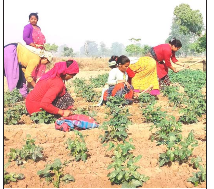
लहरे तरकारीबाली गोडमेल: धनगढी उपमहानगरपालिका-९ मा सञ्चालित लहरे तरकारीबाली गोडमेल गर्दै आइपिएम कृषक पाठशालाका महिलाहरू।

पत्रकारिता क्षेत्रमा प्रविधिको हस्तक्षेप बढेको छ र यसका राम्रा-तराम्रा दुवै प्रभाव यस क्षेत्रमा अनुभूत गरिएको छ भन्दा अतिशयोक्ति हुँदैन। इन्टरनेटमा आधारित डिजिटल प्रविधिले