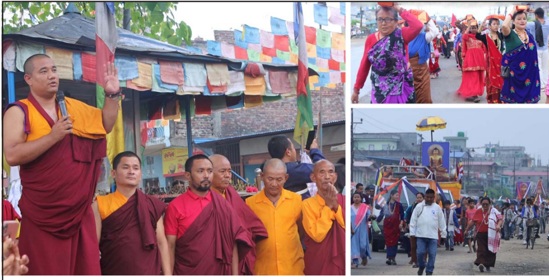
निजगढमा आयोजित २५६औं बुद्ध जयन्तीको अवसरमा भगवान् बुद्धको उपदेशबारे जानकारी दिँदै गुरु लोपेन दोर्जे हेले र शान्ति ज्योतीमा सहभागीहरू।