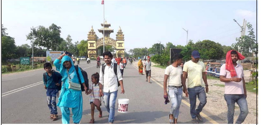
निर्वाचनको लागि घर फर्कदै भारतीय नागरिक: छिमेकी मुलुक भारतको बिहार राज्यमा भोलि शनिवार हुने लोकसभा निर्वाचनमा मतदान गर्नका लागि आफ्नो मुलुक फर्कदै भारतीय नागरिक। निर्वाचनका कारण वीरगंज भन्सार कार्यालयसहितका पर्सा जिल्लाका सीमानाका बिहीवारदेखि बन्द भएपनि भारतीय नागरिक हिंडेर सीमापार गरिरहेका देखिन्छन्।

रुसले ती चेतावनीहरूलाई नजरअन्दाज गर्‍यो। आक्रमणको तीन दिन अघि राष्ट्रपति भ्लादिमिर पुटिनले वाशिंग्टनलाई ‘ब्ल्याकमेल’ गरेको र रुसीहरूलाई ‘तसाउने’ प्रयास गरेको आरोप लगाएका थिए। रासस