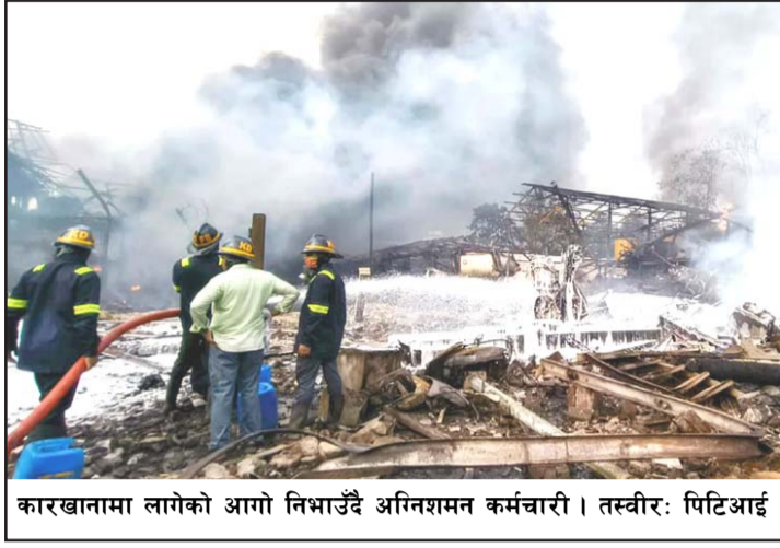
कारखानामा लागेको आगो निभाउँदै अग्निशमन कर्मचारी।

मुम्बईको नजीकै रहेको ठाणो जिल्लाको डोम्बिवली क्षेत्रमा अवस्थित रासायनिक कारखानामा रहेको एउटा वाष्प इन्जिन ठूलो आवाजसहित विस्फोट