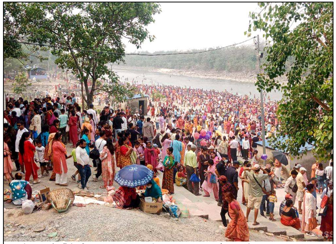
कुम्भ मेलाका दर्शनार्थीको भीड: सुनसरीको बराहक्षेत्रस्थित चतराधाममा गत चैत २७ देखि शुरू भएको पूर्ण महाकुम्भ मेलाको शनिवार १८औं दिन दर्शन गर्न आएका भक्तजनको भीड।