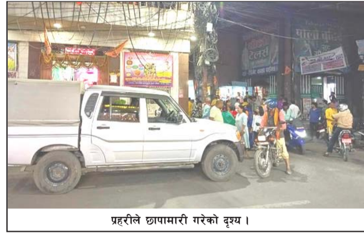
प्रहरीले छापामारी गरेको दृश्य ।

प्रतिनिधित्व हुनेगरी छापामारी गर्नुपर्ने माग गरेको छ । उनले प्रहरीले