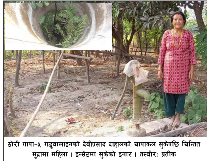
ठोरी गापा-५ गडुवालाइनको देवीप्रसाद दाहालको चापाकल सुकेपछि चिन्तित मुद्रामा महिला । इन्सेटमा सुकेको इनार ।

प्रस, सेढवा, १० वैशाख/ वर्षा नहुँदा पर्साको ग्रामीण क्षेत्रमा पनि पिउने पानीको समस्या बढ्दो छ । भूमिगत पानीको सतह घट्टै गएको र वर्षा नभएको कारण कतिपय पानीका मुहानहरू सुकेर पिउने पानीको समस्या बढेको छ ।