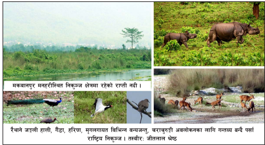
मकवानपुर मनहरीस्थित निकुञ्ज क्षेत्रमा रहेको राप्ती नदी । रैथाने जङ्गली हात्ती, गैँडा, हरिण, मृगलगायत विभिन्न वन्यजन्तु, चराचुरुङ्गी अवलोकनका लागि गन्तव्य बन्दै पर्सा राष्ट्रिय निकुञ्ज ।

अहिले पानीको व्यवस्थापनको लागि १२ देखि १५ फिट खाल्डो खनेर दमकल, मोटरपम्प जडान गर्ने र पानी तान्ने कार्य भइरहेको छ ।