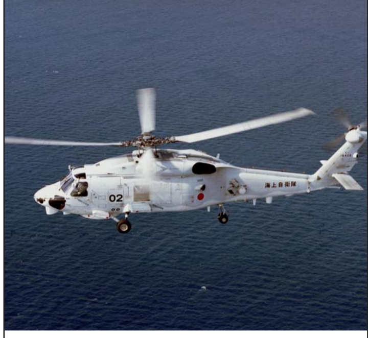
मेरिटाइम स्वरक्षा सुरक्षाबलको SH-60K हेलिकप्टर।

समाचार प्रसारक एनएचकेले वरपरका जल क्षेत्रमा कुनै अन्य विमान वा जहाज नभएकोले घटनामा अन्य देशको संलग्नता नदेखिएको एमएसडिएफले जनाएको बताएको छ। रासस