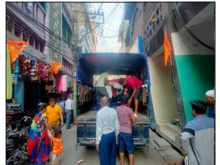
वीरगंज महानगर-३ पमपम बिल्डिङमा रहेको कपडा गोदाममा प्रहरीले छापामारी गरी बरामद कपडा गाडीमा राख्दै ।

भएको बताए । प्रारम्भिक अनुमानमा बरामद कपडाहरू पाँचदेखि सात करोड मूल्यको हुने उनले अनुमान गरे । यो छापामारीमा प्रहरीबाहेक अन्य